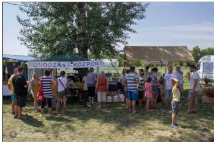
Mindig nagy volt a nyüzsgés a Sport- és Vitamin-napon a sátrunk előtt

mosolyt csalt az ott lévők arcára a BMI- mérő körül kialakult helyzet. Kedves dolog volt, amikor idős házaspárok titkolták párjaik előtt a mért eredményt vagy éppen együtt örültek a hallottaknak. Családok jöttek vagy csak éppen visszajöttek emberek egy kedves mosolyra és egy pohár málnaszörpre. Remélem jól érezték Önök is magukat!