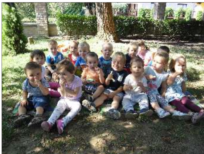
Utolsó nap a bölcsiben