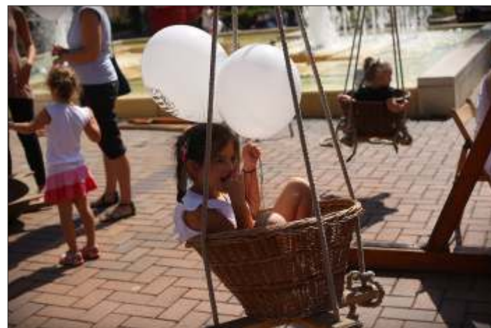
Fotók: Zentai Péter

Idén is részt vettek a programban a katonai hagyományörzők: a Békés Megyei Károlyi-husár és Honvéd Hagyományörző és Kulturális Egyesület, a Magyar Szablyavívó Iskola és a Körösök Völgye Vitézi Bandérium. Őseink katonai ruházatát, fegyverzetét, harcmódot óránként bemutató keretében ismertették meg a közönséggel: a Körösök Völgye Vitézi Bandérium például betyárokat fogott el és elrettentésképpen végigvezették őket a vásáron. A katonai hagyományörző csoportok mellett helyet kapnak a határvasadók, a honvédség és a MATASZ.