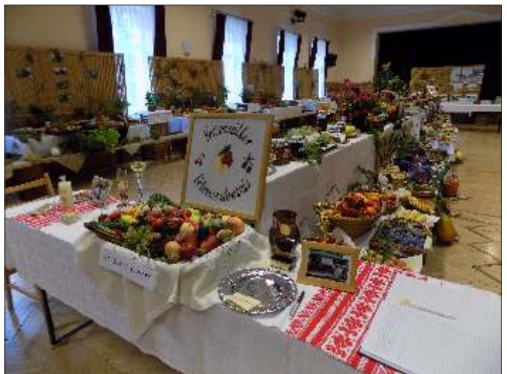
A Regionális Kertészeti kiállításon: Szarvas, Kondoros, Gyomaendrőd és Békésszentandrás Kertbarát Körei mutatkoztak be