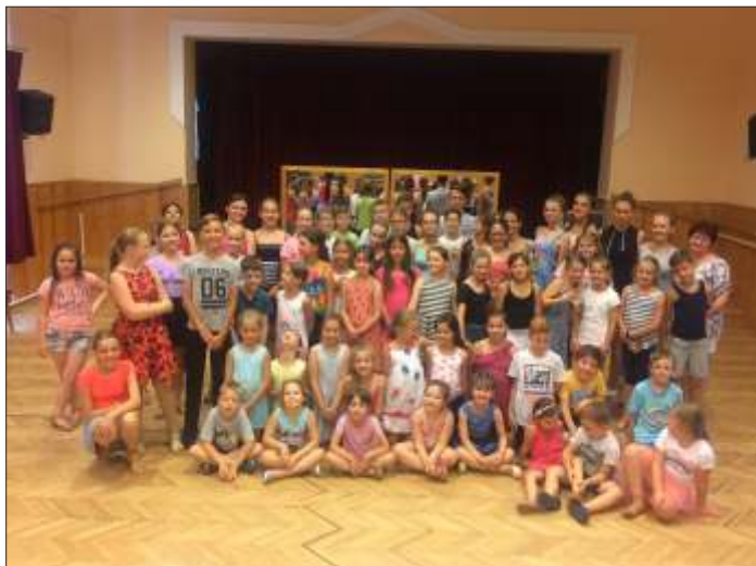
A tábor résztvevői