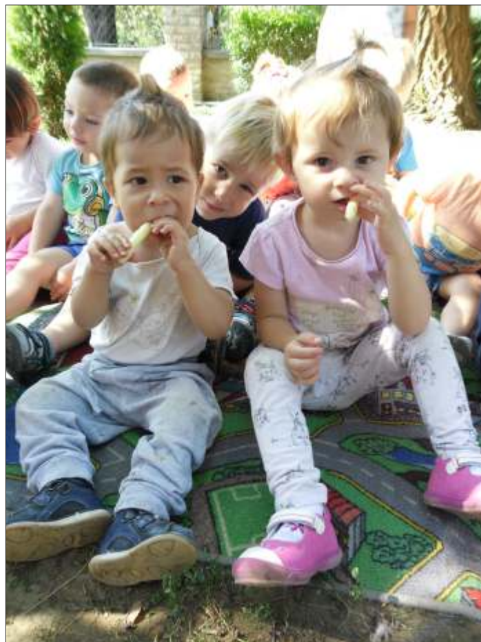
Első nap a bölcsiben