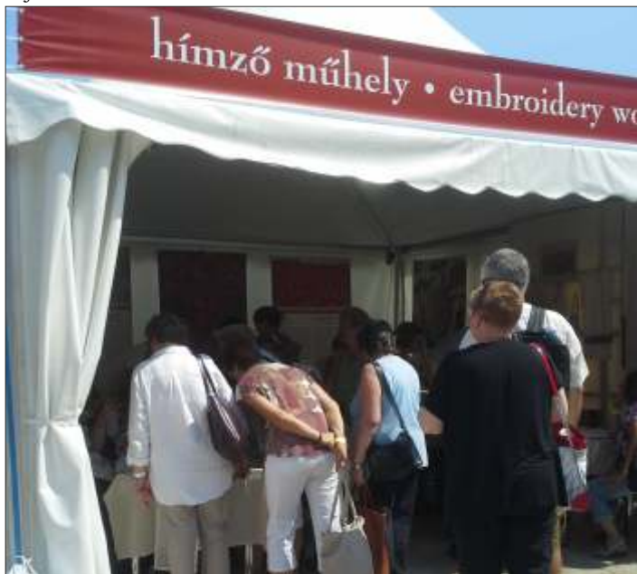
Műhelytől műhelyig jártak a hímzők

A Kézműves Egyesület hímző szakkörének tagjai augusztus 19-én kirándulni voltak Budapesten a Budai Várban rendezett Mesterségek Ünnepén. Az idei rendezvény kiemelt témája a hímzés volt, a magyar népi díszítőművészet egyik leggazdagabb és legváltozatosabb ága. A hímző műhelyekben tájegységenként mutatták be azt a sokszínűséget, amit a népi és úri hímzésben alapanyag, motívumkincs és öltéstechnika tekintetében tapasztalhatunk. Nagyon sok tapasztalattal gazdagodtak hímzőink, amit a szakkörön majd részletesen megbeszélnek, és átültetik azt a saját vásznaikra.