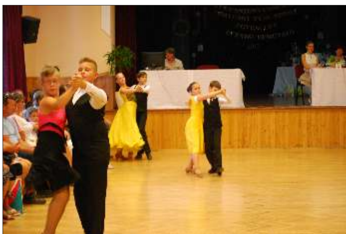
E osztályos párosok