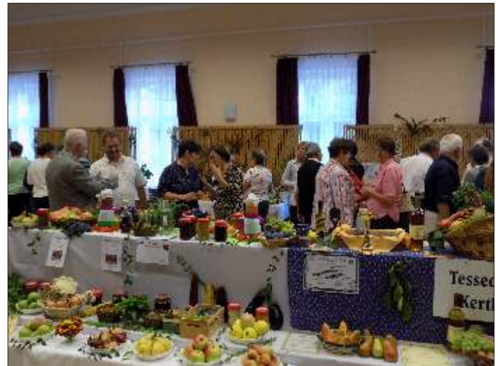
A megnyitón és a három nap alatt nagyon sokan érdeklődtek, megnézték a sok-sok idei termést