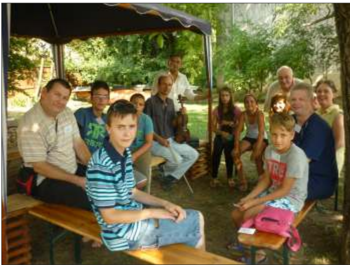
A békésszentandrási parókiakertben helyi bensőséges körben