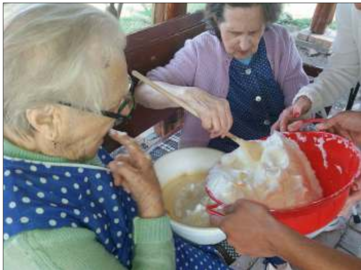
Készül a meggyes piskóta

A nagy nyári melegben is bővelkedtünk programokban, folytatódott „kemence programunk”: az ötven órás közösségi szolgálatot nálunk töltő diákjaink segítségével meggyes piskótát sütöttünk mindenki nagy örömeire. Folytatódtak a felolvasások a hűvös só szobában is. Nagy sikere van a „minden kedden egy vers” programunknak, amikor is az idősek kedvenc verseiből válogatunk és olvasunk egyet-egyét.