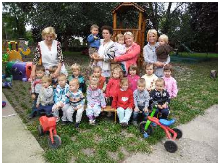
Együtt az apróságokkal