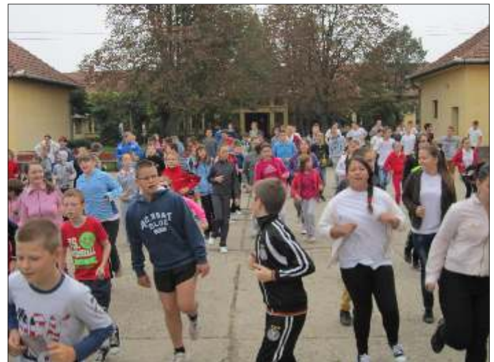
Egy kis szökdelés