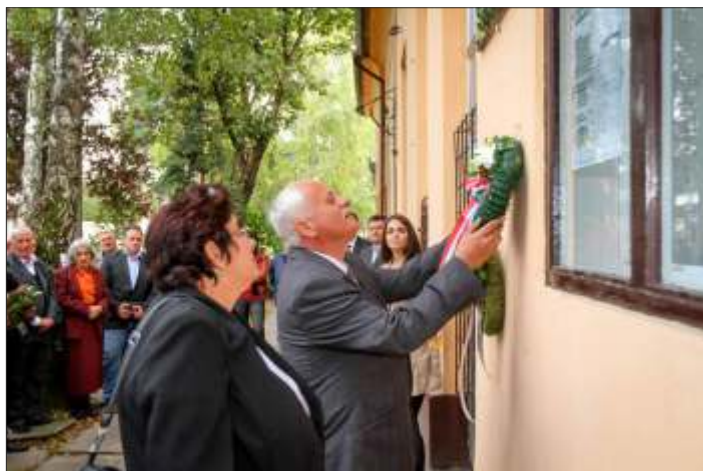
Tisztelgés Csépe Imre emléktáblájánál