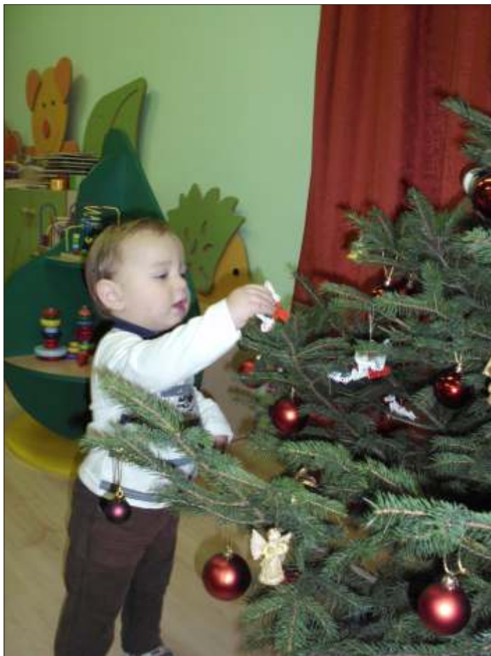
Díszítjük a fát

December 18-án 22 kisgyermek várta izgatottan, amikor végre ünneplőbe öltöztethették a fenyőfánkat, amit az önkormányzattól kaptunk. Ahogyan sorba érkeztek a gyerekek úgy szépült a kis fa. Mindenki ráakasztotta a neki tetsző díszet és szaloncukrot. Közben karácsonyi dalokat énekeltünk, hogy minél jobban ráhangolódjunk