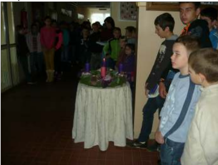
Ég az első adventi gyertya

Kicsiknek és nagyoknak egyaránt a legszebb ünnep a karácsony. A meghitt ünnepig a várakozás a legnehezebb. Advent a készülődés, várakozás időszaka, amit az iskolában sok szép és ünnepi hangulatú eseménnyel tettünk kellemesebbé. Az első adventi gyertya meggyújtására a katolikus templom előtt került sor, ahol a község lakossága is részt vett. Majd az iskolában az első osztályosok verseltek, énekeltek a közelgő ünnepekről. A többi gyertya is így került meggyújtásra, csak később a másodikosok, a harmadikosok és nem utolsósorban a negyedik osztályos tanulók szerepeltek.