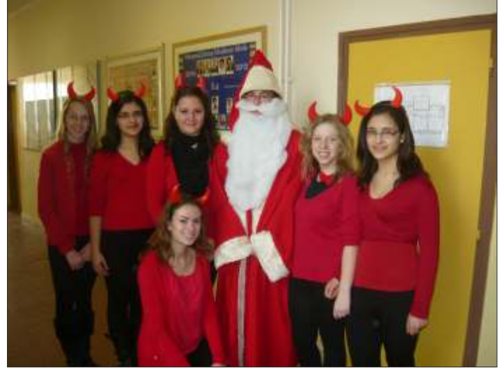
Diákönkormányzat - Mikulás és krampuszai

A Mikulás várás is hagyományosan zajlott. December 6-án reggel a diák-önkormányzatos lányok krampusznak öltözve mesélték el a kisebbeknek a Mikulással kapcsolatos hagyományokat. Első órában az alsó tagozatos gyerekekhez „jött” meg a Mikulás, majd az óvodába és az öregek otthonába indultak, hogy ott is örömet szerezzenek mindenkinek. Igazi színfoltja a falunak az év ebben a szakában a „színes Mikulás –járás”. Délután pedig a felsős osztályoké volt a főszerep, a nagyobbak átadták egymásnak a már előre kihúzott nevekhez tartozó ajándékokat. Felállításra került az iskola karácsonyfája is. Az idén is lelkesen készültek a gömbök, dobozok, majd a világítás is felvillant a fán. Ugyan csak kissé volt hideg, még is jól esett a forró kakaó és kalács, valamint nagy sikere volt a közös éneklésnek.