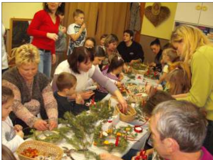
Adventi gyertya készítése