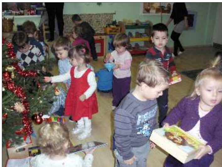
Végre bontogathatjuk az ajándékokat!