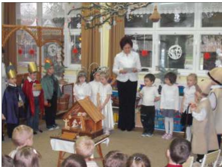
Karácsonyi betlehem a nagyoviban