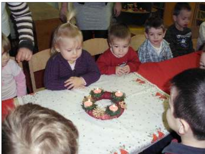
Ég a gyertya ég...