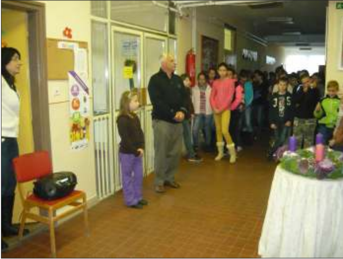
Az első adventi műsor

Kicsiknek és nagyoknak egyaránt a legszebb ünnep a karácsony. A meghitt ünnepig a várakozás a legnehezebb. Advent a készülődés, várakozás időszaka, amit az iskolában sok szép és ünnepi hangulatú eseménnyel tettünk kellemesebbé. Az első adventi gyertya meggyújtására a katolikus templom előtt került sor, ahol a község lakossága is részt vett. Majd az iskolában az első osztályosok verseltek, énekeltek a közelgő ünnepekről. A többi gyertya is így került meggyújtásra, csak később a másodikosok, a harmadikosok és nem utolsósorban a negyedik osztályos tanulók szerepeltek.