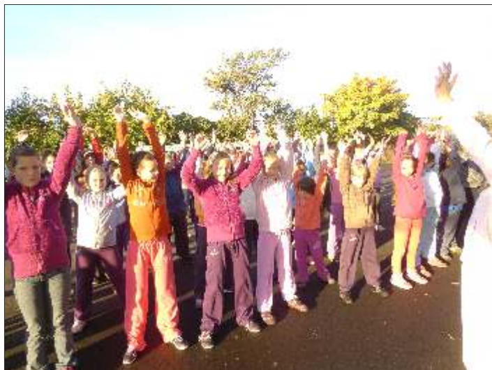
Bemelegítés a kézilabdapályán