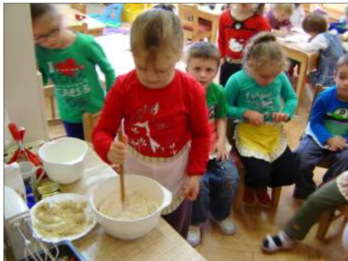
Diós süti készítés