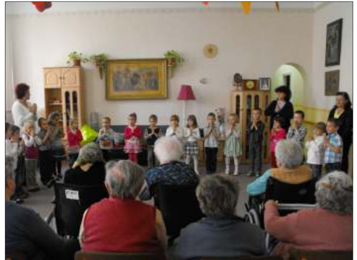
A Katica csoport látogatása időseinknél