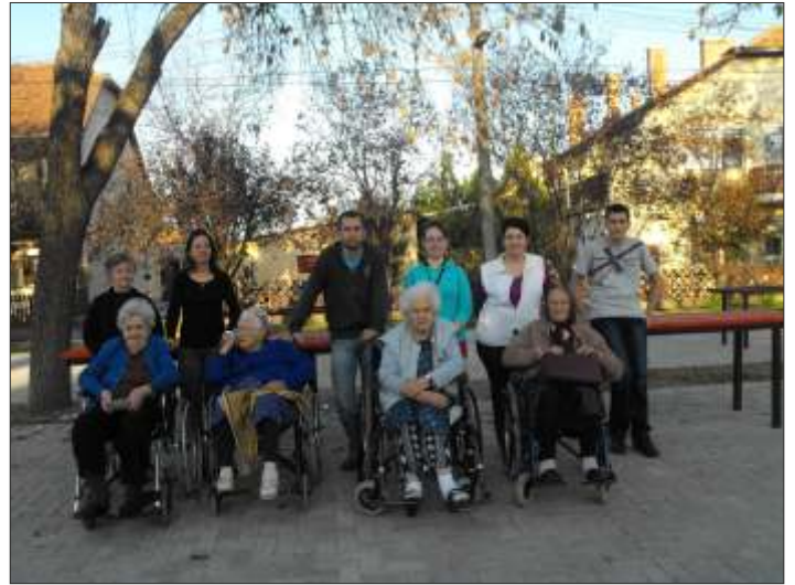
Diákok sétáltak az idősekkel