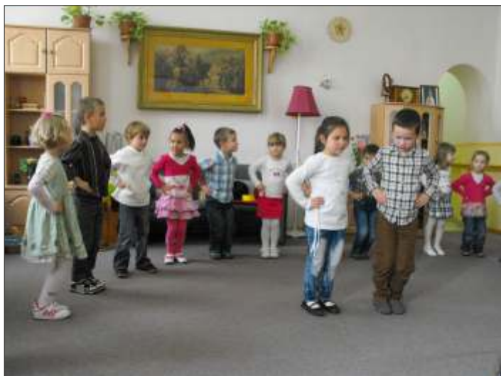
Őszi műsor az időseknél

Legnagyobb esemény az volt, amikor meghívást kaptunk a Pioneer üzembe egy látogatásra, amely óriási élmény volt minden nagycsoportos gyermeknek, de még a felnőtteknek is!