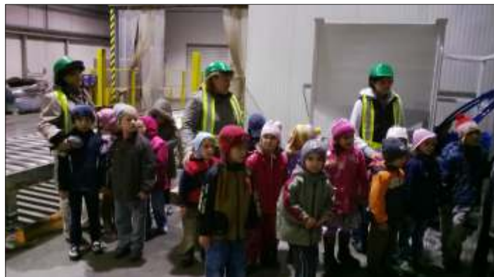
Üzemlátogatás a Pioneernál