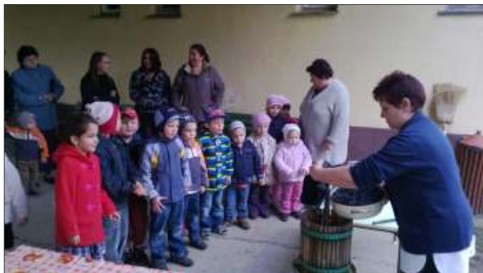
Szüret a kisoviban

Van, aki keseregve érkezik, van aki már ismerősként jön az óvodába, de a változatos óvodai események, az érdekes tevékenységek, a sok játék azonban hamar eltereli a rossz gondolatokat. Így tehát vidáman élvezték a gyerekek az őszi szüretet, a kukoricából, gesztenyéből készülő képeket, bábokat, a kirándulást, az őszi látogatást az időseknél, a dióból készült süteményt, az őszi színházat.