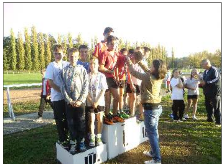
2001-es fiú csapat: III. helyezett