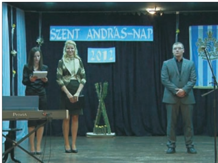
Révész Norbert - legeredményesebb sakkozó