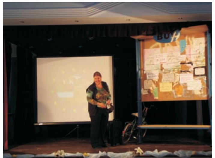
Részlet a monodrámából

„Hontalan vagyok. De vallom rendületlenül, hogy Ő az út s az élet, És maradok ez úton, míg csak élek Töretlen hittel ember és magyar.”