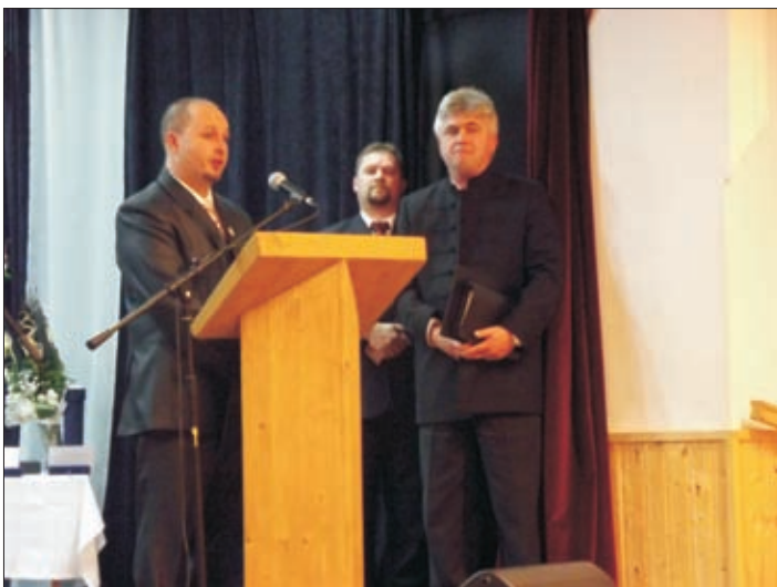
Körösfővel megkötöttük az együttműködési szándéknyilatkozatot