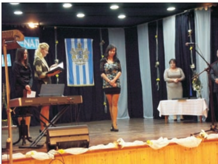
Sinka Petra - legeredményesebb kézilabdás