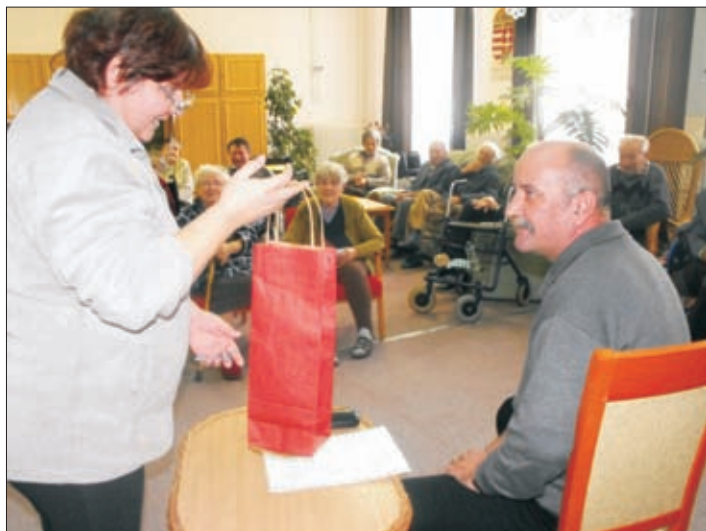
Mesemondó „bácsi” szórakoztatja az időseket