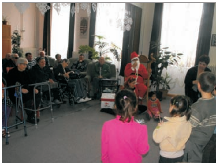
A kis ovisok műsorral és ajándékkal, az idősek igazi mikulással és krampusszal lepték meg egymást