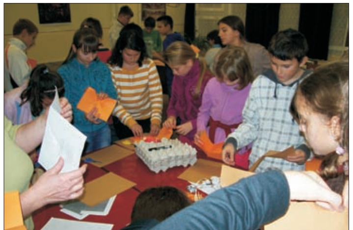
Érdekes dolgok készültek