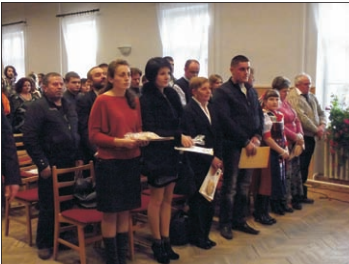
„Hazám, hazám, te mindenem...” - állampolgársági eskütétel