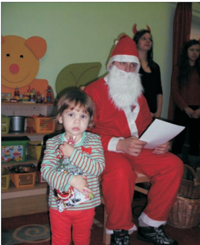
Ez már az enyém!