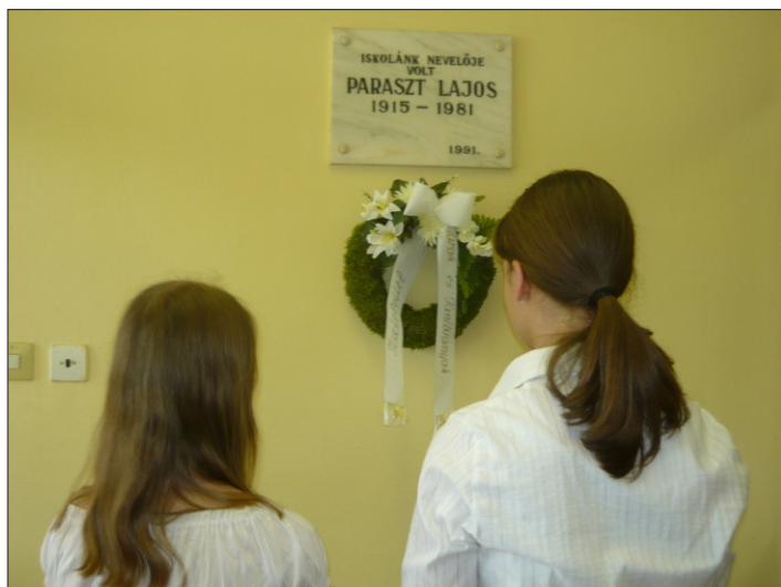
A Tanár Úr emléktáblája