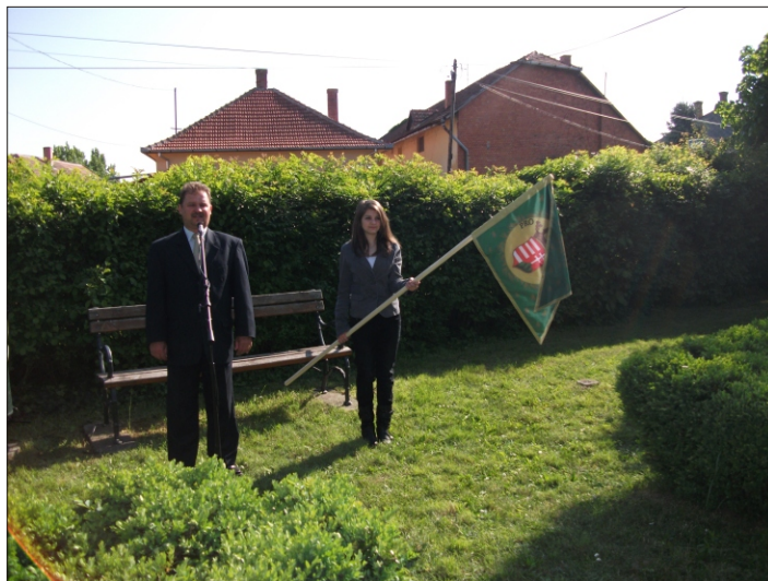
A Rákóczi szabadságharc lovassági zászlójával

A rendezvényen sor került a történelmi zászlószorozat újabb darabjának átadására, mely a Rákóczi szabadságharc lovassági zászlója. Így már hatra szaporodott a zászlók száma, mert ezt megelőzően április 18-án a Jubileumi Emlékháznál bekerült a sorba az anjok lobogója.