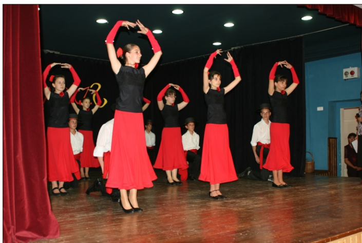
7.b - Desperado