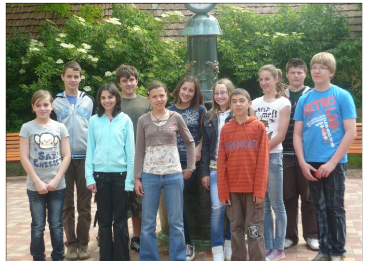
Mezőtúr - Informatikaverseny résztvevői