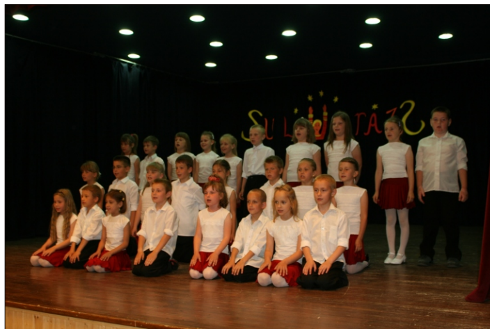
1.a - Bánat utca

És most következnek a varázslat képekben: