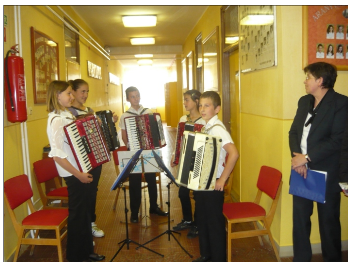
A Paraszt Lajos Matematikaverseny ünnepélyes megnyitója