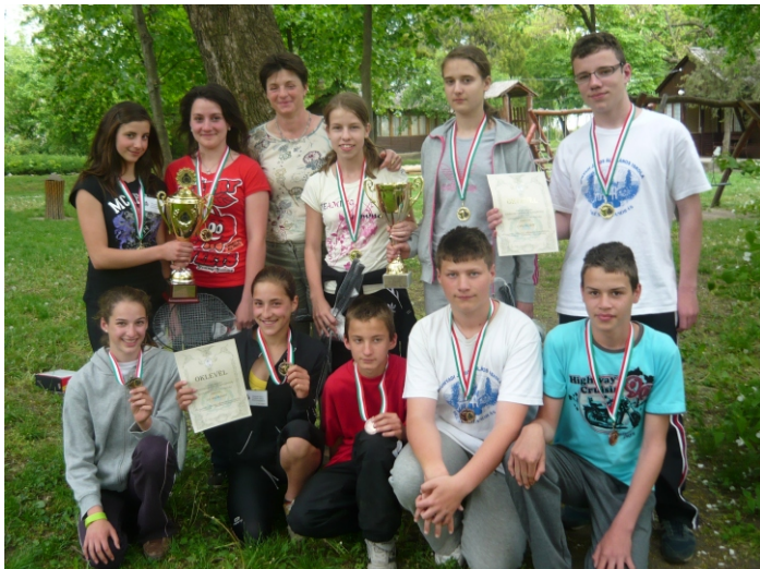
A megyei verseny arany- és bronzérmes csapata

A felkészülés tehát tovább folytatódott, már inkább a gyakorlati feladatokra összpontosítva. Itt szeretném megköszönni mindenkinek, hogy hozzásegítették a gyerekeket az eredményeik eléréséhez és együttal megmutatták számukra az önkéntesen vállalt munka értékét is!