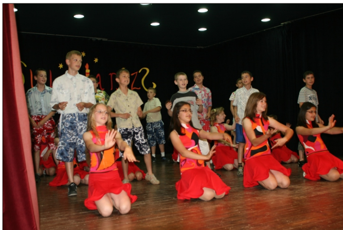
5.a - Pago, pago