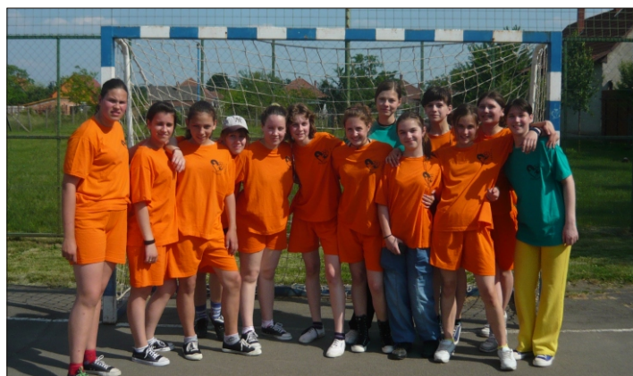
A kishegyesi kézilabdások...

A második ajándékra sem kellett sokáig várni. Péntek délután – néhány év kihagyása után – ismét megrendeztük a Czizglédszky Sámuel Emléktornát. A tornán négy labdarúgó-, és két kézilabdacsapat vett részt. Az élet igazán igazságos volt, hiszen az egyik kupát a kishegyesi labdarúgócsapat vihette haza, a másik viszont a békésszentandrásai lányok birtokába került.