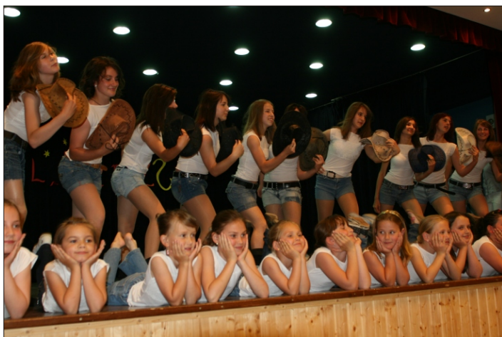
DÖK - All summer long