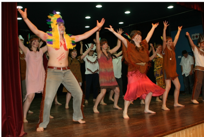
7.a - Indiántánc