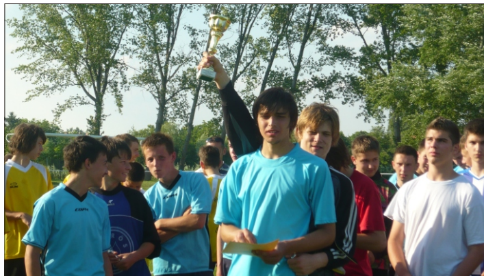
...és a futballisták a kupával

A harmadik ajándékot nem a gyerekek kapták, hanem ők adták. Nekünk, pedagógusoknak, mert a gyermeknapot követően a naptárban egy újabb jeles nap található. Megható volt, ahogyan tanítványaink átnyújtották zenés műsorukat, köszöntve ezzel nyugdíjas pedagógusainkat, és a hegyesi iskola küldöttségét is.