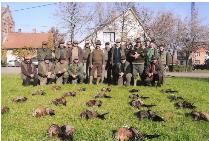
A fenti kép 2010 október 31-én készült. 42 fácán a terítéken.