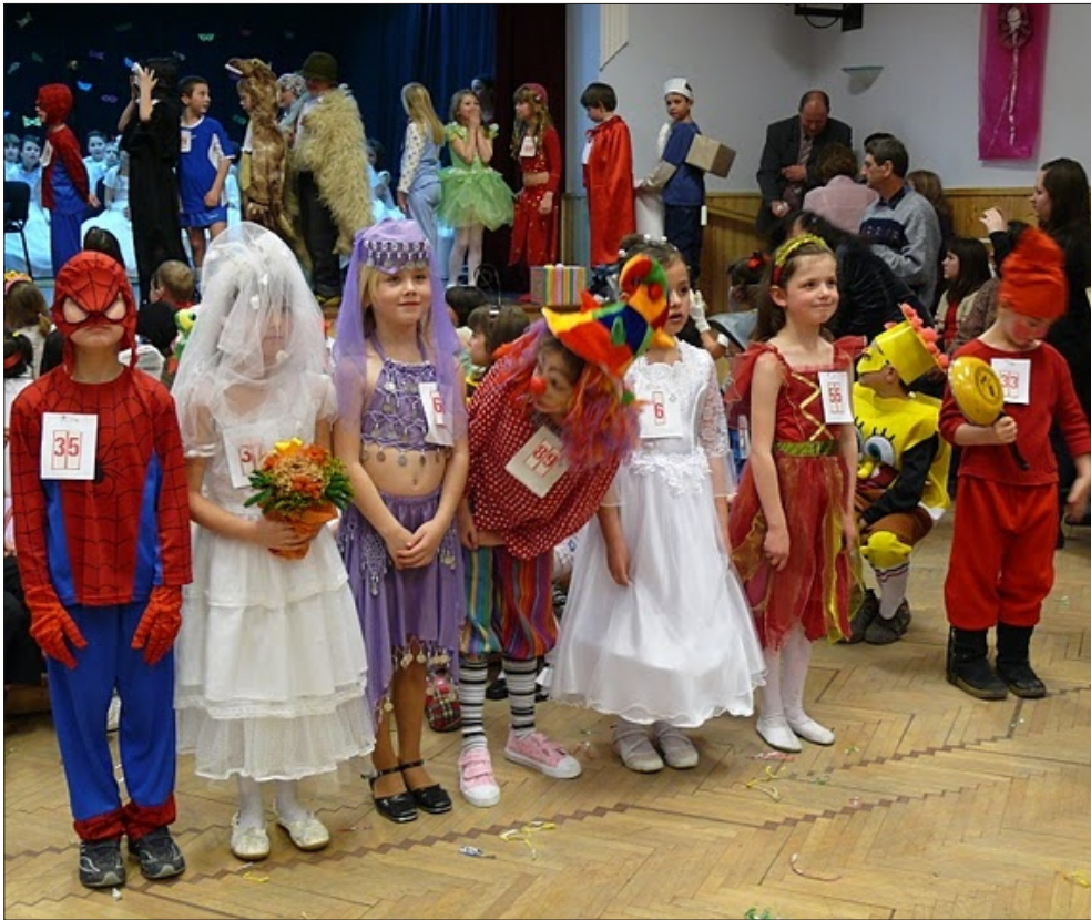
Maskarába bújva - 2009.