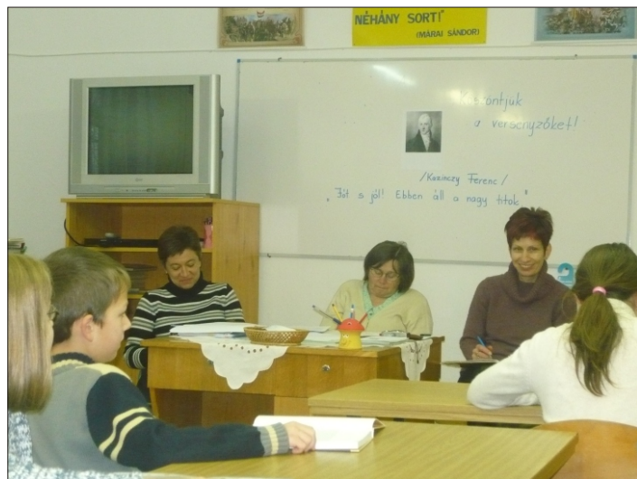
A zsűri tagjai