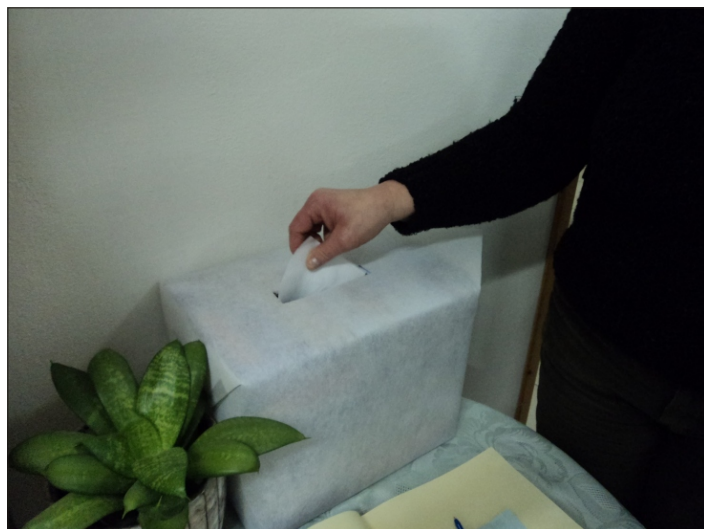
Újdonság: a legjobban tetsző képre szavazni lehetett