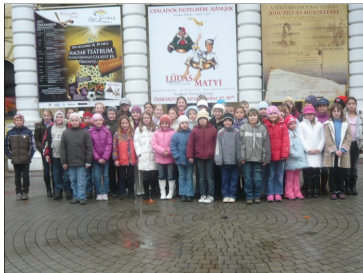
A Jókai Színház előtt