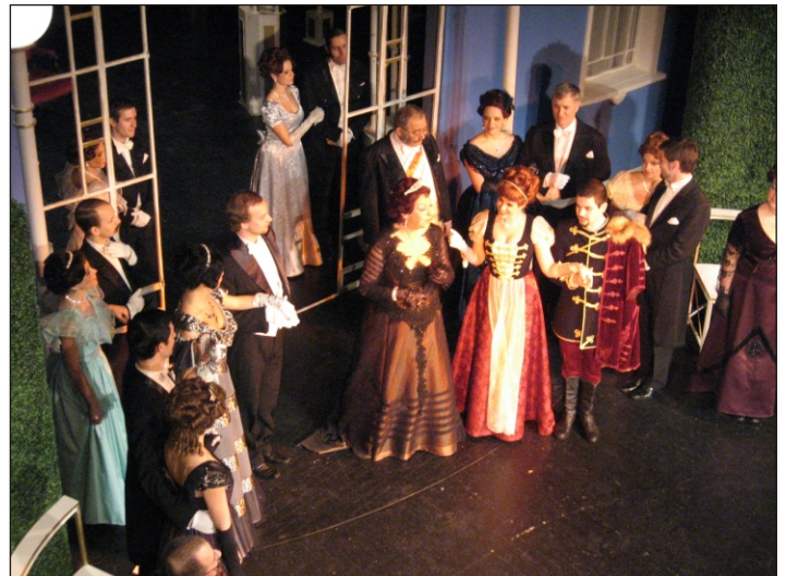
A Csárdáskirálynő előadásán