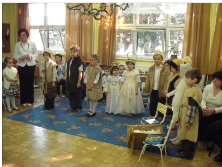
A katicások mesejelenete