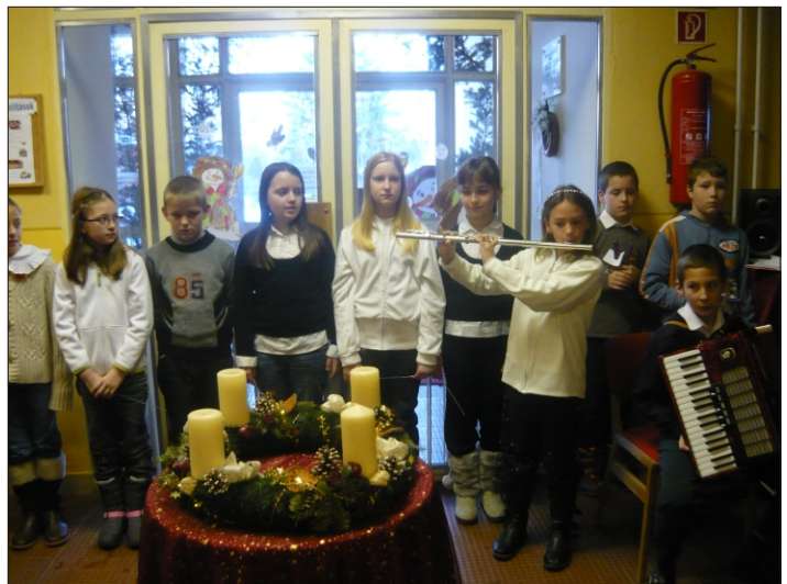
A negyedik gyertya, a remény