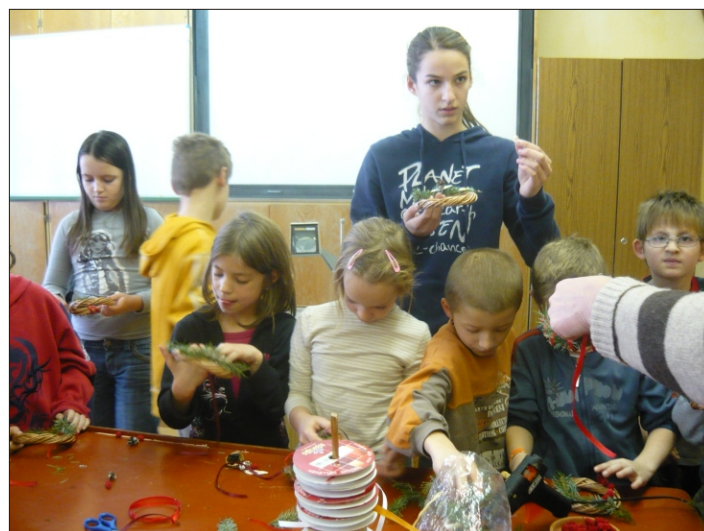
Civil pályázat - kézműves foglalkozás