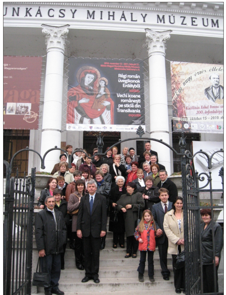
A Munkácsy Múzeum előtt