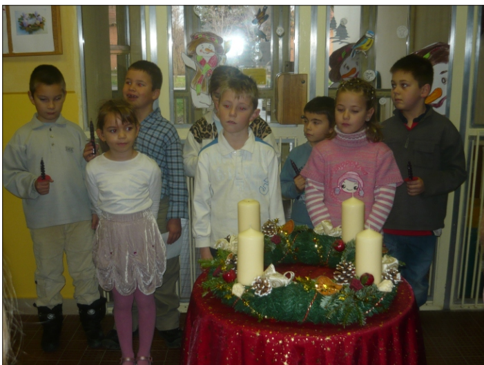
A hit fényére várva