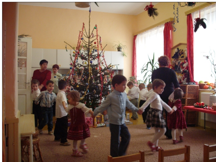
A műsor a vendégeknek szól