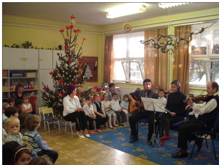
A vendégek műsora a nagyoviban