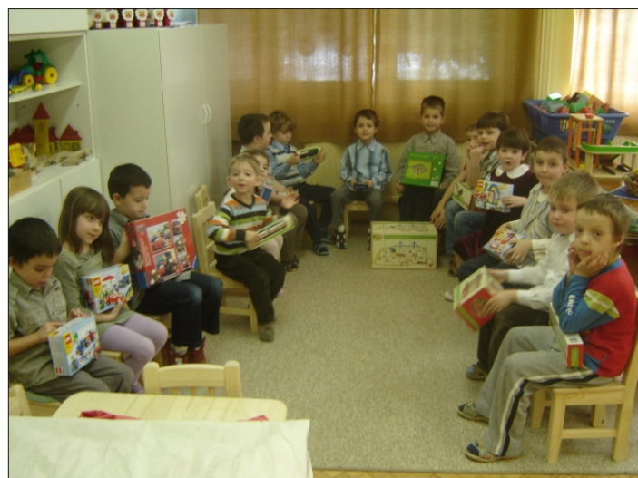
Ez a legizgalmasabb