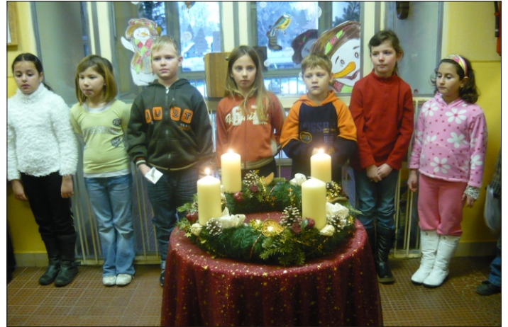
A szeretet lángja is lobog

Következzék néhány kép iskolánk karácsonyi albumából.