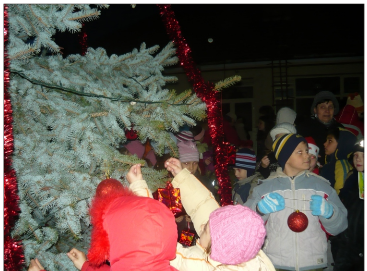
Öltöztetik az iskola fenyőfáját