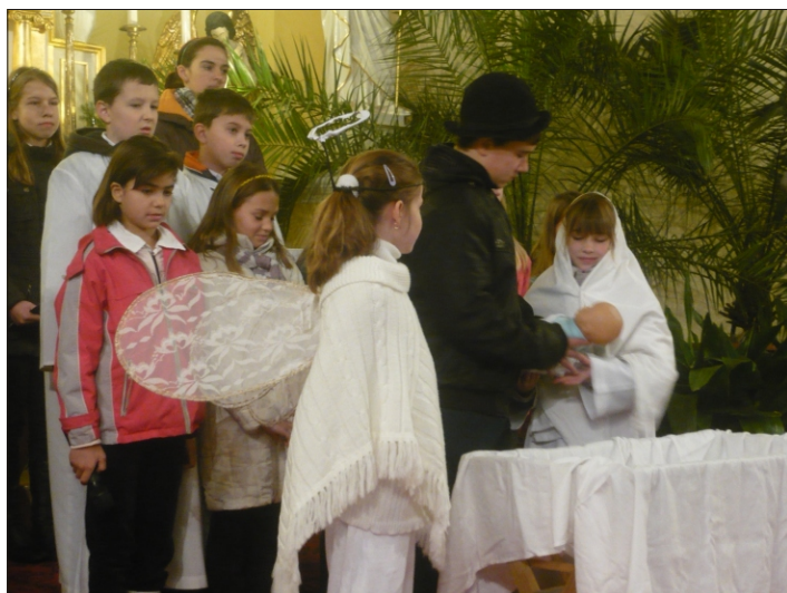
Jézus születése napján...