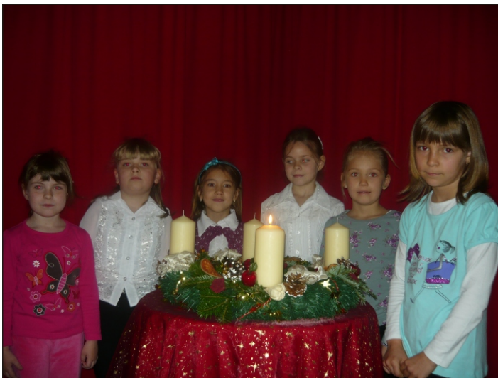
Az első gyertya, a béke lángja