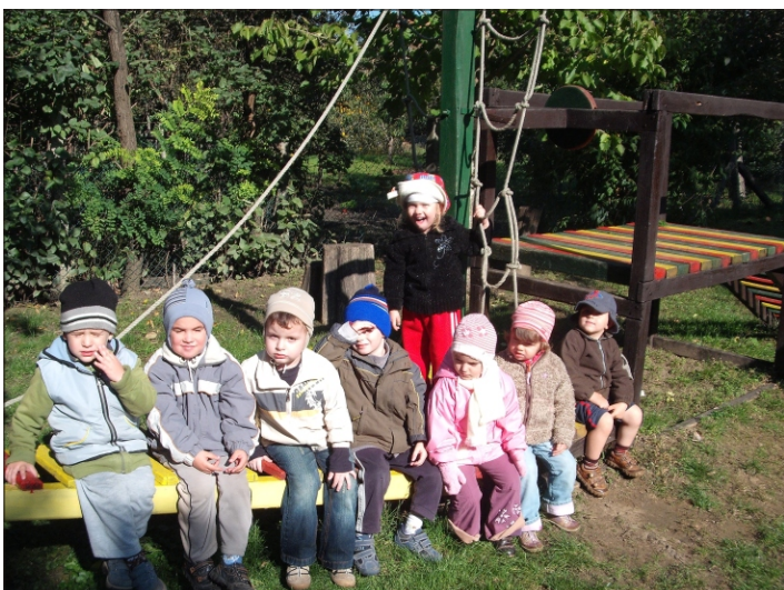
Az új gyermekek hamar megszokták az óvodát