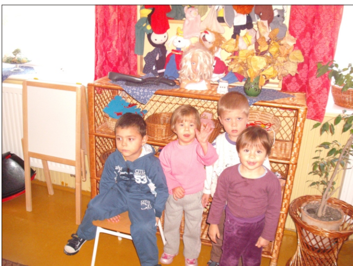
A kisoviban négy picit örül a sok játéknak