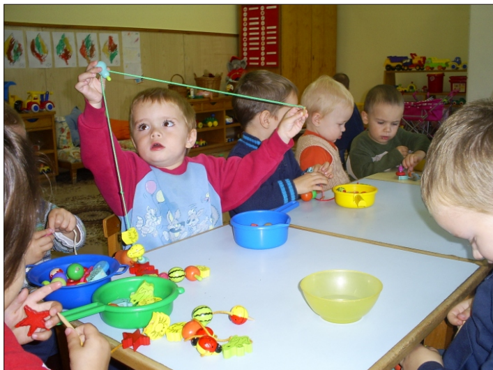
Nézd milyen hosszú gyöngysort fűzök!