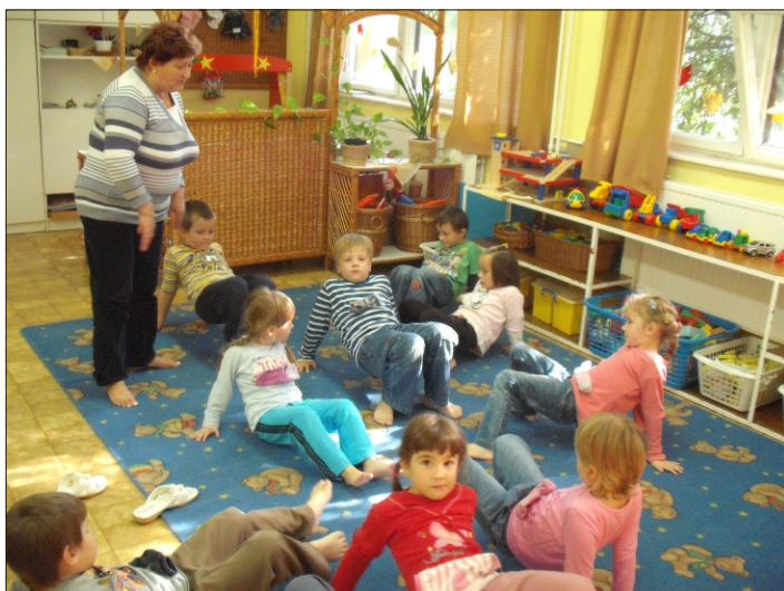
Megkezdődött a gyógyítás a mozgásfejlesztő órán