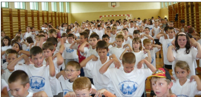
Diákok a Diáknapján