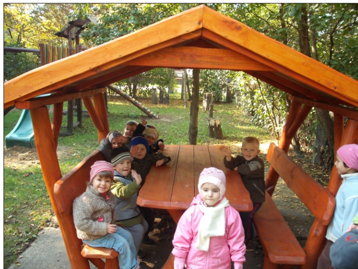
A kicsik birtokba vették az új házikót