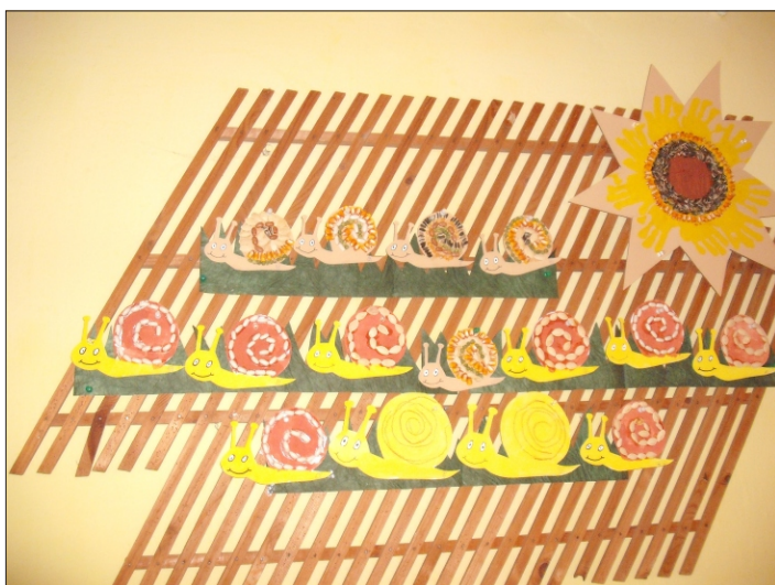
A körtések az őszi termésekből készítettek a csigának házat