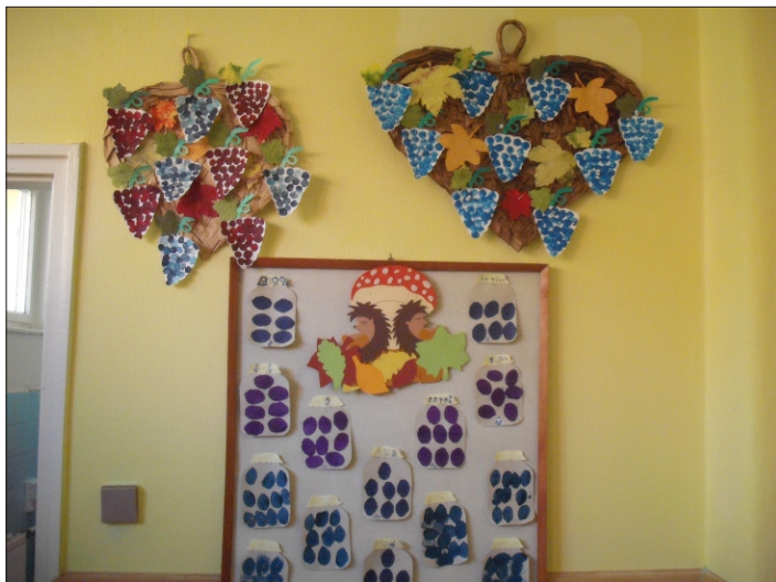
A Katica csoportban üvegbe került az őszi szilva