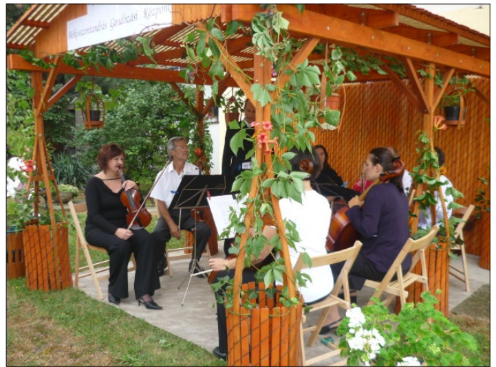
A nyárvégi szerenád résztvevői

Hétfőn és szerdán betegszállítást vállalunk Szarvasra a szakrendelésekre, laborba, röntgenbe. A hét többi napján a külterületen élőket látjuk el, és szállítjuk a gyermekeket különböző sport és tanulmányi rendezvényekre, valamint a civil szervezetek tagjait is kiszolgáljuk. A mozgásban korlátozott időseket a sósobába is szívesen behozzuk.