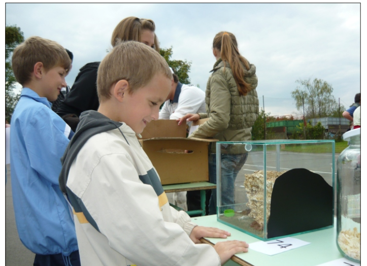
Igazi különlegesség volt a madárpók