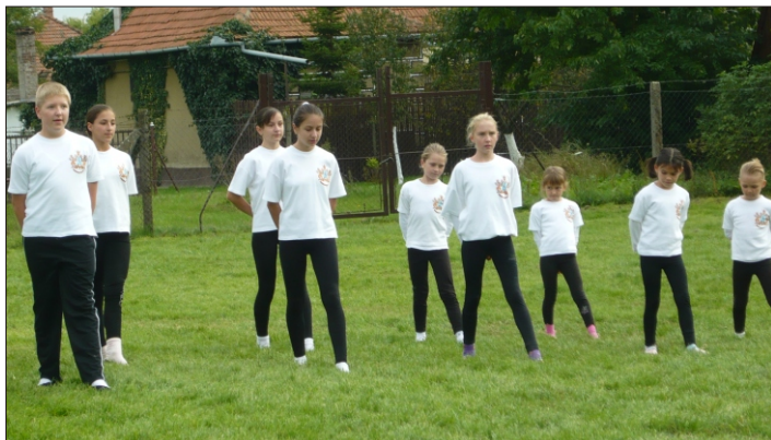
A Békésszentandrás Lovastorna csapat