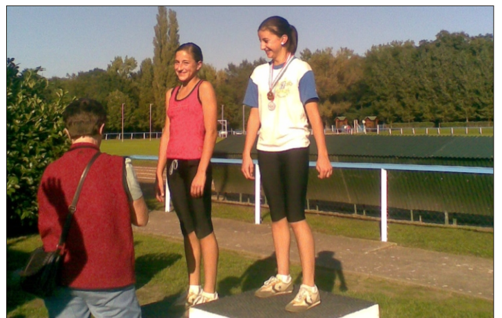
Az atlétika verseny 1. és 2. helyezettje