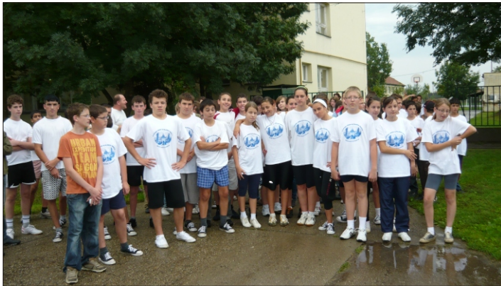
A 2010 méteres futás rajtja előtt