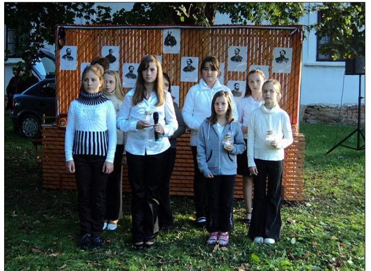
Ünnepi megemlékezés az aradi vértanúkról