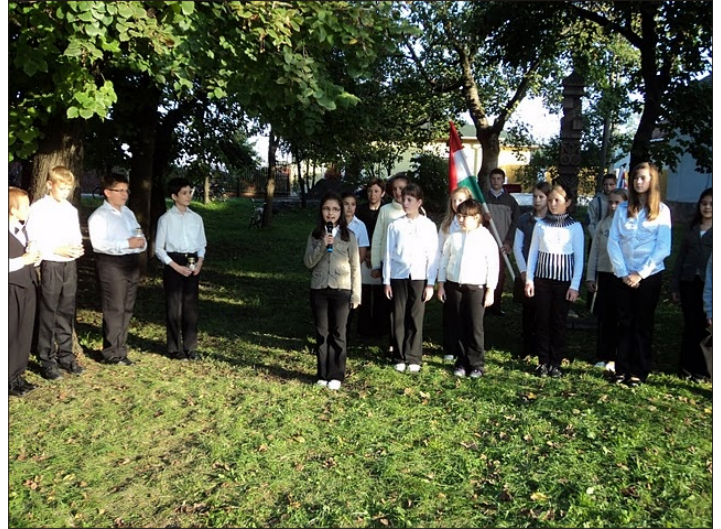
A Hunyadi János Általános Iskola 5. osztálya