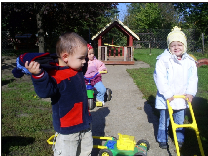
Nekem már melegem van!