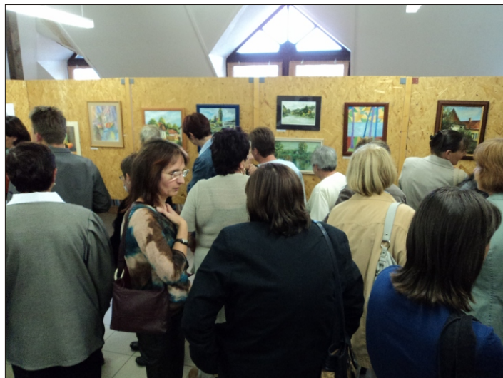
Az alkotók és alkotások