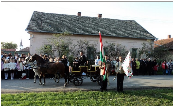
Érkeznek a zászlók...