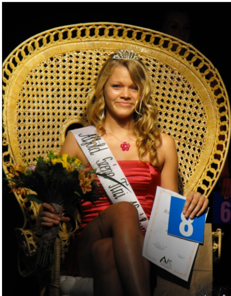
A tini királynő

Kecskeméten, 2010. július 16-án rendezték meg az Alföld Szépe Tini szépségversenyt, ahol volt alkalmam képviselni lakóhelyemet.