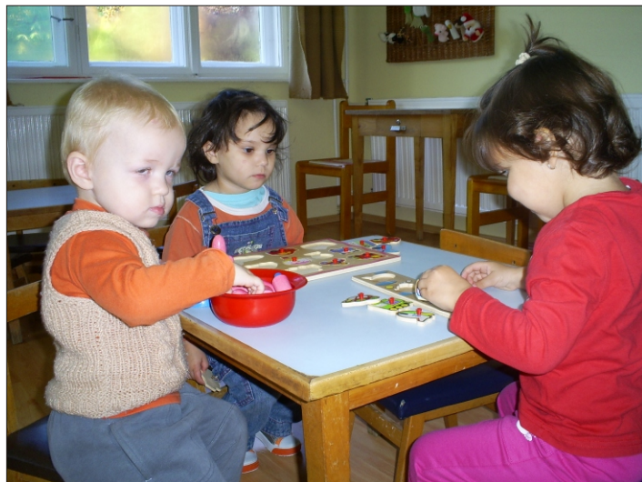
Amíg melegszik az idő, kirakózunk