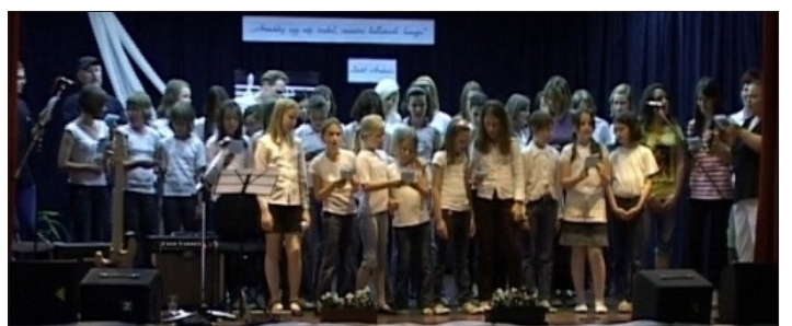
Zárszó - közös éneklés