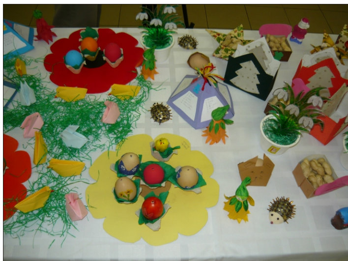
Részlet a kiállításból