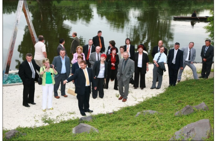
A Millenniumi András-keresztnél

A továbbiakban a kommunizmus áldozatainak emlékére állított kopjafához vonultak, majd a közös emlékhelyhez, a Millenniumi András-kereszthez. Itt mindenki megkereste a települését jelképező követ, majd közös fotó készült.