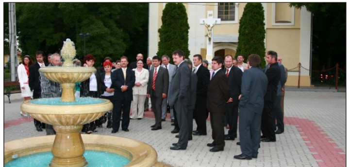
A Szent István Díszkútnál

A séta utolsó állomása a Szent András Templom előtti Díszter volt, ahol megcsodálták a Szent István Díszkutat, és elismerően szóltak a tér kialakításával kapcsolatban. A találkozó első napját egy baráti vacsora zárta, ahol a régi emlékek és a közös programok felelevenítése biztosította a jó hangulatot.