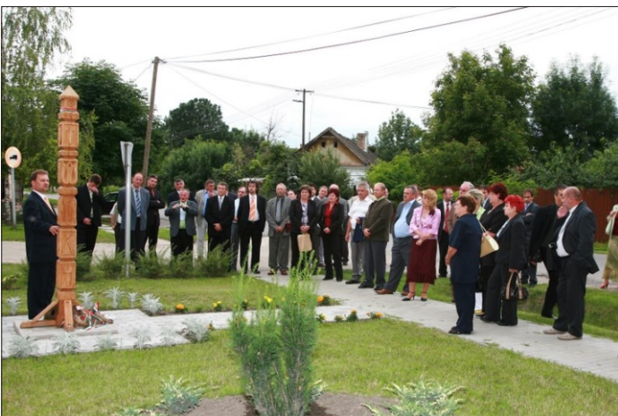
A kommunizmus áldozatainak emlékére állított kopjafánál

A továbbiakban a kommunizmus áldozatainak emlékére állított kopjafához vonultak, majd a közös emlékhelyhez, a Millenniumi András-kereszthez. Itt mindenki megkereste a települését jelképező követ, majd közös fotó készült.