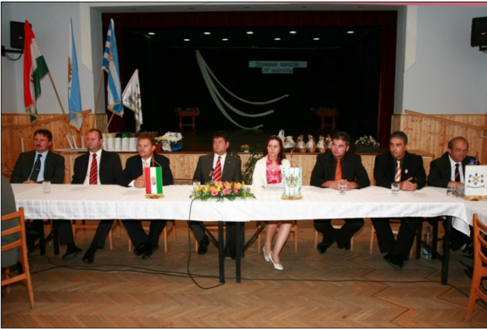
Együttes testületi ülésen: Békésszentandrás testülete

testületi ülés volt, melyen beszámoltak a települések az elmúlt esztendő eseményeiről, történéseiről. Rendhagyó módon a sort nem a házigazda kezdte, hanem Hernád- és Tornaszentandrás, ahol az idei esztendőben az árvíz súlyos károkat okozott, melyről részletes beszámolót hallhattunk. A tájékoztatás végén megható pillanat volt, amikor Rábaszentandrás egy jótékonyági sportnap bevételét ajánlotta fel, illetve Békésszentandrás pénzbeli adományt és hernádszentandrás gyermekek üdültetését vállalta.