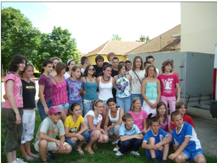
Együtt a Hegyeseikkel

De térjünk vissza a gyerekekhez. Ők azért nem ragaszkodtak annyira az iskola épületéhez, szívesebben mentek valamennyien haza, a fogadócsaládokhoz. Akik évek óta tartják a kapcsolatot testvéreinkkel, azok számára már ismerős ez az érzés, akik viszont először lehettek két napra ezeknek a gyerekeknek a „szülei”, azok most megtudták, hogy milyen is kishegyesei gyermekeket „fogadni”. A délutáni beszélgetés, vagy séta után az esti program ismét az úgynevezett Garázs-disco volt, melyet ezúton is köszönünk Rába Istvánnak. Hogy ezután éjszaka ki meddig beszélgetett a családokkal, azt nem tudjuk, leginkább csak sejtjük. De ez így van jól, hiszen kölcsönösen szeretné megismerni egymást mindenki. Szombat délelőtt és kora délután lehetőségük volt idén is részt venni a lovasnapok rendezvényein. Két évvel ezelőtt nagy tetszést aratott, ezért kérték, hogy idén is erre a hétvégére essen az utazás.