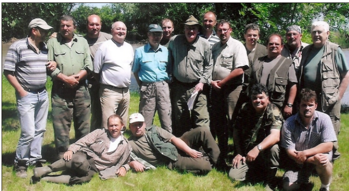
Verseny utáni csoportkép a résztvevőkről

Az eredményhirdetésre már a lőtér melletti hűvös vadászházban került sor, majd ezt követte a nagyon finomra sikerült birkapörkölt elfogyasztása. Ezt követően még lehetőség volt a lőtérrel a gyakorlásra, s a vadásztagoknak a kötetlen baráti beszélgetésekre.