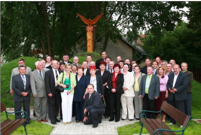
Csoportkép a Nemzeti Összetartozás Emlékparkban

A testületi ülést követően a jelenlévők sétát tettek Békésszentandrásra. Először a Nemzeti Összetartozás Emlékparkot tekintették meg, ahol a küldöttségek polgármesterei az otthonról hozott földet rászórták a halmokra, kérésünkre ezzel is kifejezve az összetartozás erejét, fontosságát.