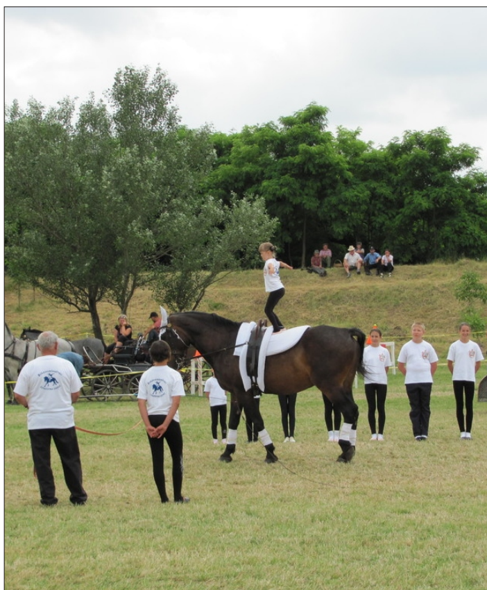
Bemutakozott a szentandrás csoport