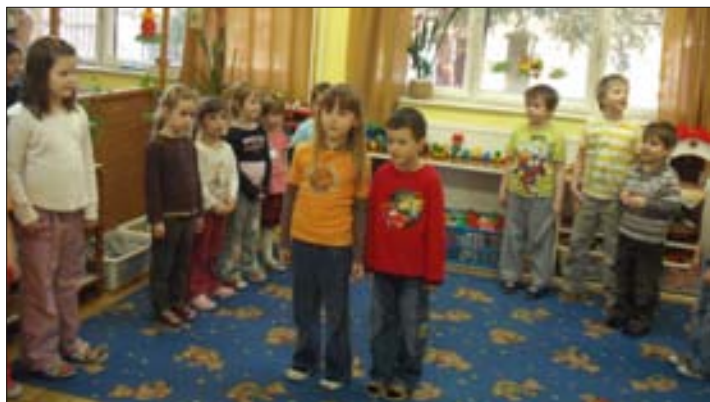
A Katica csoport húsvéti műsora