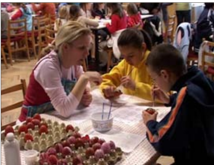
Nem maradhatott el a tojásfestés