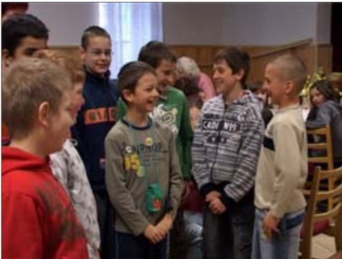
A fiúk közösen mondták el a locsolóverset a lányoknak