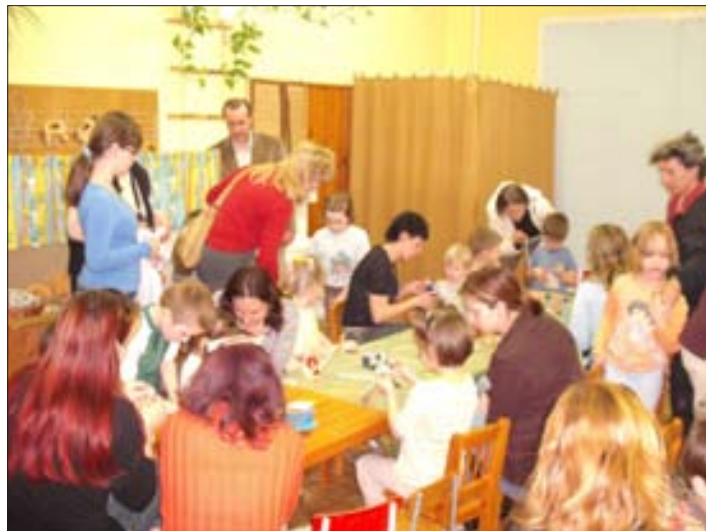
Készülnek a szebbnél-szebb kosarak