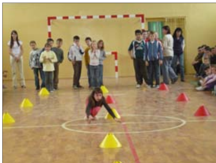
Húsvéti nyusziváltó az alsósoknak -

A tavaszi szünet előtti tanítási napok nem tartoznak a legkönnyebbek közé. Na, nem azért, mert ilyenkor az átlagnál nehezebb tananyagot kellene elsajátítani, hanem azért, mert a hosszú tél után mindenki várja a jó időt, a tavaszt, a szünetet és a Húsvétot.