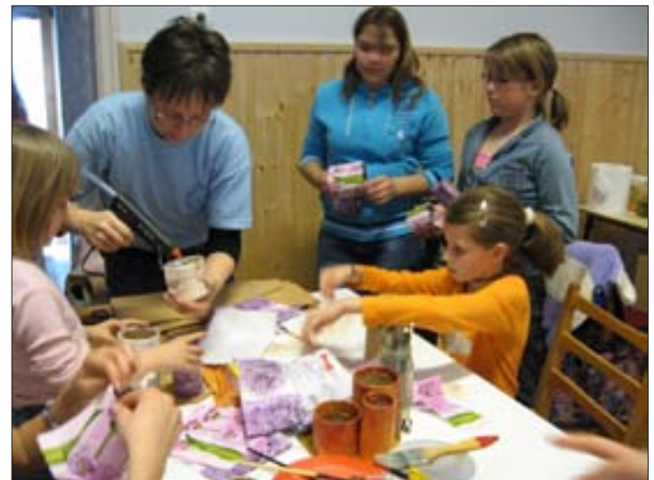
Tavaszi mintás asztali ceruzatartót is lehetett készíteni