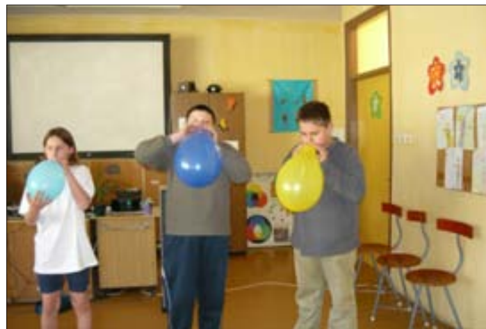
- vidám vetélkedő a felsősöknek