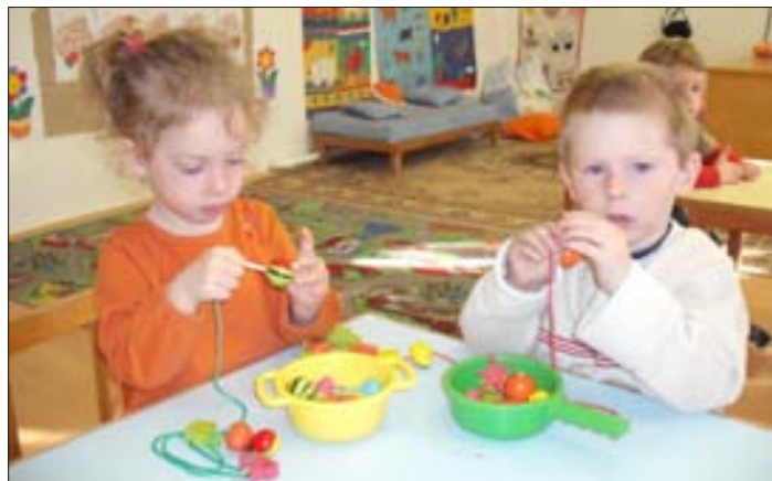
A gyöngyfüzést is kedveljük