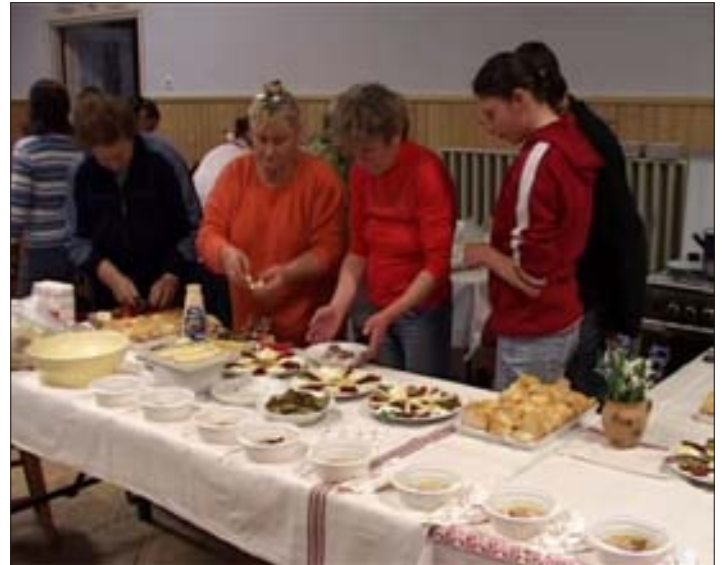
A Kertbarát kör tagjai sok finomsággal várták az érdeklődőket