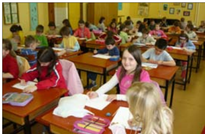
A rajzverseny résztvevői