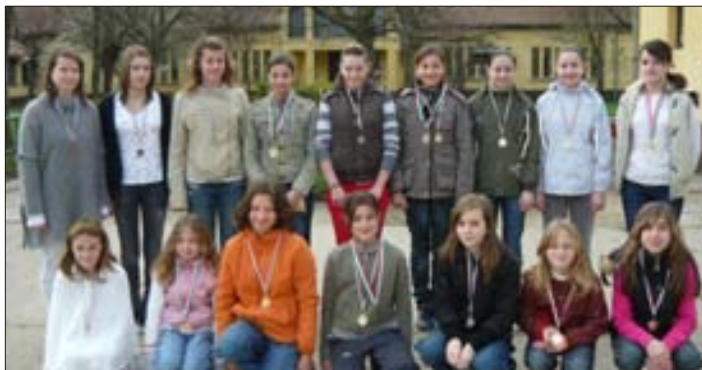
A Diákolimpia érmesei