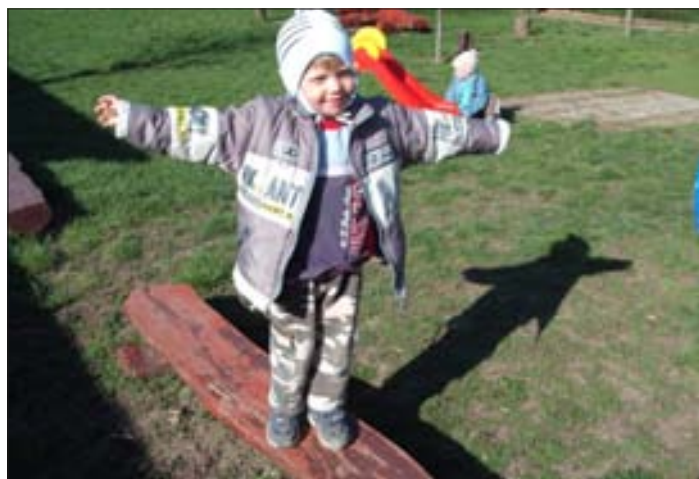
Nézd milyen jól egyensúlyozom!