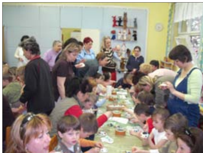
A gipszfestés is népszerű volt