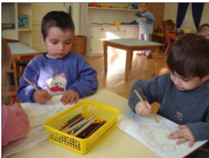
A rajzolás kedvelt tevékenységünk

A békésszentandrási bölcsőde 1953. május 1-jén nyitotta meg kapuit. Az Önkormányzat lehetőségéhez képest mindent megtesz, hogy a bölcsőde üzemeljen, a munkát vállaló szülők és a nehéz körülmények között élő családok gyermekei napközbeni ellátásához nyugodt kiegyensúlyozott és esztétikus légkört biztosítson. E cél elérése érdekében tevékenykednek a bölcsőde dolgozói, munkájukhoz segítséget nyújtanak a szülők és a védőnők.