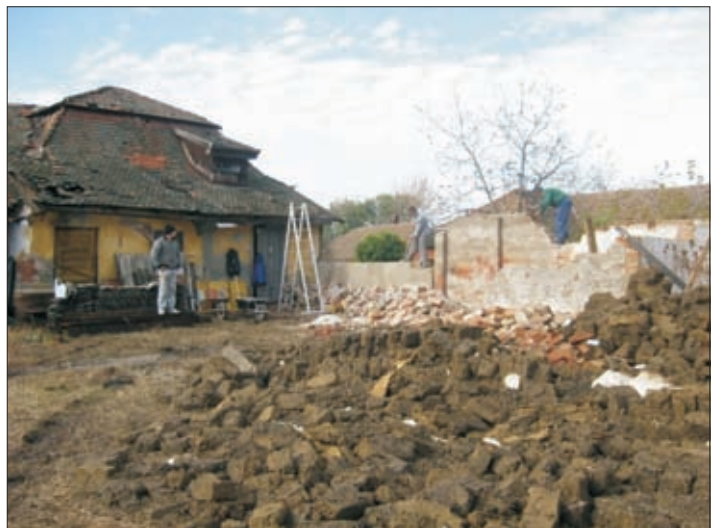
Megkezdődött a 100 évesnél is idősebb „vasbolt” bontása