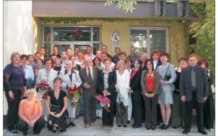
Együtt a három évfolyam

1989. június 10-én három osztály ballagott el a békésszentendrasi Általános Iskolából, valószínűleg azóta sem volt olyan népes évfolyam az iskolában, mint amilyen a miénk volt. Már év elején megfogalmazódott néhányunkban a gondolat, mi lenne, ha a három osztály együtt emlékezne az együtt töltött évekre ballagásunk 20. évfordulója alkalmából, és megpróbálnánk egy nagy, közös találkozót szervezni. A gondolatot csak lassan követte a megvalósítás, de végül 2009. október 3-án, egy verőfényes őszi délutánon a Hunyadi János Általános Iskola előtt találkozhattunk újra régen látott osztálytársainkkal, évfolyamtársainkkal. Sokan a mai napig itt éljük életünket, de számos társunkat messzire sodorta a sors, vannak, akik külföldön keresik boldogulásukat. Nagyon örülünk, hogy sokan hazajöttek ez alkalomból, és olyan arcokkal is találkozhattunk, akikkel nem tudunk összefutni mindennap az utcán, a boltban, akár csak egy köszönés erejéig.