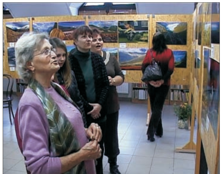
A kiállítás résztvevői