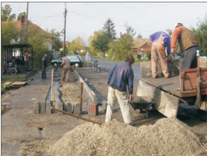
Újjáépül a Posta melletti „kisbuszmegálló”

A házi komposztálás minden bizonnyal a leghatékonyabb módja annak, hogy személyesen is tegyen valamit a környezetért: ritkábban kell majd a szemetet ürítenie (s mellelleg pont a legkellemetlenebb szagú részekről lesz mentes), nem kell többet az egészségtelen és környezetszennyező avarégetéssel foglalkoznia, gyorsabban és egészségesebben fejlődnek majd növényei.