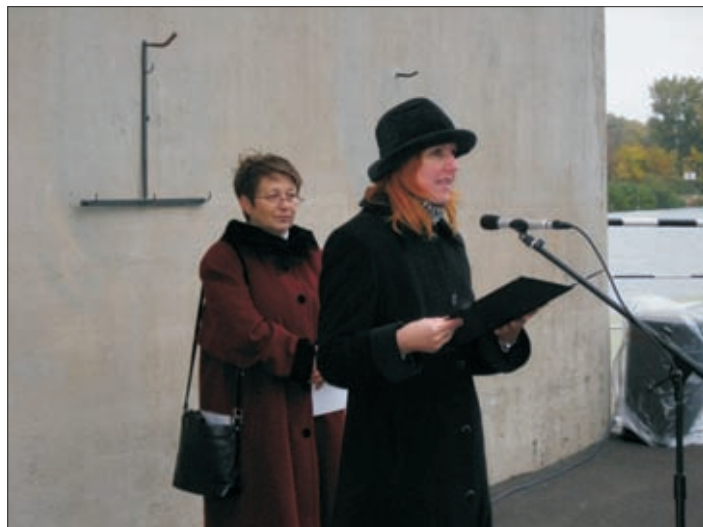
Az ünnepség közreműködői

A hosszúra nyúlt tanácskozást az alkalomhoz illő ebéd követte. Az egyesület minden kedves jelenlétet invitált a fehér asztalhoz, ahol becsinált leves és öregtarhonya volt a menü.