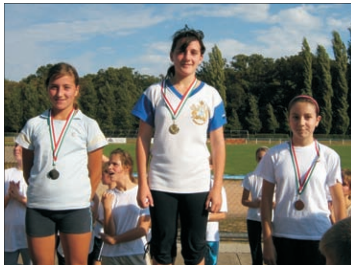
A dobogó mindhárom fokán békésszentandrási diák

A csapatversenyben a négy legjobb helyezést elért versenyző eredménye döntötte el a csapathelyezést. 62 tanulónk 36 érmet szerzett ezen a versenyen. Volt, aki egyéniben és a csapattal is dobogóra állhatott.