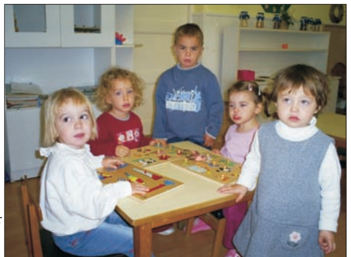
Lányok, ti ezt mind kiraktátok?