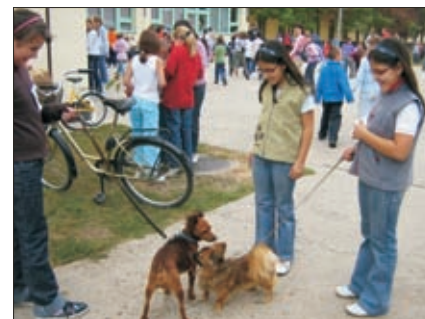
Kutyusok és gazdáik

Jövőre is várunk minden állatkedvelőt, tulajdonost és érdeklődőt az állatok világnapi programjainkra!