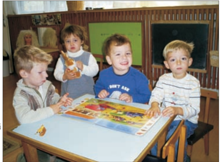
Nézd, milyen érdekes könyvet „olvasunk”!