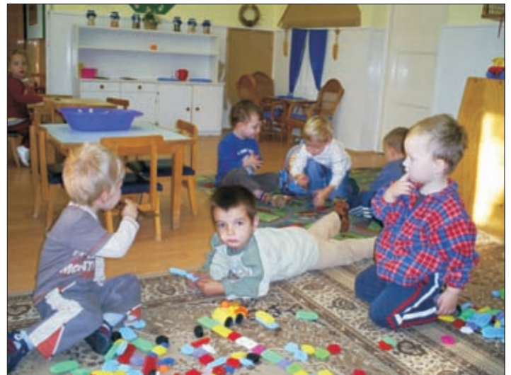
Gyertek, építettünk utat az autóknak!