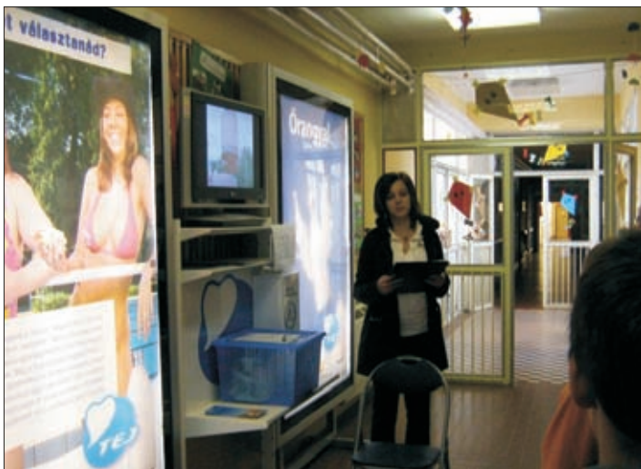
A Tejterméktanács előadása

Hogy mivel? Az iskola „aulájában” két display várta a gyerekeket, melyen folyamatosan tájékoztatásokat, érdekességeket tolmácsolnak a tej- és tejtermékekről - az összetevőktől egészen az ultra magas hőmérsékleten történő kezelésig - és a legújabb hungarikumról, a Túró-Rudiról. A kicsiket számítógépes játék segítségével cserkésztték be, és szinte észre sem vették, hogy amíg a játék végére értek mennyi információval lettek gazdagabbak. És persze a legnépszerűbb „reklám” maga a tej volt. A szünetekben a gyerekek kezében ott volt a dobozos tej, és valamennyien jóízűen itták.