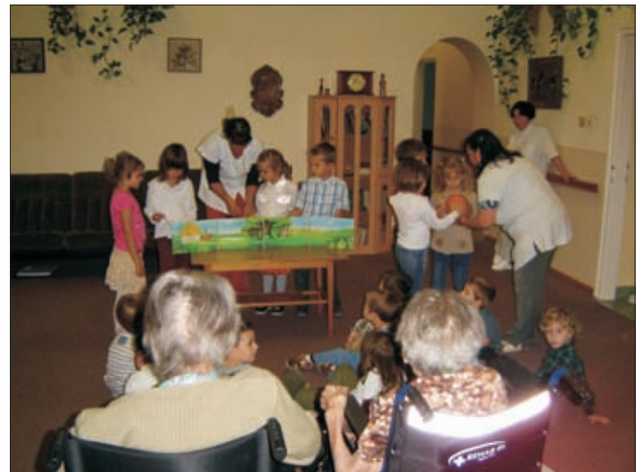
Bábjáték a Gondozási Központban

Fűszerpaprika feldolgozása házilag: helyszíni foglalkozás keretében tapasztalhatták meg a gyermekek, hogyan lesz a piros csöves fűszerpaprikából paprika őrlemény. Megnéztük, hogyan történik a paprikacsövek felfűzése, szikkasztása, hasítása, majd őrlése. A paprika őrleményt ismerik a gyermekek, hisz minden háztartásban használják, a magyar konyha kedvelt főszere.