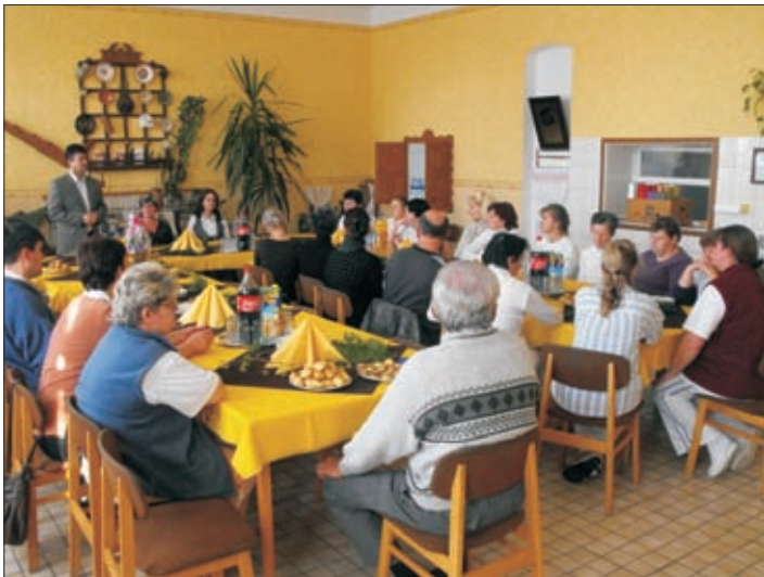
Az ünnepségen Hamza Zoltán polgármester úr köszöntötte a szociális területen tevékenykedő dolgozókat

Ezen a napon a Gondozási Központ ebédlőjében rendeztünk egy családi hangulatú ünnepséget, ahová az intézmény dolgozóin kívül meghívást kaptak még a községben szociális területen tevékenykedő dolgozók, és a civil szervezetek képviselői. Hamza Zoltán polgármester úr méltatta a szociális szakemberek nem könnyű munkáját, ahol az empátiára, a türelemre nagyon nagy szükség van. A mai rohanó világunkban, amikor a családok megélhetése napi gondot jelent, e területen dolgozóknak megértést, odaadást kell tanúsítani az ügyfelekkel, gyerekekkel, betegekkel, idősekkel szemben, hiszen a családi problémákat nem vihetjük be a munkahelyre. Polgármester úr a Képviselő-testület támogatásáról biztosította a jelenlévőket, tisztelettel köszönte meg munkánkat, majd csokoládét és a férfiaknak egy-egy üveg italt adott át dr. Gyöngyi Gabriella közreműködésével. Az ünnepség további részében süteményt és üdítő italokat fogyasztottunk egy kellemes beszélgetés közben. Köszönjük a megemlékezést!