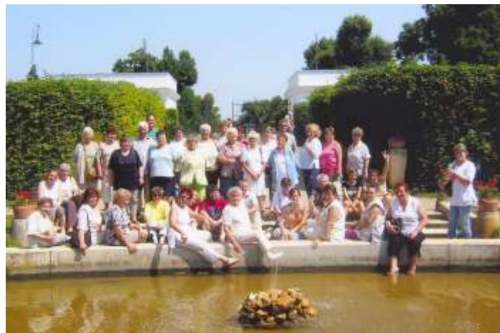
Búcsúzó csoportkép, Nagycenk