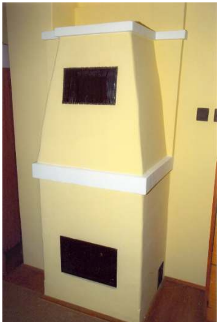
Elkészült a kemence

megteremtették azt, hogy a télen ne a hideg irodában fogadjuk tagjainkat ügyfélfogadási napokon. A május 13-i jótékonyági bál bevétele biztosította az anyagköltséget és a támogató jegyekb l befolyt összeg. Pályázaton is nyertünk az egyesület m ködtetésére és a személyi jövedelemadó 1 %-t is átutalták. Így az összeget átcsoportosítva tudtuk biztosítani a többlet kiadásokat. Természetesen párhuzamosan haladtak a szociális, pénzügyi és gazdasági munkák is, ami még fontos feladat az egyesület számára.