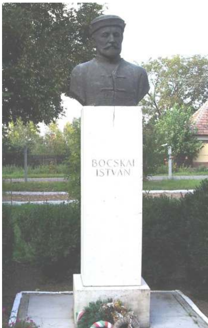
Bocskai István szobra

Nagykerekai f utcáján megszemlélhetjük a vidék jellegzetes népi építészetének szép emlékeit, a k lábas görékat. A barokk