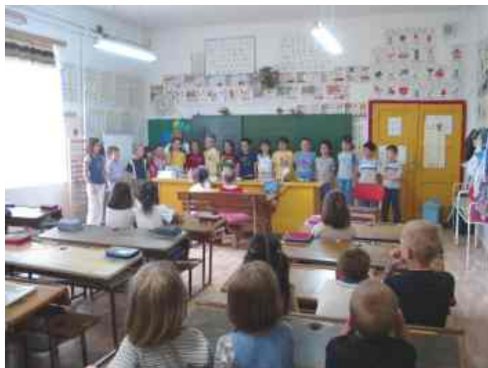
Ismerkedés az Iskolával