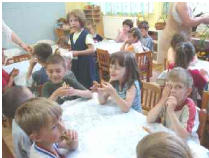
...Vajon ki lesz az idei palacsintás király?