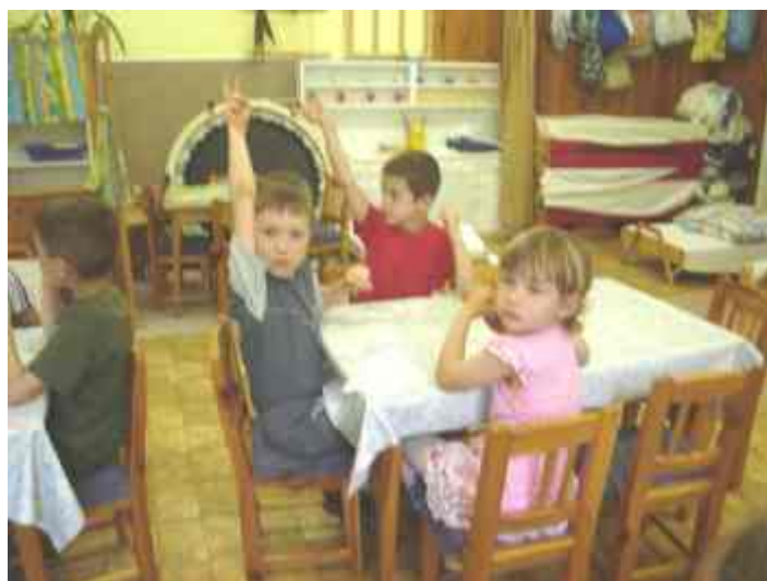
...Vajon ki lesz az idei palacsintás király?