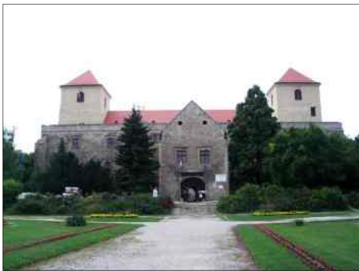
A Thury vár

Az Újlaky család kezdte építeni a XIV. században. Az utókor azonban Thury György I, a híres törökverő I nevezte el a várat. Az öles falak sokat tudnának mesélni azokról az időről, amikor 30 év alatt 26 török ostromot kellett elviselni a védőknek. Íme egy „vérfagyasztó” történet a forró nyári napokra! 1593-ban végre elfoglalta a várat Szinán pasa. Egyik agája a fegyverteremben meglátta Újlaky képét és gyzelemesen átszúrta a kardjával. Ez egy csütörtöki napon történt. Reggelre holtan találták az ágyában, nyakán két ujj és hegyes fogak nyomával. Rá egy hétre, újabb áldozatra bukkantak, aki hasonló módon múlt ki, mint az agá. Aztán még néhány halálos péntek következett és a páni félelembe esett ország mindent hátrahagyva kitarokodott a várból.