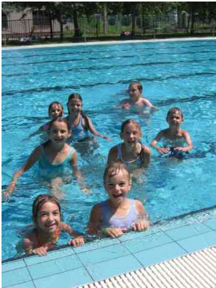
Cserkesz I ben