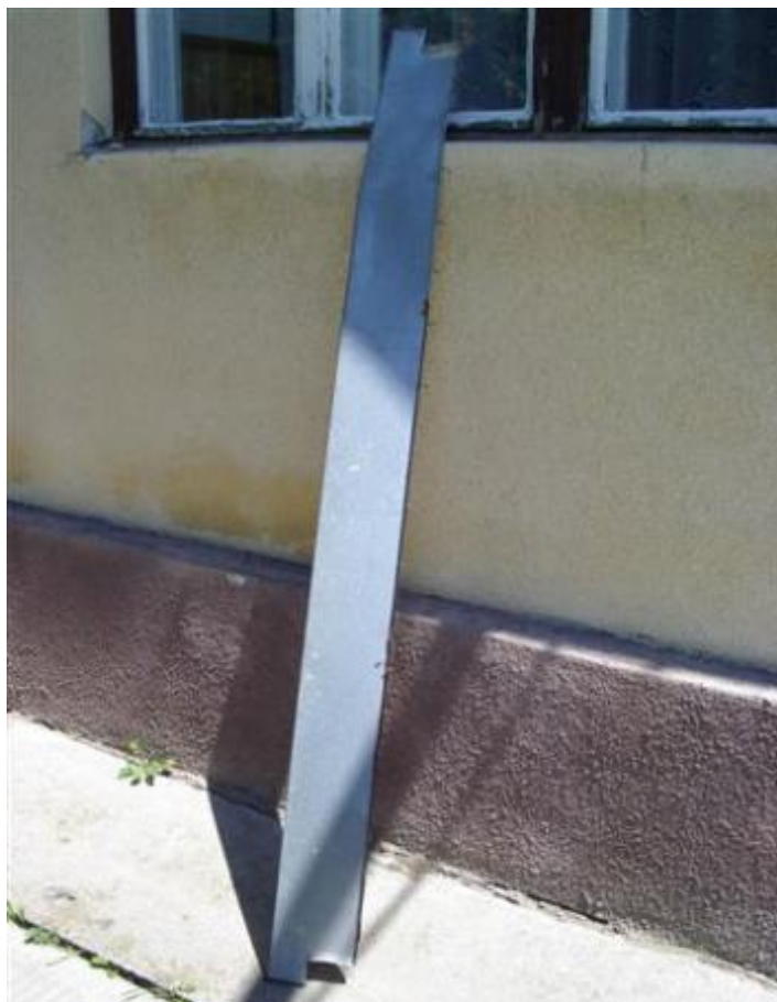
Nyugdíjas Klub ablakpárkányai