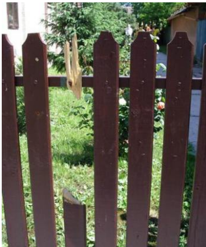
Művelődési Ház kerítése