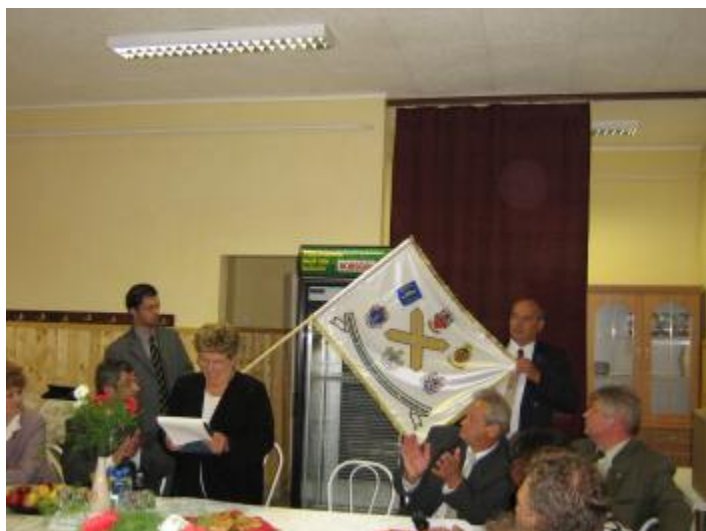
Szentandrások közös zászlója

eredményeiről az eltelt egy évről. Minden településnek más a gondja, problémája, ami tükrözi az országos gondokat is, de mindenhol fejlesztésekről is beszámoltak.