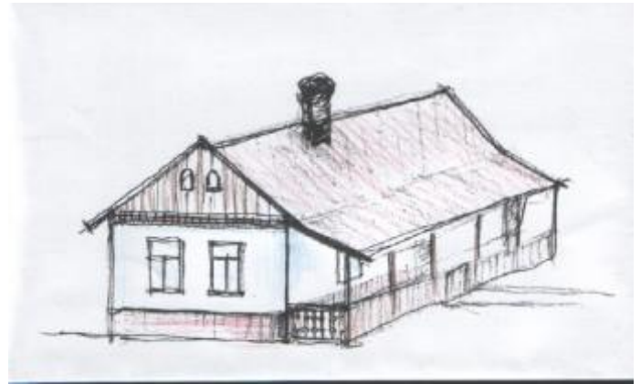
Rajz: Kozák János

A Helytörténeti Egyesület nevében: Hévízi Róbert