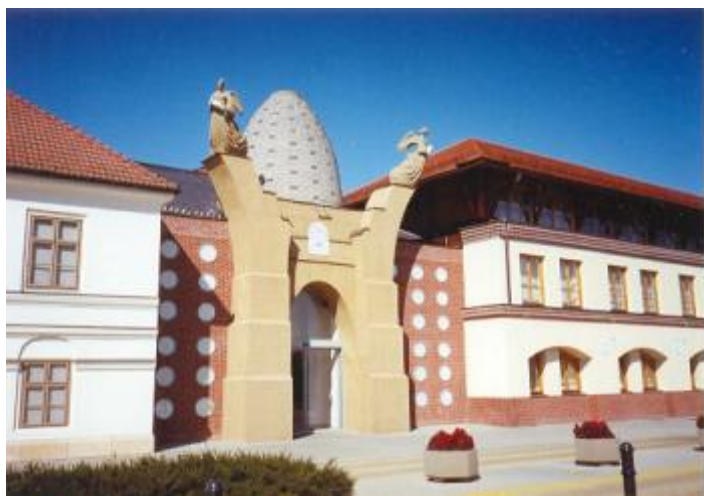
A régi és az új szárny

A település a porcelángyáráról vált ismertté. Napjainkban Porceláneum gyűjtőnévvel illetik a régi és az új gyárat, a múzeumot, a mintaboltot valamint az Apicus vendéglátó egységet, ahol természetesen herendi készlet van az asztalon.