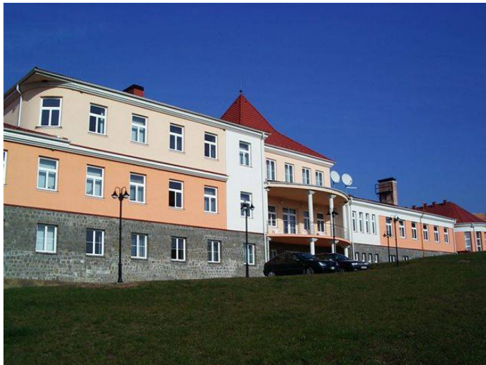
A Mofetta Gyógyászati Központ

A település nagy része megőrizte a palóc építéssel jellegzetes formáit. Érdeemes felkeresni a Népművészeti Házat, ahol szebbnél szebb kézműves termékekben gyönyörködhetünk és természetesen vásárolhatunk is. Az egyik teremben az itt dolgozók szívesen megmutatják a szövés minden csínját-bínját. Az udvarról nyíló helytörténeti kiállítás legszebb része a palóc szoba. Messze földön híres a népviseletük. Képzeljünk el egy bordó rakott szoknyát, fehér buggyos ujjú blúzzal, színes selyemrojtos vállkendővel, fehér harisnya, fekete cipővel és a fejdísz, amely aranycipkével borított magas konty, hosszan lenyúló, széles hímzett szalagokkal. Szinte fejedelmi pompa, igazi női méltóságot sugárzó ünnepélyes viselet!