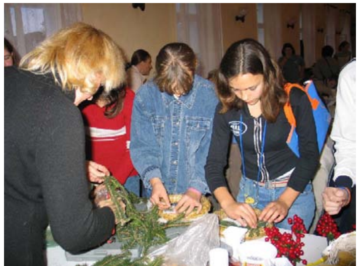
Készül az adventi koszorú