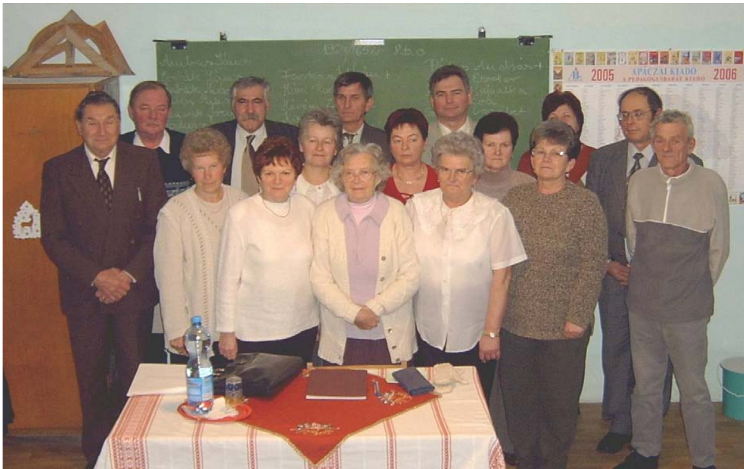
Osztálytalálkozó (40 éves) 2005-ben 13 fő