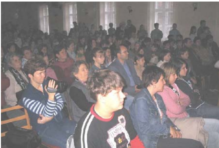
A közönség egyik alkalommal