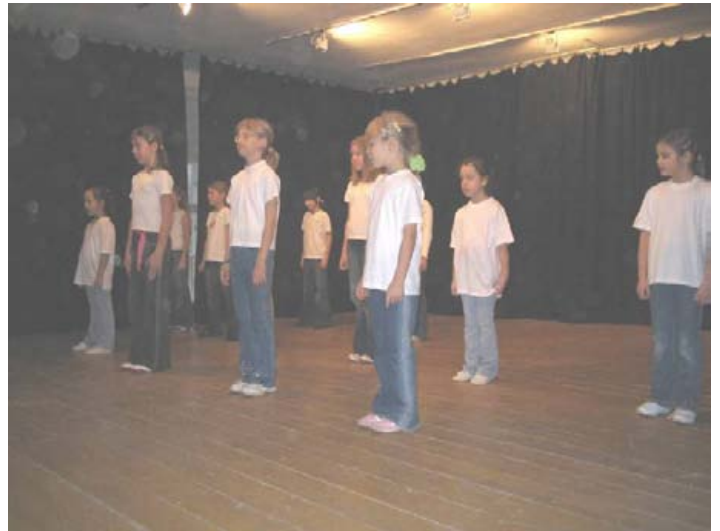
Energy Dance Cool modern tánciskola kezdő csoportja

Békésszentandrás Kéz- és Műipari Egyesülete