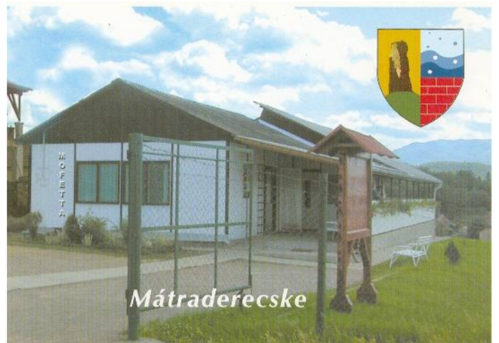
A Mofetta régi épülete