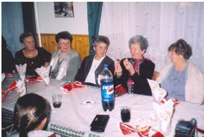
Mi van benne?