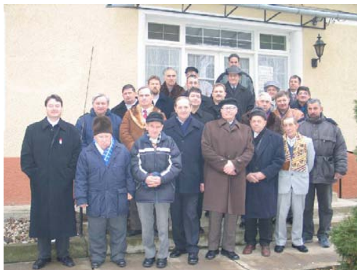
A 2005. évi karácsony másnapján, az élő és meghalt iparosokért bemutatott szentmisén résztvevő iparosok.