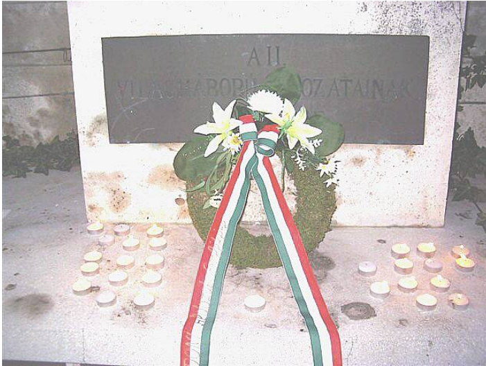
Az emlékezés fényei