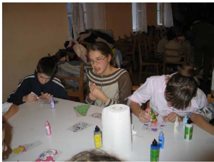
Készül az üvegmatrica