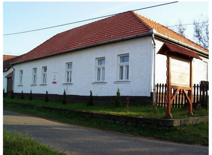
A Népművészeti Ház