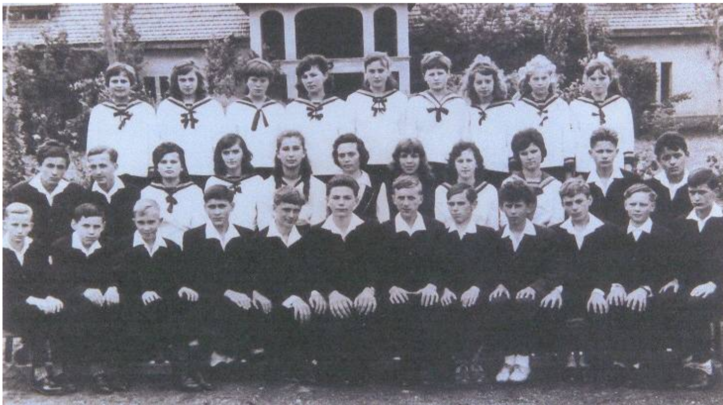
1965-ben végzett 8.b osztály névsora 31 fő: