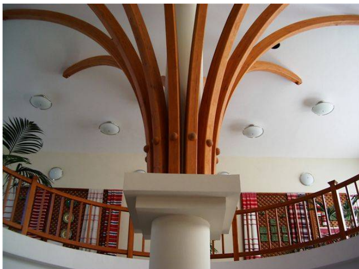
A gyógyszálló hallja