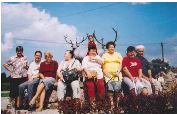
Pálháza: a Kisvasútra várva

A Kékedi Melcer kastély és Hollóháza után várt bennünket Pálháza a kisvasút, hogy gyönyörködjünk az erdő szépségében, kastélyban, halastóban. A kisvasútra várva (ahova be voltunk jelentkezve) készült ez a mókás kép a kirándulókról. (lásd 3. fotó) Mikor Sátoraljaújhelyre érkeztünk este felé, akkor megnéztük a Régi zsidó temetőt, a „csodarabbi” emlékhelyet, majd a Panzióba mentünk, vacsoráztunk és csomagoltunk, mert reggel már hazafelé indultunk.