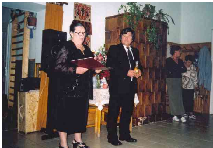
Ez a kis szobor szoros kapocs!