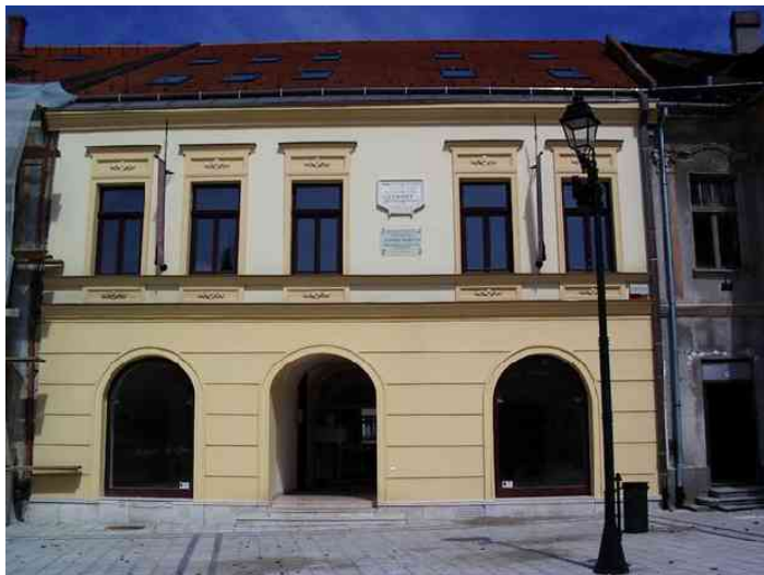
Lendvai Márton szülőháza

A tér legrégebbi háza Szilágyi Erzsébeté volt. Közélemben áll a magyar színjátszás egyik legnagyobb alakjának, Lendvai Mártonnak a szülőháza. Micsoda pillanat volt az, amikor híres zengő hangján ő, elsőként szólalt meg a régi Nemzeti Színházban!