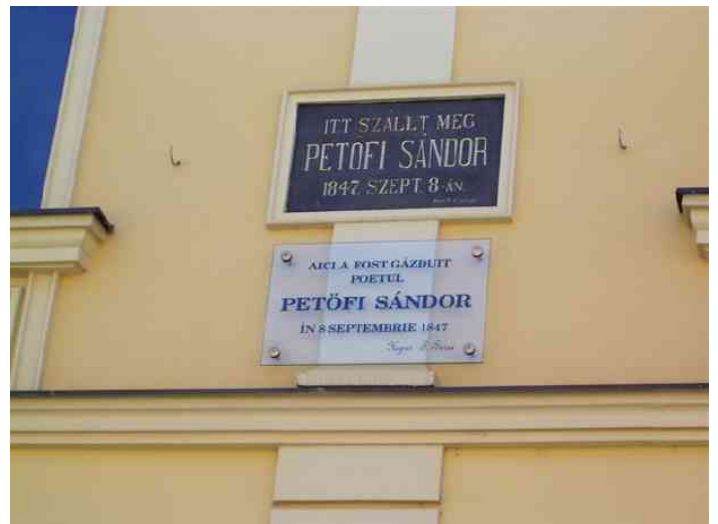
Petőfi emléktábla az Arany Sas fogadó falán