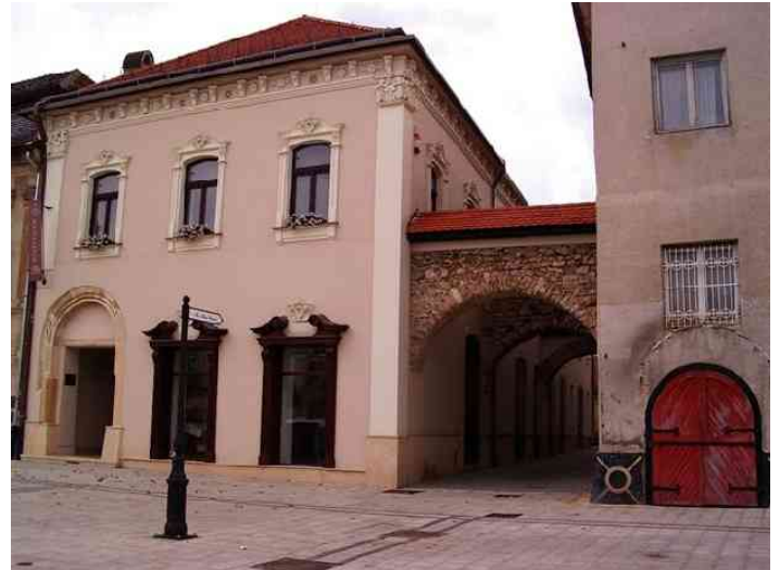
Szilágyi Erzsébet lakóháza