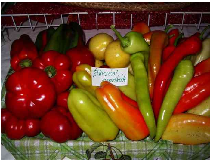
Mi szem-szájnak ingere