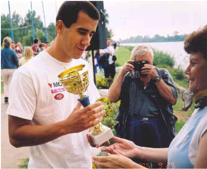
A Nagy Zoltán-díj átadása