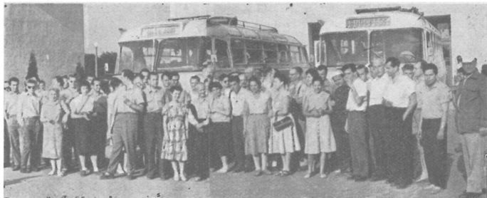
1. ábra. A Zalai Vándorgyűlés résztvevői a nagylengyeli Bartók Béla Kultúrház előtt

Duba y László: Az Észak-Zalai medence földtani fejlődéstörténete