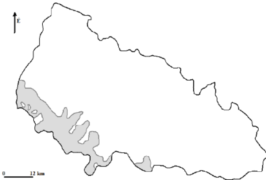
1. ábra. Magyarok Kárpátalján

március 21.–1919. április 19.), román megszállás (1919. április 10.–1920. júniusának vége), csehszlovák megszállás (1919. január 12.–1920. június 4.), a Csehszlovák Köztársaság (1920. június 4.–1938. október 7.), csehek–szlovákok–kárpatorosok föderatív köztársasága (1938. október 8.–1938. október 26.), csehek–szlovákok–kárpatukránok föderatív köztársasága (1938. október 26.–1939. március 15.), az önálló Kárpátukrán Köztársaság (1939. március 15-én néhány óráig létezett), a Magyar Királyság (1939. március 15.–1944. március 21.), a németek által megszállt Magyarország és a nyilasok (1944. március 21.–1944. október 23.), a Csehszlovák Köztársaság (1944. október 24.–1944. november 25.) és Kárpátontúli Ukrajna (1944. november 26.–1945. június 29.). 1946. január 22-ével létrejött a Kárpátontúli Terület a Szovjetunióhoz tartozó Ukrajna kötelékében. 1991-ben Ukrajna függetlenné vált. (Gabóda 2004: 71–99).