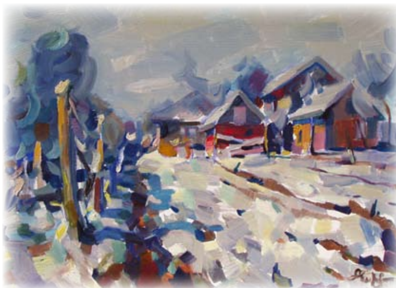
Egy téli kert