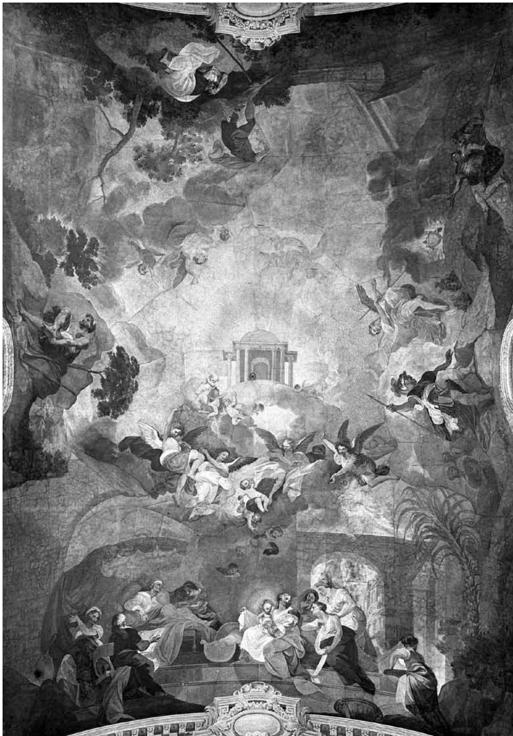
15. kép. Anton Spreng: Mária születése , 1807. Szombathely, székesegyház, a hosszház elpusztult mennyezetképe. Archív fénykép, KÖH Fotótár 007.520 Nd