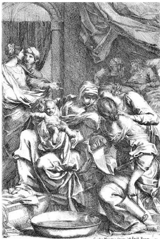
13. kép. Carlo Maratta nyomán: Mária születése . Rézkar, 1645–1660. London, British Museum, ltsz. 1874,0808.1661

csoport tekert. Mária feje fölött spirálisan terebélyesedve angyalsereg repkedett, a felhőgomolyagokon centrális templomépület állt, homlokzatának közepén boltíves kapu idézte az Úr templomának örökké zárt keleti kapuját, Mária szüzességének szimbólumát. A kupolás építményt a felkelő nap sugarai övezték, megjelenítvén az Énekek énekében leírt hajnalfényt.