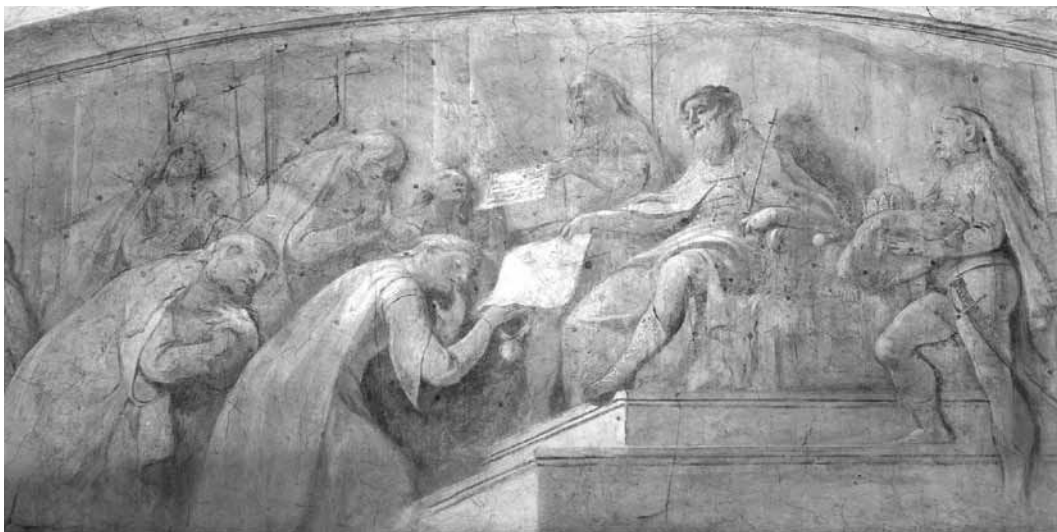
10. kép. Ifj. Josef Winterhalder: A vasvári káptalan megalapítása , 1800. Szombathely, székesegyház, Szent Mihály-kápolna, bejárati fal, részlet

(10. kép). A vasvári Szent Mihály-társaskáptalant III. Béla alapította 1172–1196 között. 1578-ban a török előrenyomulása miatt levéltárával együtt Szombathelyre költöztették, ahol a püspökség megalapításáig működött, majd az egyházmegye székeskáptalanja lett 26 A lapos lunettába foglalt, monokróm festésű kép közepén lépcsős emelvényen zsinóros mentét és palástot viselve ül trónusán a szakállas aggastyánként ábrázolt király, és pecsétes adománylevelet nyújt át a prépostnak, aki négy kanonoktársa kíséretében alázatosan meghajolva veszi át az okmányt. Balra ifjú pap mutat rá a vasvári káptalan birtokaira, a hegyes-dombos vidékre. A jobb oldali boltív alatt Szombathely korabeli látképe tűnik fel a kiépült egyházmegyei központtal.