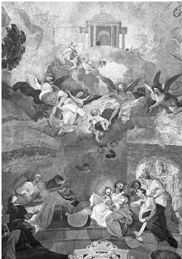
12. kép. Anton Spreng: Mária születése , 1807. Szombathely, székesegyház, a hosszház elpusztult mennyezetképe. Archív fénykép, KÖH Fotótár 007.520 Nd, részlet

ket „teljes szorgalommal és művészettel” oly módon készíti el, „hogy azok az eme székesegyházban már létező Winterhalder-féle képekkel a lehető legjobban összhangban álljanak, és sem a színezést, sem a rajzot, kifejezőerőt és díszítményeket illetően valódi műértőktől és művészek-től semmilyen megalapozott vagy a lényeges dolgokat érintő kifogás ne legyen támasztható”. 28 1808-ban Somogyi még egy szerződést kötött Sprenggel: az oltárfülkék falára figurális és építészeti elemeket tartalmazó díszítőfestést készíttetett vele „vízfestmények” [ Wassermalereyen ] formájában. 29 A festő egyben elvállalta a még hiányzó mellékoltárképek megfestését is, amivel a székesegyház belső dekorációja teljessé vált.