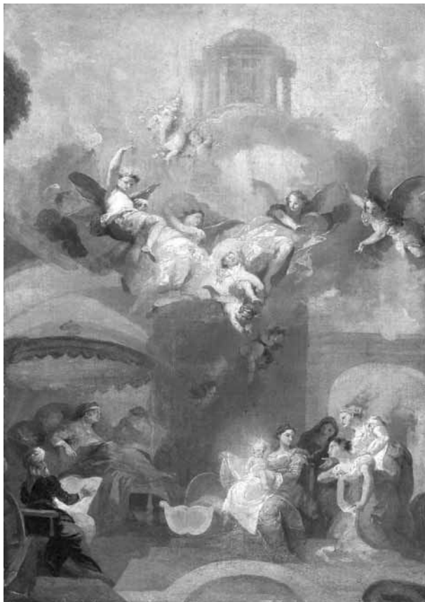
11. kép. Franz Anton Maulbertsch: Mária születése , 1795. Vázlat a szombathelyi székesegyház hosszházának mennyezetképéhez, olaj, vászon, 66x46 cm, Praha, Národní Galerie, Ltsz. O 2609