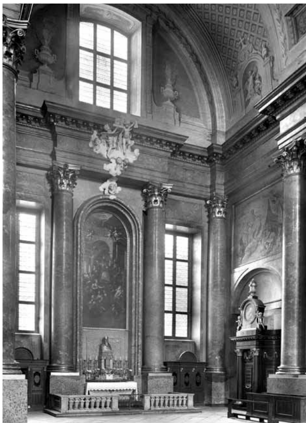
1. kép. Szombathely, székesegyház, az északi keresztházó a Szent Márton-oltárral és ifj. Josef Winterhalder Szent Márton álma -freskójával. Archiv fénykép, KÖH Fotótár 007.518 Nd

A festő a keresztházat klasszicizáló formavilágú díszítőfestésbe ágyazva összesen tíz freskófestésű képmezővel díszítette (1. kép). Az oltárok fölött a dongaboltozat illuzionisztikus megnyitásával – feltehetően színes képként megfestve – a felhős ég látszott, amelyben angyalglória dicsőítette az oltárképeken ábrázolt szenteket (2. kép). Lejjebb, a boltozat tövében, boltíves fülkékben grisaille angyalcsoportok álltak, és az oltárépitmények oromzatának stukkó-