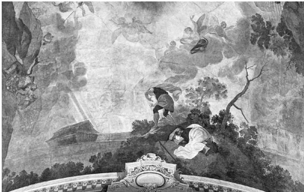
16. kép. Anton Spreng: Mária születése , 1807. Szombathely, székesegyház, a hosszház elpusztult mennyezetképe. Archív fénykép, KÖH Fotótár 007.520 Nd, részlet

Kármel-hegyi áldozatának történetét idézte (1Kir 18,30–46). Miután az égből érkezett tűz „megemésztette az égőáldozatot és a máglyát, még az árokban levő vizet is elnyelte”, Illés felküldte szolgáját, Elizeust, hogy figyelje, mikor küld az Úr esőt, maga pedig „fölment a Kármel csúcsára, leborult a földre, a térde közé rejtette arcát”. A tenger felől érkező felhőcske a leendő Istenszülő prefigurációja, „aki a megváltás jótéteményeivel árasztja el majd a világot” 40 E kévéssé ismert Mária-szimbólum, amit Maulbertsch korábbi művéből hozott magával, nyilvánvalóan a festő javaslatára került a programba, ahogyan Elizeus póza, alulnézetből ábrázolt expresszív karmozdulata is tükörképesen megismétlődött itt, egyben azt is bizonyítva, hogy Spreng milyen pontosan követte a neki átadott Maulbertsch-vázlatot. A Kármel-hegyi jelenet mellé a szombathelyi képmezőn egy másik, jóval elterjedtebb, a magyar imádságokban is jól ismert Mária-invokáció, Noé bárkája került, amelyet a festő baloldalt, a tenger vizén úszva ábrázolt.