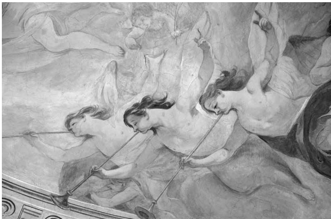
9. kép. Ifj. Josef Winterhalder: Az utolsó ítélet , 1800. Szombathely, székesegyház, Szent Mihály-kápolna, mennyezetkép, részlet

Ahogy a székesegyház mariológiai ciklusát is kiegészíti egy történeti témájú oltárkép, Dorffmaister István Szent István megalapítja a pannonhalmi bencés apátságot című festménye, a kápolnában is helyet kapott egy históriaábrázolás, A vasvári káptalan megalapítása