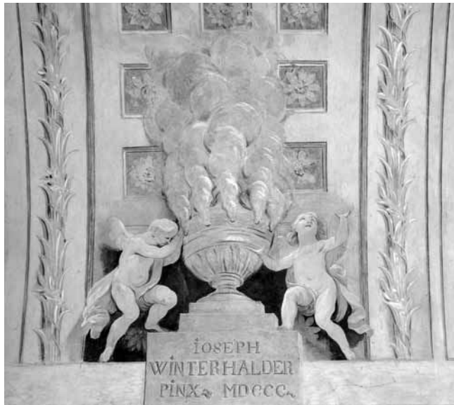
6. kép. Ifj. Josef Winterhalder: Füstáldozatot bemutató angyalpár , 1800. Szombathely, székesegyház, Szent Mihály-kápolna, hevederív