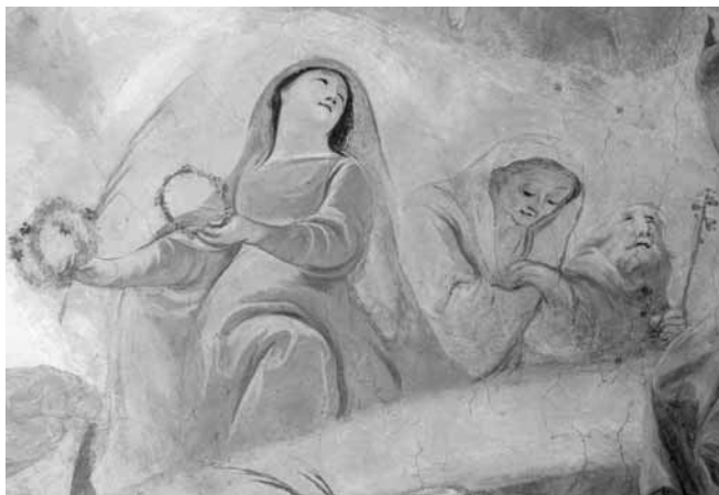
8. kép. Ifj. Josef Winterhalder: Az utolsó ítélet , 1800. Szombathely, székesegyház, Szent Mihály-kápolna, mennyezetkép, részlet

Szent Annának a haldoklók, halottak patrónájaként való tisztelete. 25