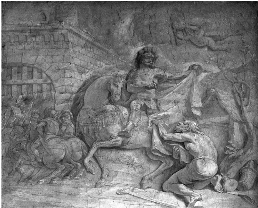
3. kép. lfj. Josef Winterhalder: Szent Márton és a koldus , 1799. A szombathelyi székesegyház északi kereszthajójának elpusztult falképe. Archív fénykép, KÖH Fotótár 007.521 Nd

képekből megítélhető, 11 Winterhalder ugyanazzal az igényességgel formálta meg ezeket a monokróm képeket, mint ami Maulbertsch nagy együtteseiben tapasztalható. Bár a jelenetek perspektivikusan szerkesztett terekben, tájakban játszódnak, a festői formálás révén a képek relief hatását keltették, ahogyan a főalakok a magas domborművekre jellemzően a laposab-