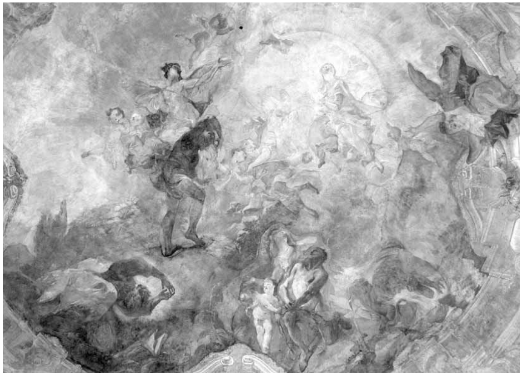
17. kép. Franz Anton Maulbertsch: A Skapuláré Királynéjának megdicsőülése , 1768. Székesfehérvár, kármelita templom, mennyezetkép a szentélyben

tudom, hogy te szabadítod meg Izraelt a kezem által, amint mondtad.” Majd miután ez megtörtént, azt kérte, „a gyapjú maradjon száraz, s legyen harmatos körös-körül a föld” (Bír 6,36–40). Gedeon gyapja Mária szüzi anyaságának jelképe, 41 a Boldogasszony gyakran ismételt invokációja 42 lett. A freskón valószínűleg a két epizód együttes ábrázolása volt látható. Az égben angyal lebegett, aki botjával lángra lobbantotta a sziklahalomra állított edényt, amely körül sűrű füst gomolygott. Visszanézett a képmező bal oldalán álló Gedeonra, aki immár vezérként, római katonai viseletben állt, jobbában hegyes dárdát emelve a magasba. Az archív fényképről nem vehető ki, de talán a lebegő angyal alatti sziklán feküdt a gyapjú. A jelenetet két-két katona keretezte: balról lándzsás alakok figyelték a csodát, jobbról a nézőnek háttal ülő páros látszott, az egyik harcos bal kezének gesztusával társa felé fordulva, izgatottan magyarázta az eseményeket.