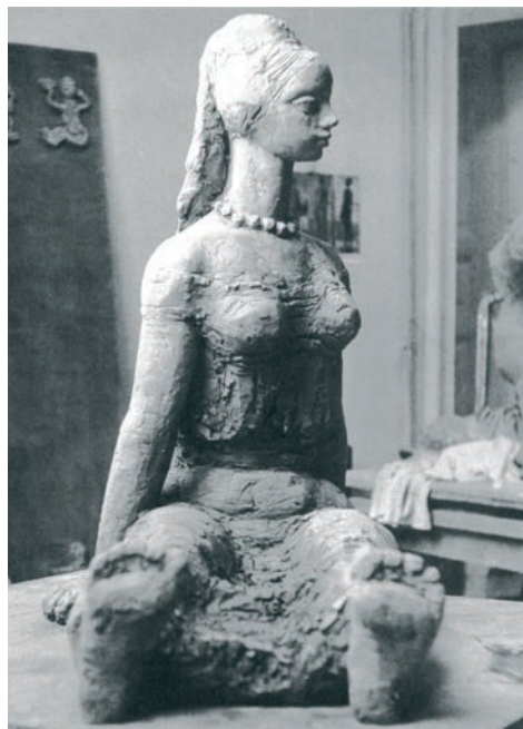
35. Várnagy Ildikó: Ülő nő , 1967