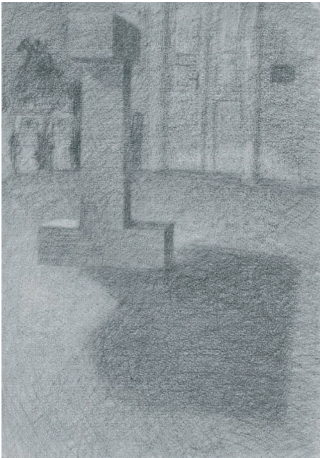
29. Méhes László, I. a: Mértani testek, 1959