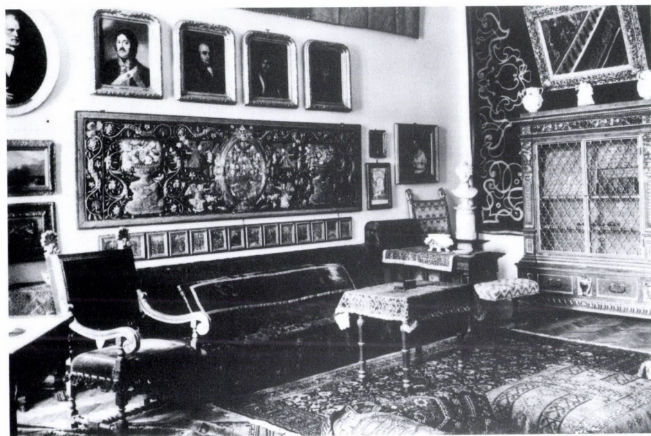
4. Füzérradvány. Károlyi-kastély. Szoba, 1930-as évek