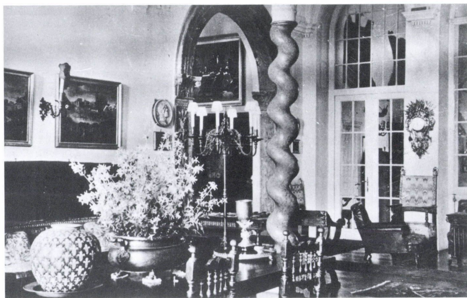
2. Füzérradvány. Károlyi-kastély. Földszint, szalon, 1942.