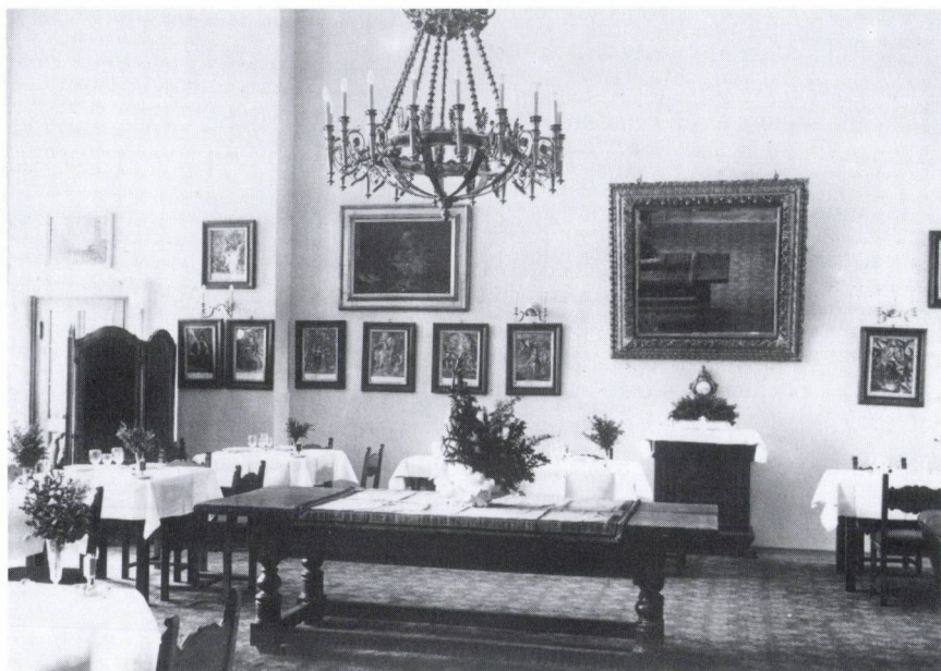
6. Füzérradvány. Károlyi-kastély. Szoba, 1930-as évek