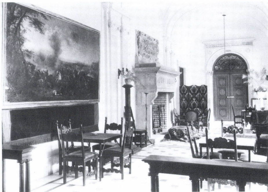
1. Füzérradvány. Károlyi-kastély. Földszint, márványfolyosó, 1930-as évek