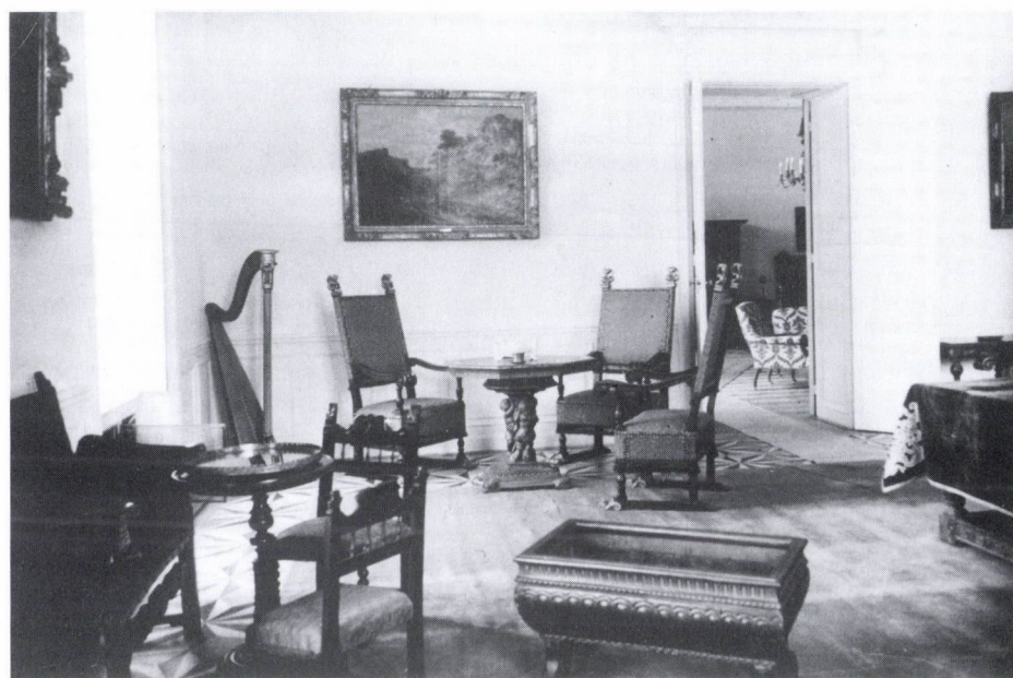
7. Füzérradvány. Károlyi-kastély. Szoba, 1930-as évek