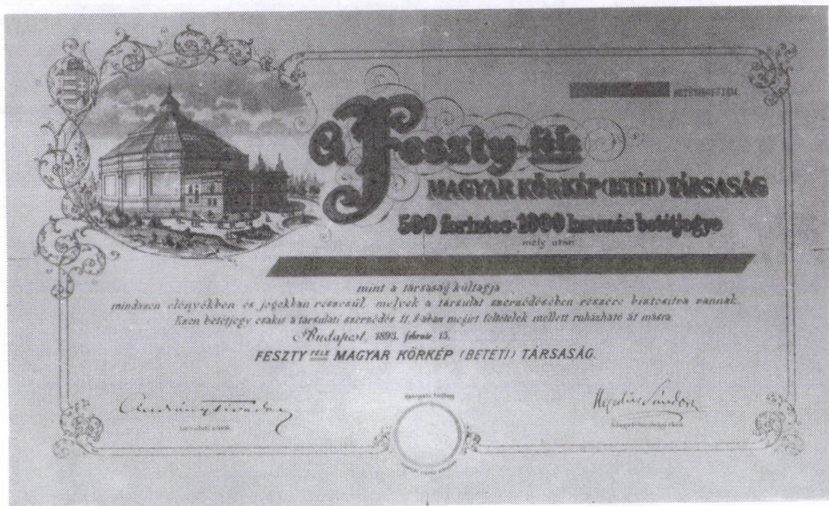
33. A Feszty-féle Magyar Körkép Társaság betétjegy