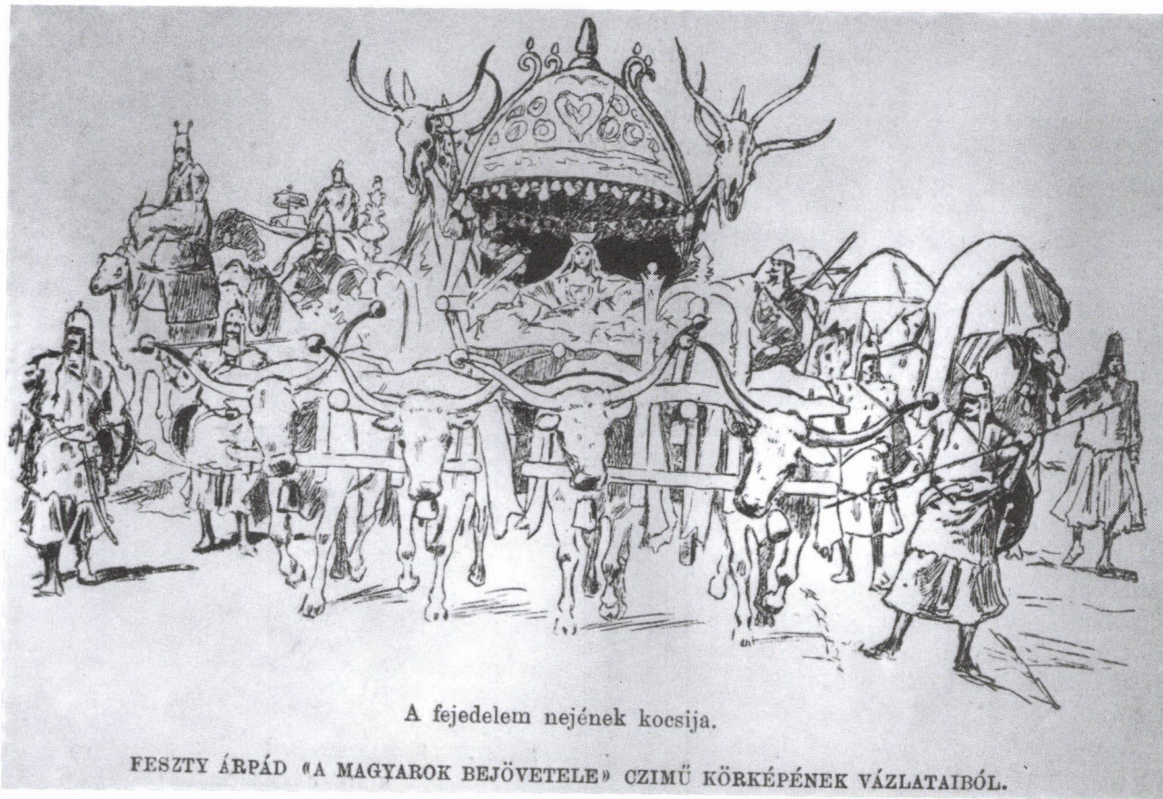
A fejedelem nejének kocsija.

FESZTY ÁRPÁD «A MAGYAROK BEJÖVETELE» CZIMŰ KÖRKÉPÉNEK VÁZLATAIBÓL.