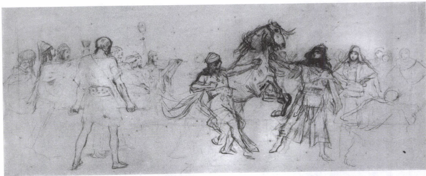
31. Vágó Pál: ceruzavázlat a Lovat áldozó magyarok jelenethez