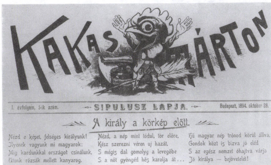
34. Egykorú paszkvillus Ferenc József körképlátogatásának alkalmából (Kakas Márton 1894. okt. 28-i címlapja)