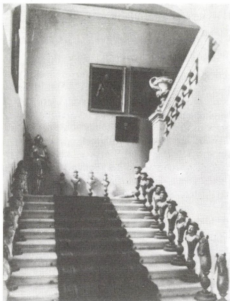
11. Bonchida, Bánffy-kastély, lépcsőház