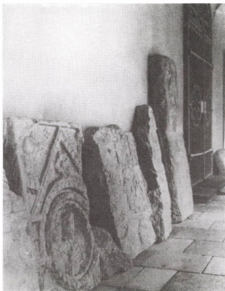
14. Gernyeszeg, Teleki-kastély. A folyosón elhelyezett római sírkövek Szöllősy Kálmán felvétele, 1930 körül. OMvH Fényképtára, ltsz.: 27160.