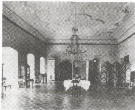
12. Bonchida, Bánffy-kastély, ebédlő OMvH Fényképtára, ltsz.: 138630.