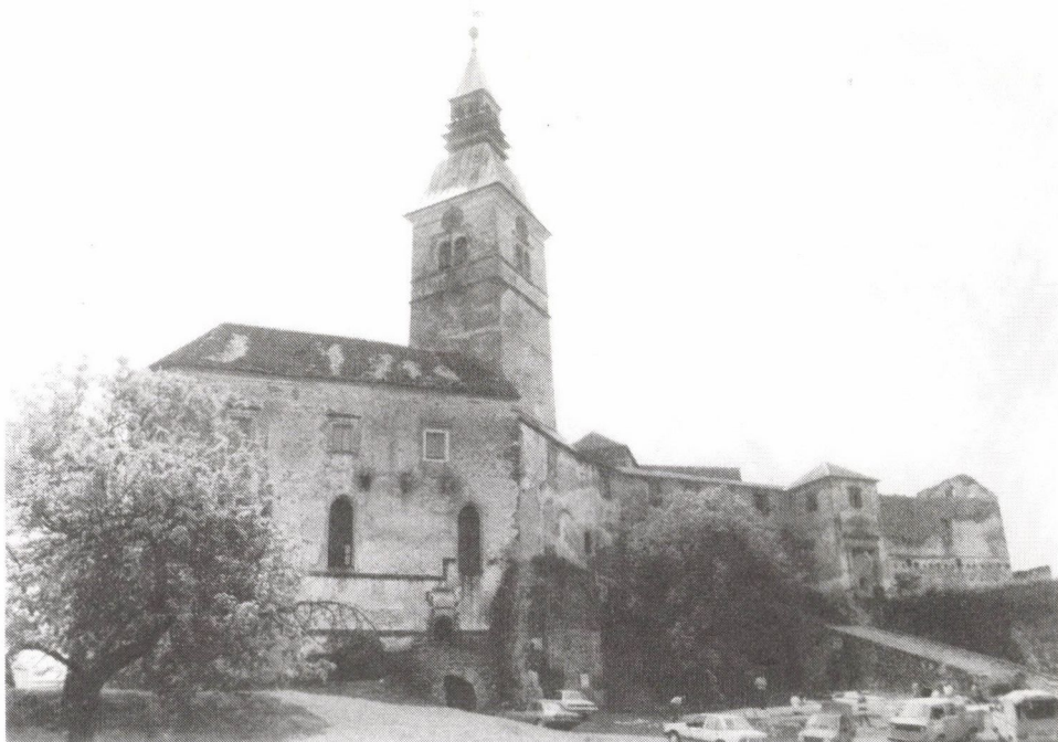
69. Németújvár, Batthyány-vár a belső udvarról