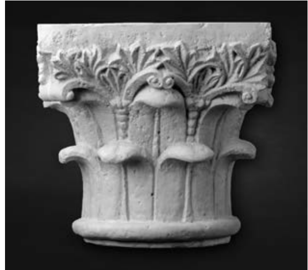
7. A Budapesti Magyar Királyi Állami Felső(építő) Ipariskola gipszöntőműhelye: Korai román kori oszlopfő a bényei apátság templomból, 20. század eleje Budapest, Schola Graphidis Művészeti Gyűjtemény, Gipszminta- és Szoborgyűjtemény, ltsz. 2015.600.004.

A szabadkézi rajzhoz, a szerkesztési rajzhoz és a mintázáshoz szükséges gipszminta-katalógusok Euró-