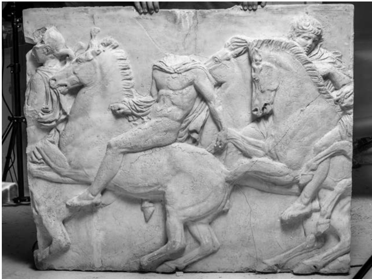
3. Ismeretlen műhely: A Parthenón-fríz északi XLI. táblája. Feltételezhetően a 19. században készült öntvény másolata, 20. század eleje Budapest, Schola Graphidis Művészeti Gyűjtemény, Gipszminta- és Szoborgyűjtemény, ltsz. 2015.600.050.

alapjait a régi Paedagogium, majd a később magánvállalként kezelt gyűjtemény nyújtotta. 9