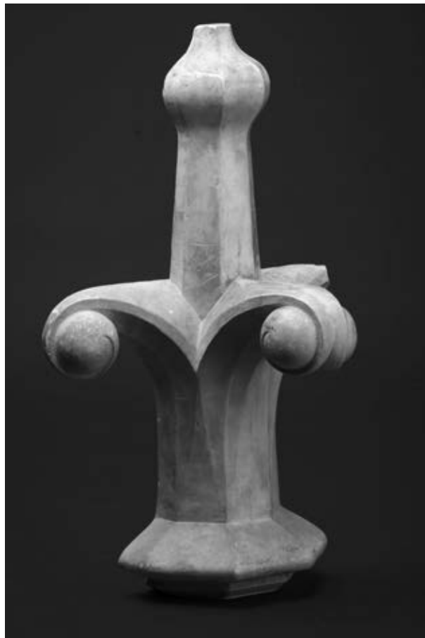
6. A Budapesti Magyar Királyi Állami Felső(építő) Ipariskola gipszöntőműhelye: Gótikus keresztrózsa a budavári Mátyás-templomról, 20. század eleje Budapest, Schola Graphidis Művészeti Gyűjtemény, Gipszminta- és Szoborgyűjtemény, ltsz. 2015.600.069.