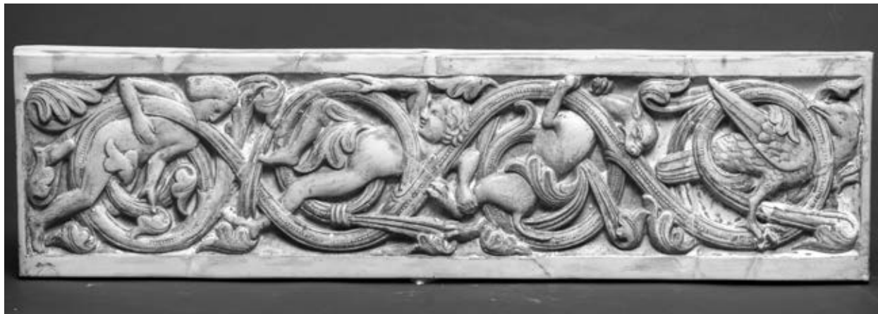
5. A Budapesti Magyar Királyi Állami Felső(építő) Ipariskola gipszöntőműhelye: Román kori fríz, 20. század eleje Budapest, Schola Graphidis Művészeti Gyűjtemény, Gipszminta- és Szoborgyűjtemény, ltsz. 2015.600.057.

lyek között „28 kisebb nagyobb szobor, 39 mellszobor, régi és újkori mintaszerű ékitmények styl szerint csoportosítva” szerepelt. 16 Volumenét tekintve a gyűjtemény 1896–1897-ben érte el csúcspontját 1804 darabban. 17 A szobrászattörténeti gipszmásolatok, az építészeti, ornamentális és anatómiai gipszmodellek a Székesfővárosi Iparrajziskola tanszereiként voltak nyilvántartva, az évkönyvek a könyvtári tételekkel együtt a „Könyvtári és tanszerek kimutatása” címszó alatt összesítették azokat. 18 1880–1881-ben a „Gipszminták” a Szobrászati Osztály szertárához tartoztak, 1887–1888-tól pedig már önálló tanszercsoportként szerepeltek a Szabadkézrajzi szertár, az Építészeti és a Könyvtár és a Kerámiai tárgyak mellett. A gipszminták, értéküket tekintve, ebben az évben a Szabadkézrajzi szertár mintalapjai mellett a második legnagyobb összegként jelentek meg 3295 forint 24 krajccal. 19