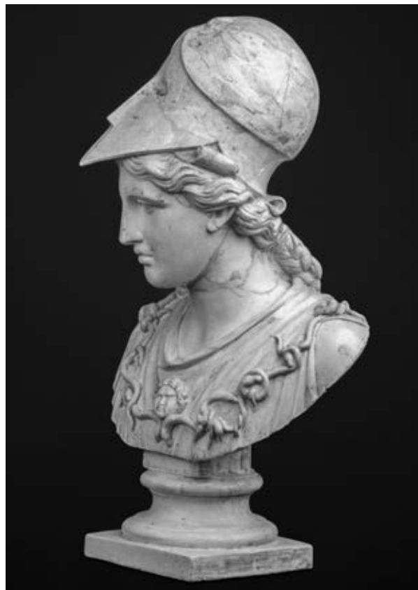
4. A Budapesti Magyar Királyi Állami Felső(építő) Ipariskola gipszöntőműhelye: Pallasz Athéné-mellszobor, 20. század eleje Budapest, Schola Graphidis Művészeti Gyűjtemény, Gipszminta- és Szoborgyűjtemény, ltsz. 2015.600.075.

A fennmaradt mintegy 100 gipszminta azonban csupán töredéke annak a mintagyűjteménynek, amely az