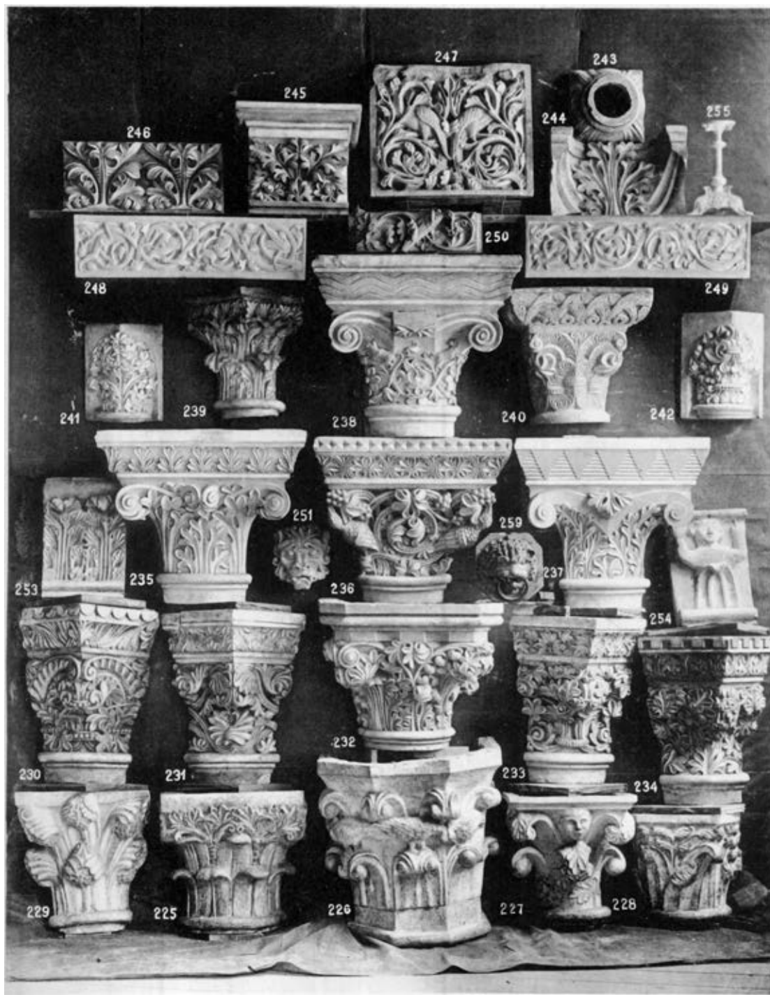
8. Román stílusú építészeti és díszítőelemek. A Budapesti Áll. Felső Ipariskolával kapcsolatos gipszminta-öntőműhelyben készülő minta- és szobormásolatok árjegyzéke. Budapest, Hornyánszky, 1904. IX. tábla