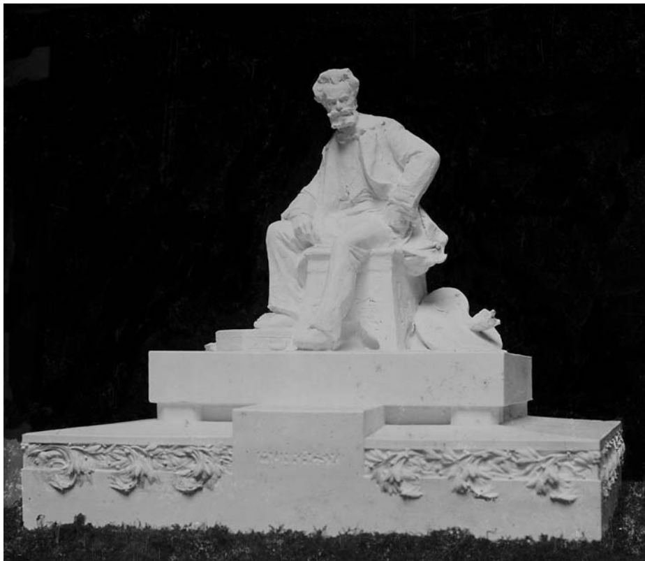
2. Radnai Béla pályaterve, 1906.

(esetleg ölében) palettája, mereng vagy elhivatottan, határozottan előre szegezi tekintetét, mintegy ihletet várva vagy valamely készülő műve megoldásának töprengve. Jellegzetes feje, haja, bajusza, szakállja minden terven megjelenik – igaz persze, hogy a pályázati felhívás hangsúlyozta: „A szobor kizárólag Munkácsy portrait-szobra legyen”. 16