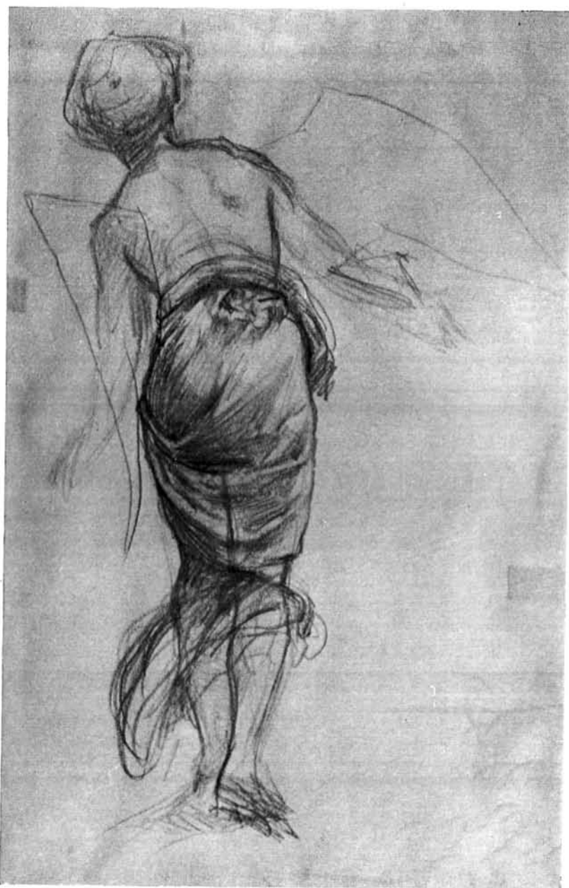
46. kép. Angyal alakrajz. Magántulajdon, Nyíregyháza