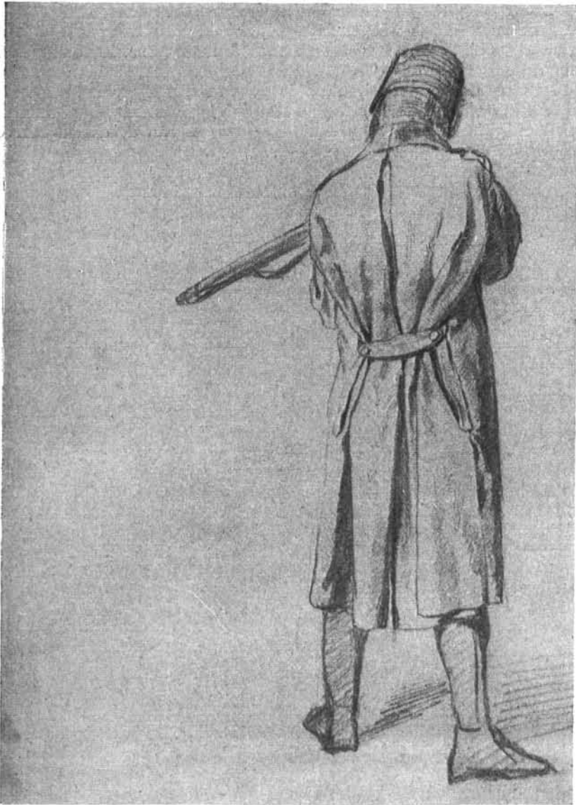
42. kép. Háttal álló katona. Magántulajdon, Nyíregyháza