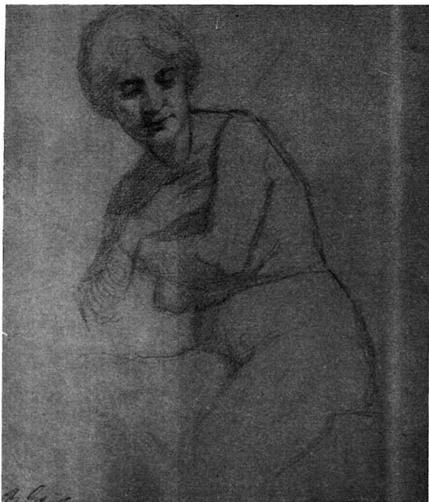
45. kép. Angyal alakhoz tanulmány. Magántulajdon, Nyíregyháza