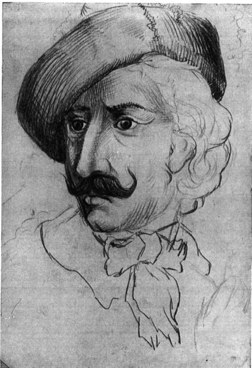
41. kép. Pörge kalapos tanulmányfej. Magántulajdon, Nyíregyháza