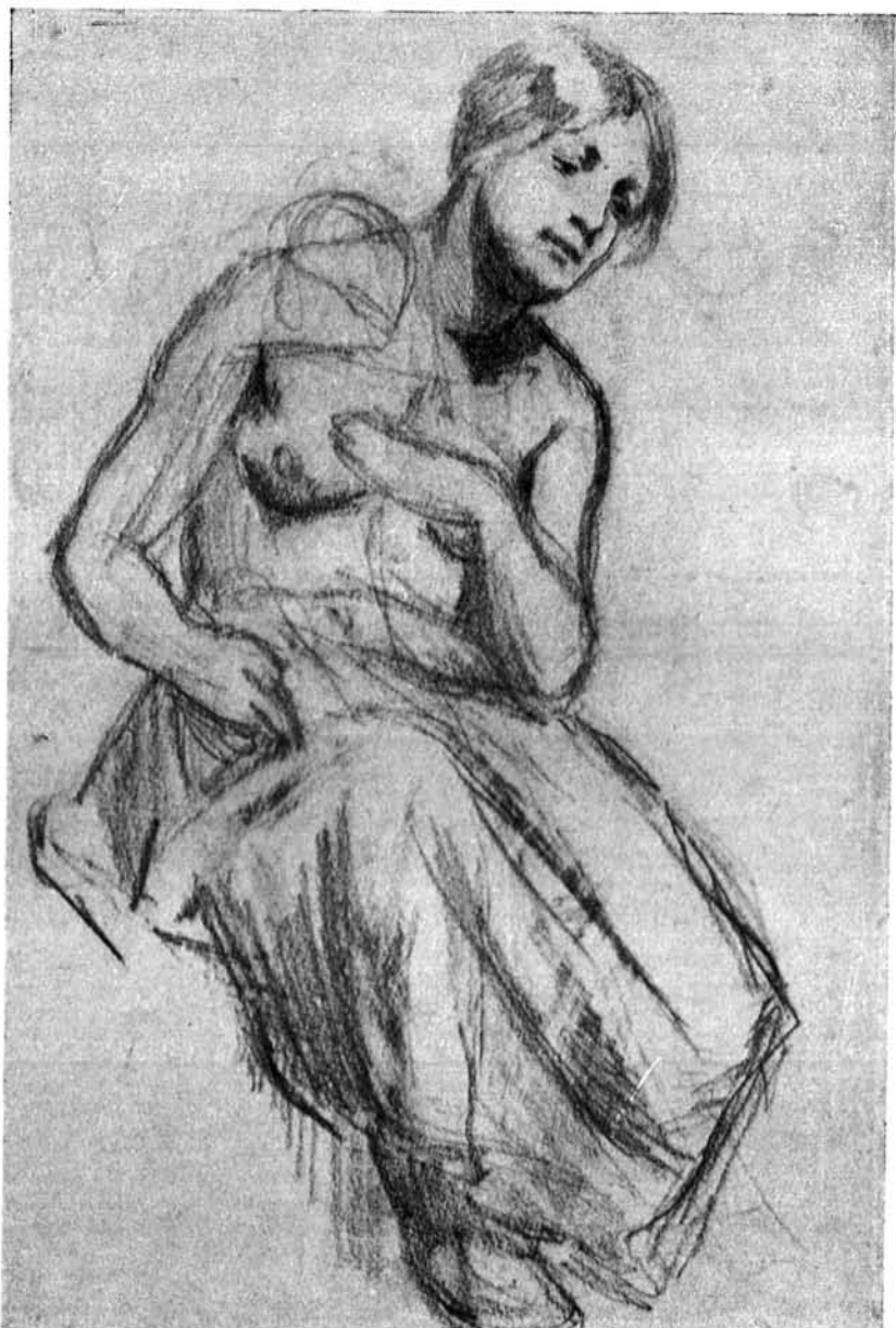
44. Madonna rajztanulmány. Magántulajdon, Nyíregyháza