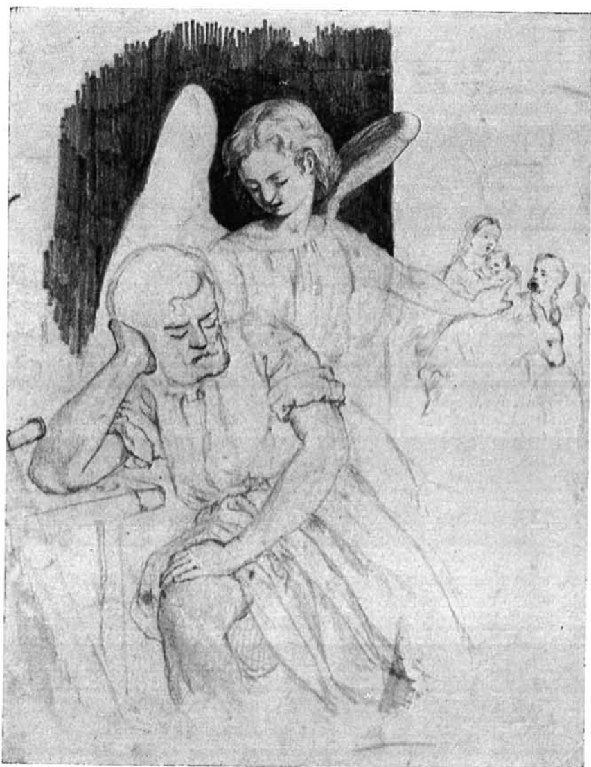
40. kép. József álma. Magántulajdon, Nyíregyháza