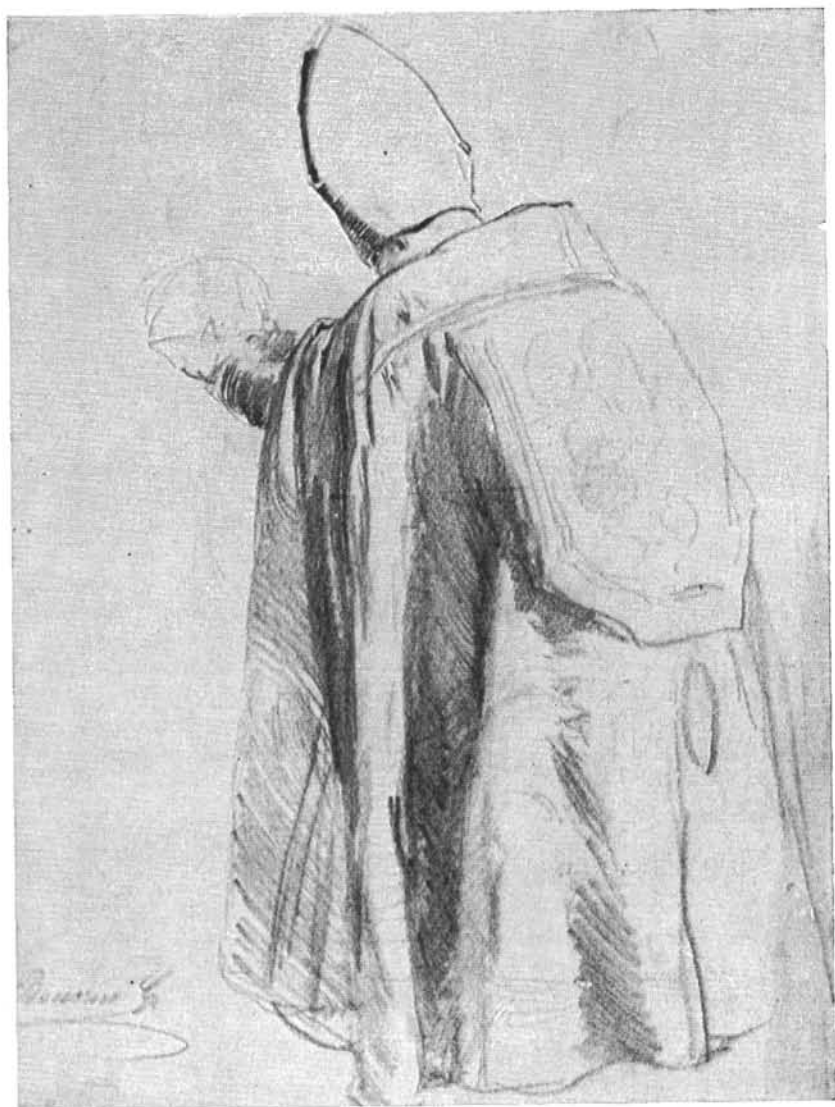
43. kép. Püspök alakja. Magántulajdon, Nyíregyháza