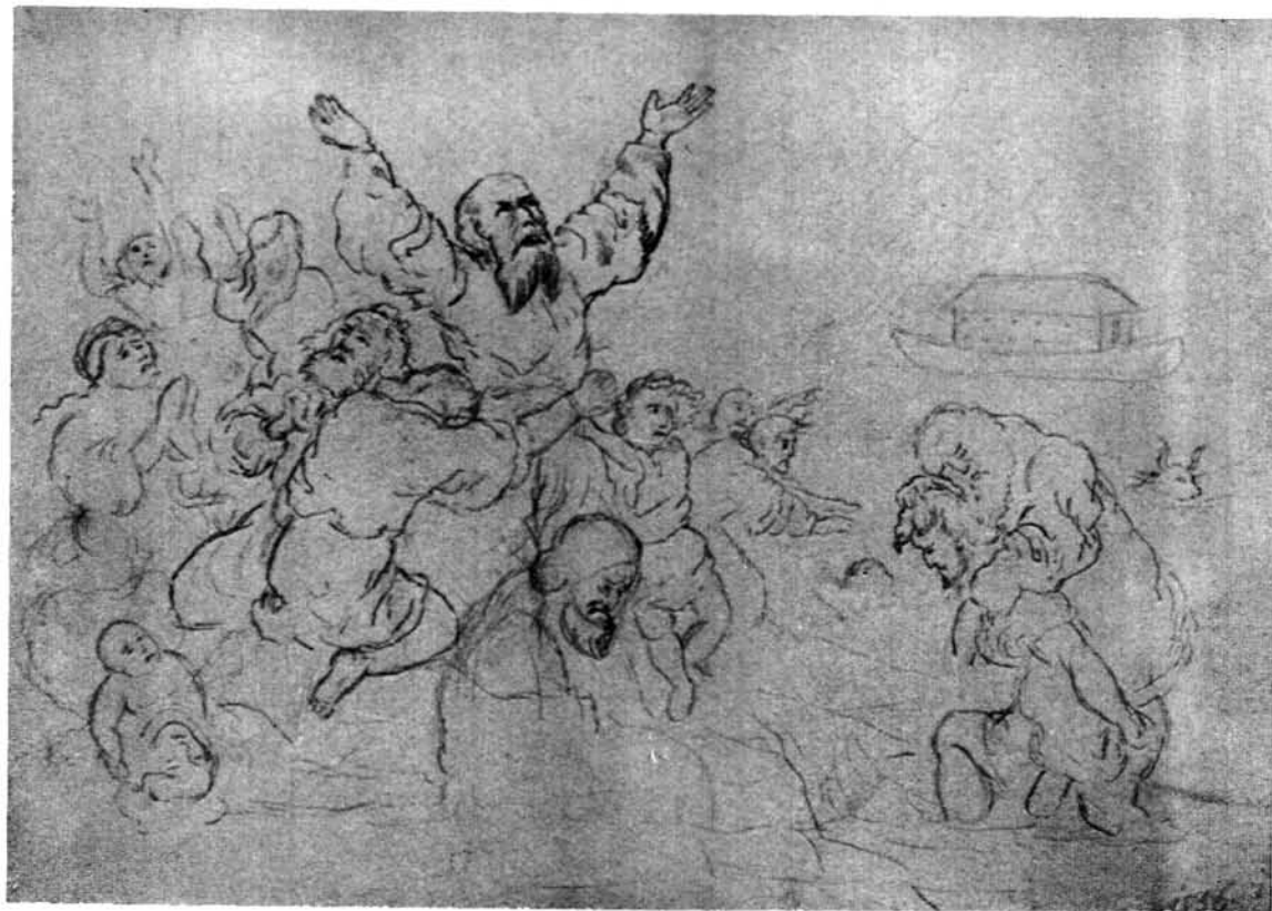
36. kép. Noé bárkája. Magántulajdon, Nyíregyháza