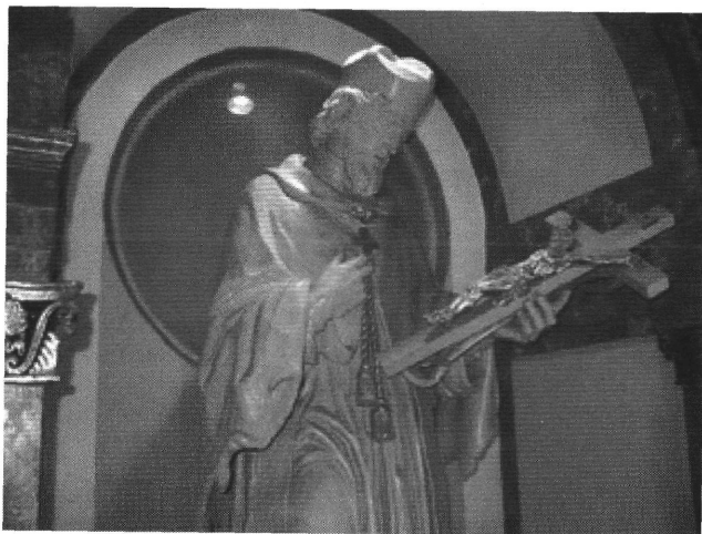
2. A makói szobor.