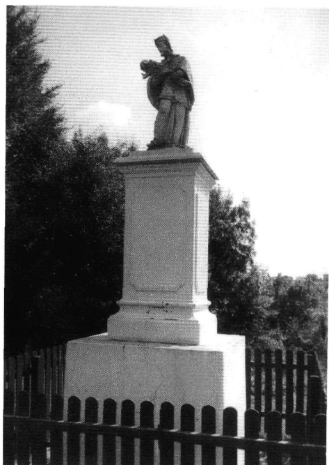
5. A szegvári szobor az 1992. évi restaurálás után