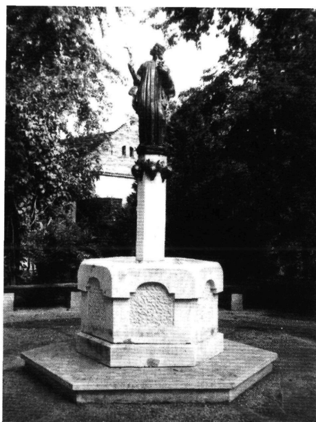
8. Csongrádi díszkút Máté István alkotta bronzszoborral.