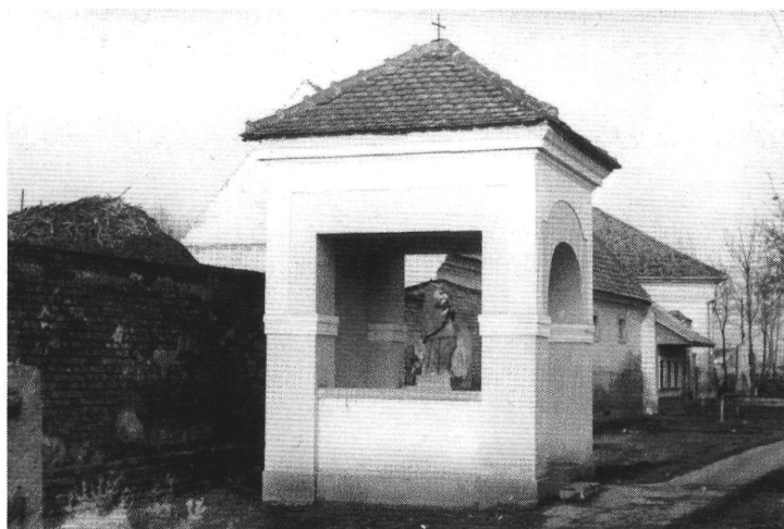
3. A kiszombori Nepomuki Szent János szobor baldachinházzal