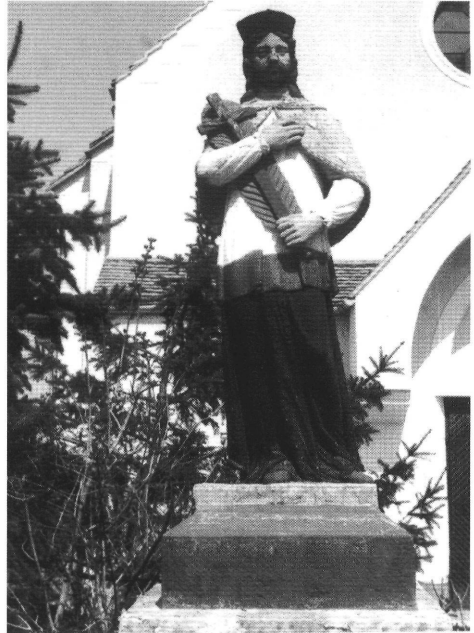
14. A szent szobra Tápéról.