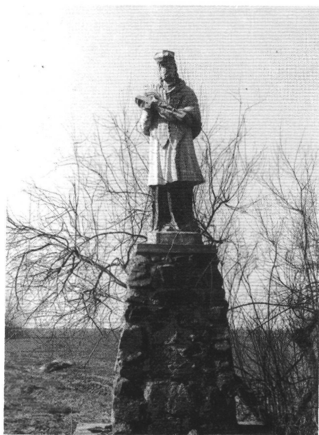
12. A sándorfalvi szobor (Juhász Antal felvétele 1980.)