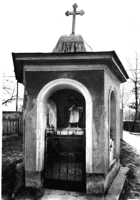
6. A csanádpalotai szobor a baldachin házzal