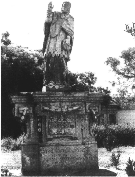
13. A kiskundorozsmai szobor 1811-ből. (Juhász Antal felvétele, 1980.)