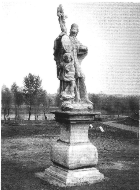
9. Máté István legújabb csongrádi szobra Nepomuki Szent Jánosról.