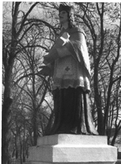
10. A földéaki templom előtt álló szobor