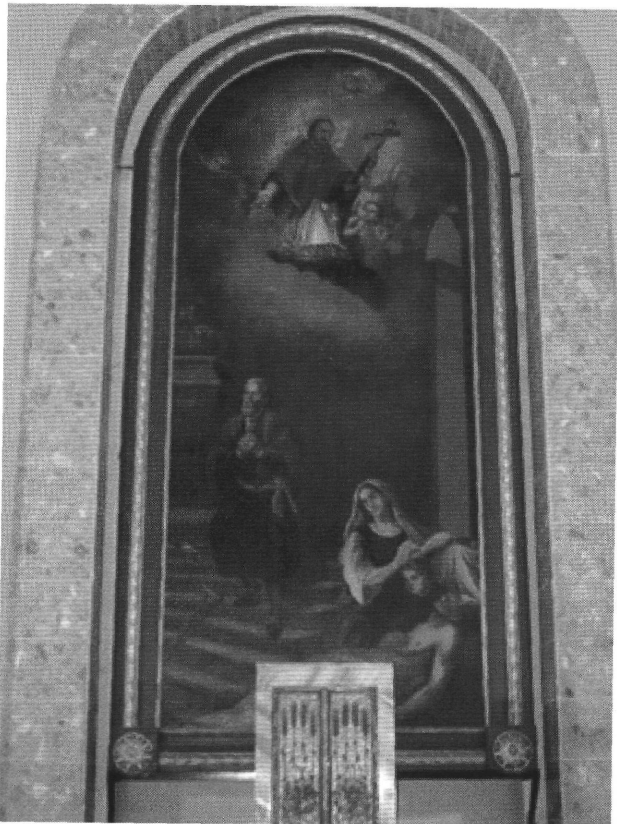
1. A csanádpalotai templom főoltárképe.