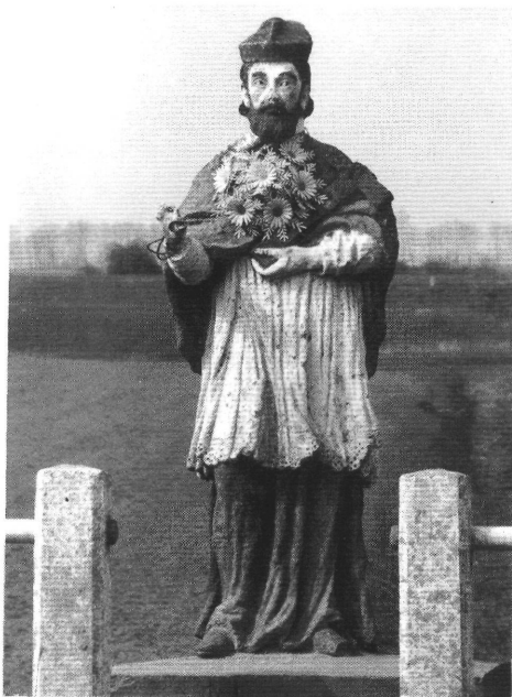
11. A szentmihályteleki szobor.