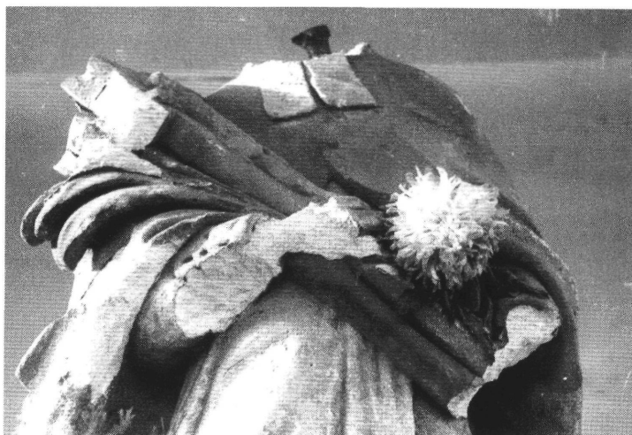
4. A kiszombori Nepomuki Szent János szobor 1965-ben