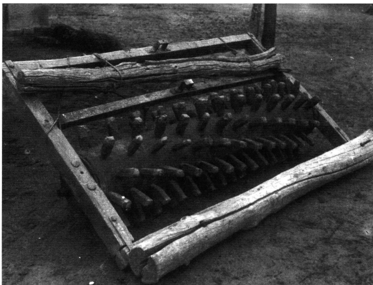
2. kép. Fogashenger

környékén a fogashengernek egy újabb változata terjedt el. Ez a gyűrűshengernek nevezett szerszám egy tengelyen forgó vas- vagy fahengerre erősített fémgyűrűkből állt. A hengerek fémgyűrűi a fogashengernél is jobban vágták bele a szalmát a földbe 77 (3. kép).