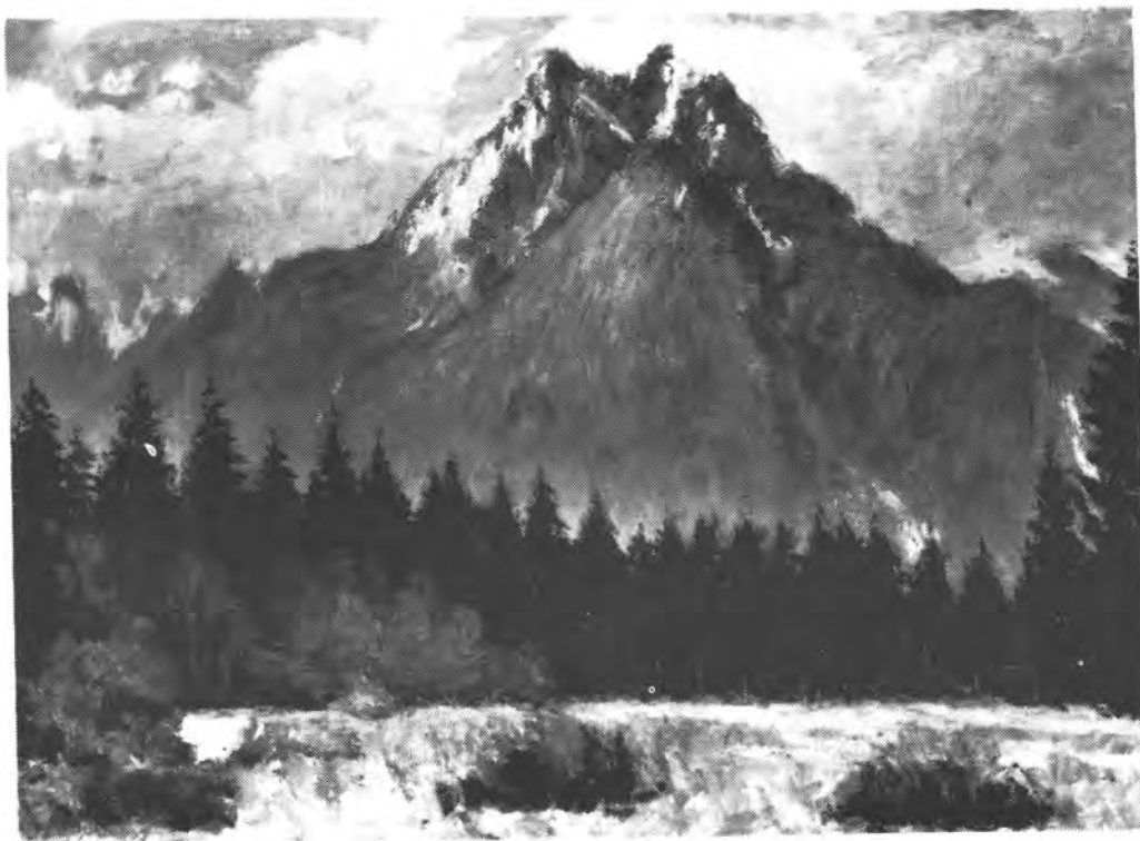
Papp Gábor: Tátrai tájkép vászon, olaj; 103x75 cm; Y.B.L. A Szegedi Móra Ferenc Múzeum tulajdona