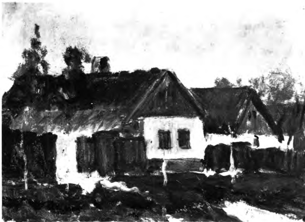
Papp Gábor: Tápai utcaképlet deklí, olaj; 33,5x23,5cm; Y.Y.L. A Szegedi Móra Ferenc Múzeum tulajdona