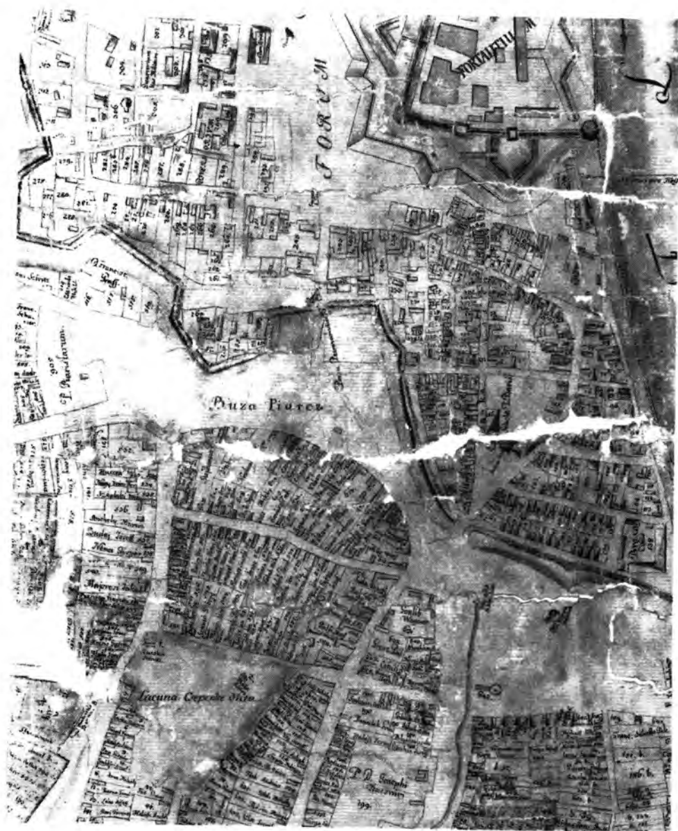
1. Részlet Balla Antal 1776-os térképéről (MFM térképtár)