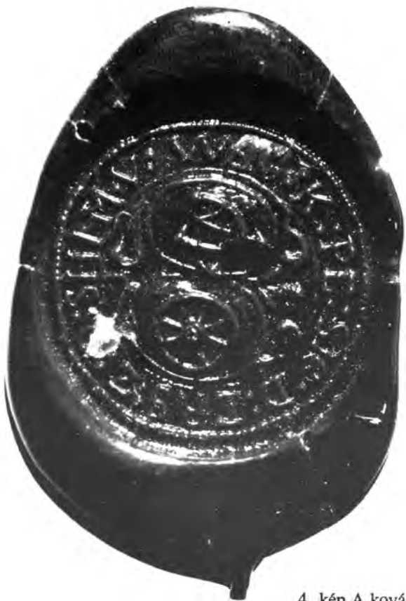
4. kép A kovács-bognár céh pecsétjének lenyomata.