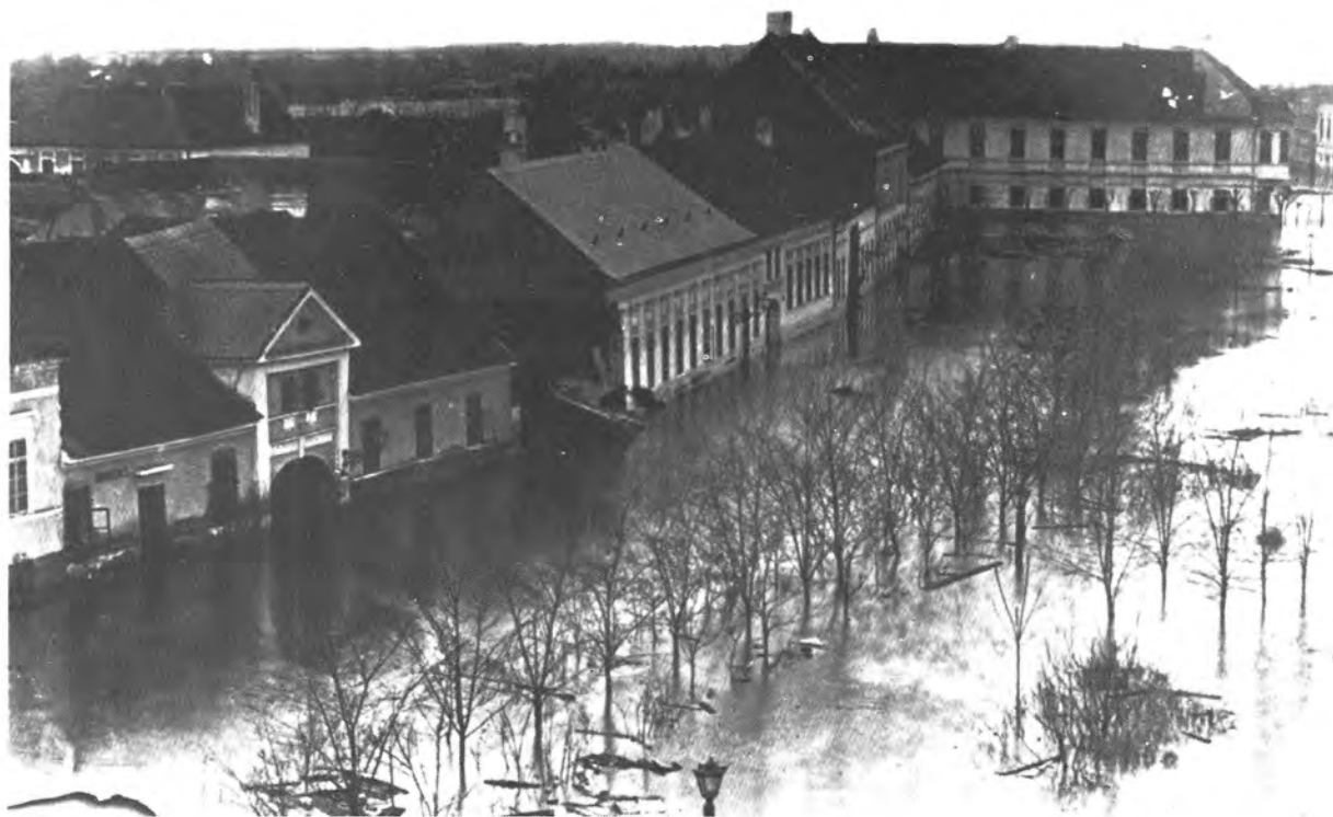
5. kép A Reizner ház a Dugonics téren 1879-ben. Az egykori fogadó falán "Borkimérés" felirat.