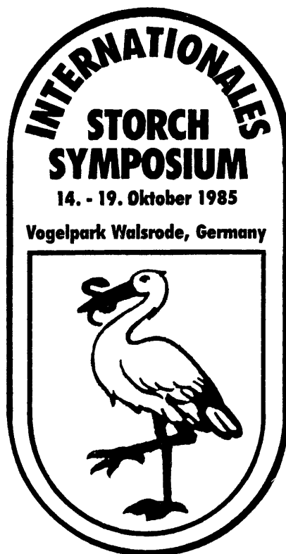
1. ábra. A walsrodei gólyaszimpózium emblémája.

lelések, értesülések feljegyzését sem. A június közepe utáni adatok kérése ugyanis elősegíti a fiókaadatok legjobban megközelítő pontosságát és a HPx minél alacsonyabb számát (utóbbit vö. a VII. táblázatban). Ennek biztosítására a postahivatalok dolgozóinak felkérését a közreműködésre, a Posta Vezérigazgatóságának szíves hozzájárulásával, a Postaügyi Értesítő júniusi számában kértük közölni. A felmérés sikerét a postahálózat értékes közreműködésén kívül az MME-tagok nagyszámú részvétele, az erdőgazdaságok dolgozóinak jelentős közreműködése, a vadásztársaságok tagjainak, az iskolák szakköreinek, tanárainak és más madárbarátok lelkes munkája tette lehetővé. Minden közreműködőnek ezúton mondunk köszönetet.