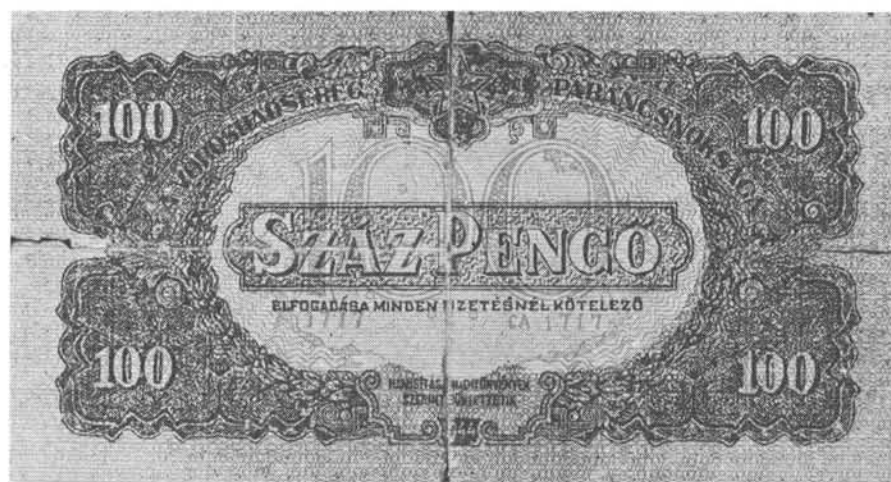
5—6. ábra A Vörös Hadsereg által kibocsátott 100 pengős mintájára készített propagandapénz elő- és hátoldala

letétbe helyezhette mindenki a birtokában levő rubel bankjegyeket. 1945. június 20-án kezdtek meg a beváltást 2,50 pengő árfolyamon (1 rubel = 2,50 P). 77 A letétbe helyezés mellett azért döntött a város vezetősége a pénzügyi szervekkel való előzetes megbeszélés alapján, hogy ne zúduljon Szegedre a környék és még távolabbi vidék egész rubel-bankjegy állománya. Június 28-ig 4 500 000 rubel értékű bankjegyet vettek át. 78