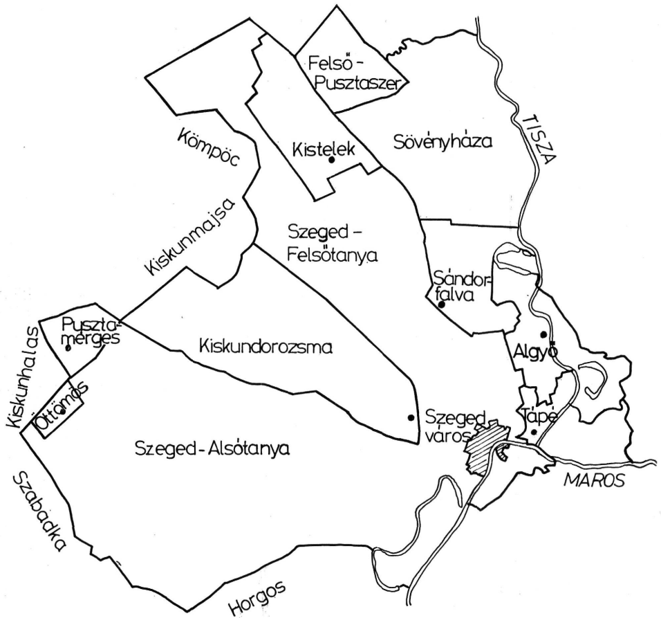
1. kép. A kutatóterület települései közigazgatási határukkal az 1900-as években.

rövid ideig, mindössze fél évszázadig volt a Pallaviciniek birtoka. Az uradalomnak így körülhatárolt, kutatott területe a századfordulón 55 718 kat. holdra rúgott. 3