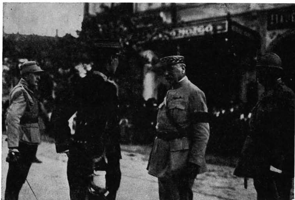
3. A francia tisztek és Bratianu román százados (balról az első)