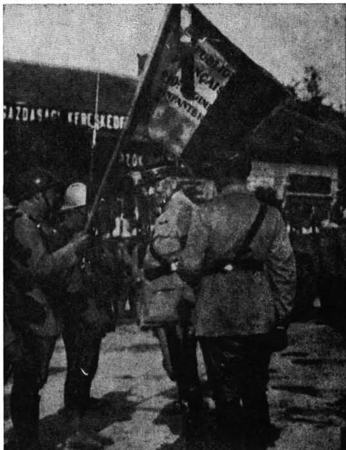
4. De Lobit tábornok a 210. francia gyalogezred csapatszázlaja előtt