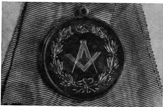
Az Árpád páholy jelvénye (Bóna Endre gyűjteményéből)