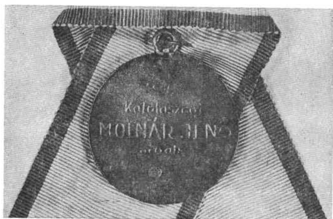
A Szeged páholy jelvénye (Bóna Endre gyűjteményéből)

13-án nyerte el, a mesterfokot rá egy hétre, 20-án már meg is kapta (uo. 351). A mesteri okmányát március 4-én küldte le Pestről a nagypáholy (uo. 348).