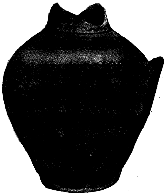
1. ábra. A pénzeket rejtő vizeskanta.

1970. június 16-án pénzlet került elő Makón, a Hunyadi utca 16. sz. telken. Az utca páros oldalának ezen a szakaszán azóta több tizenöt lakásos OTP házat építettek fel. A régi házak szanálása után a területen szintegyengető, ill. az új házak alapjainál feltöltési munkákat végeztek. E munkák során a 16. sz. alatti régi ház döngölt agyag padlóföldjét és az alatta levő homokréteget 30—40 méterrel távolabbra kezdték elhordani. A földet többek között Tasi Mihály fuvarozta. Egy alkalommal — akkor még úgy vélte, földdel teli — letört szájú, széles nyakú, egyfülű vizeskantát is feldobott a kocsijára, amely a föld leszóródásakor éppen az épülő ház betonalapjához ütődött és széttört. Ekkor kerültek elő a pénzek, tulajdonképpen másodlagos helyről.