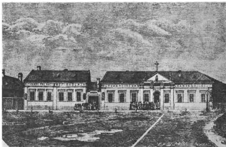
A régi apácaiskolák a 76. sz. alatt (1873—1900)

A századfordulótól már csak emeletes házak épültek, és ekkoriban kezdődtek az emeletrá húzások is. 1899-ben a 33. számú, 1910-ben az 5., 9., és 25., számú házat bővítették emelettel. 1900-ban épült föl a Miasszonyunkról elnevezett iskolanőnővérek tanítóképző intézetéül a 76. sz. alatti épület (ma a Juhász Gyula Tanárképző Főiskola 2. sz. gyakorló általános iskolája), az utcai fronton egyemeletesnek; az udvari szárnyépület már akkor kétemeletes volt. 1913-ban kapott az utca felől is újabb emeletet. 1905-ben épült a 17. és 55. sz. egyemeletes lakóház.