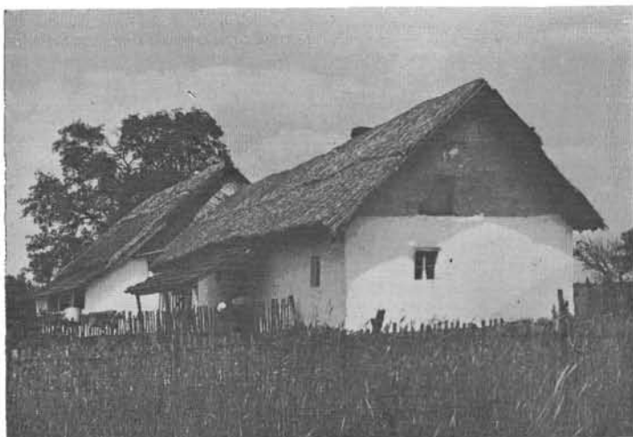
3. kép. Ásotthalom 1345. Az egyik legrégebb öregátokházi tanya. Épült a 19. sz. közepén

örökrész jutott egy-egy gyermeknek, ott — a házastárs hasonló örökségével együtt — az utódok gazdák maradtak, gazdai szinten tudtak élni, termelni. Az idősebbek véleménye szerint: „Huszonvalahány hold egy kézen, az már jógazda volt.” Ekkora földdarabon már lehetett számottevő jószágállományt — 2 lovat, 4–5 szarvasmarhát, 8–10 disznót, 20–30 birkát — tartani, volt benne gabonának, paprikának megfelelő szántó és került szőlőtelepítésre alkalmas homok is. Ezt a táj változatos térszintje, talaja tette lehetővé. — Átokházától északra, a pusztamérgesi vagy még inkább a halasi homokon ugyanis hasonló földterületen, nagy családnak csak szűkös megélhetésre futotta. Amikor megindult a szomszédos járásek parcellázása, az átokházi „örökföldesek” a bérföldekkel növelhették gazdaságukat. Több örökföldes gazda a bértellett együtt 40–50 holdon gazdálkodott.