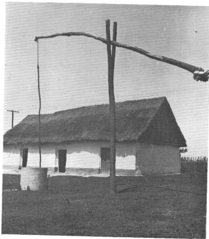
5. kép. Tanyaudvar: istálló gémeskúttal

Említettem, hogy elköltözésre alig találni példát. Néhány család „feketére akart menni”, ahol több gabona terem, de számuk igen csekély. Más településről beszármazó családokról sem tudnak. A déli szomszéd Szabadka volt. „Csak nincs olyan,