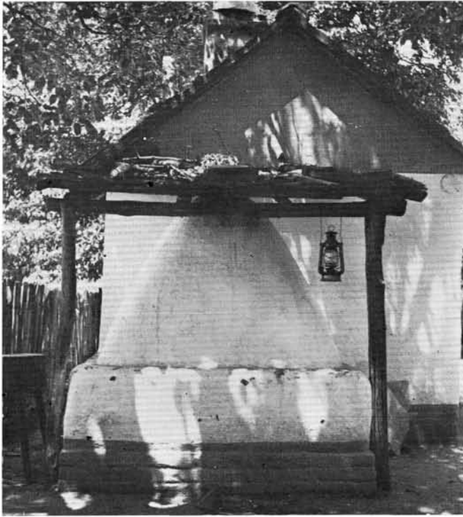
6. kép. Nyári kemence

munkaalalom, de egyben olyan összejövétel, ahol iszogatnak, énekelnek is, — kivált a munka végeztével. A lakodalom előtti napon szokásos ágyvitel ugyancsak munka és összejöveteli alkalom, amikor tréfás alkudozások, vaskos találókérdések hangzanak el. Magának a lakodalomnak a leírása nem tartozik feladatomhoz, csak annyit jegyzek meg, hogy módos családok 20—30, szegényebbek 10—15 házat (háznépet) hívtak meg. A szülők, testvérek, sógorok, komák mellett elsősorban a jószomszédok voltak hivatalosak. A hívatlanok elmehettek lagzinéző nek. A lagzinézés külön összejöveteli, mulatozási alkalom volt a hívatlanok számára, sokan számítottak is rá. Hagyomány volt, hogy a tanyaudvaron egy hordó bort, asztalra paprikáshúst, kalácsot készítettek a lagzinézőknek. Nagyobb lakodalomra sokszor ötvenen is összebandáztak , főleg asszonyok, de legények, fiatal emberek is. Etek-ittak, énekeltek, volt olyan hely, ahol a zenészek elhúzták a lagzinézők táncát. Kíváncsian lesték, mikor hozzák a menyasszonyt, majd sötétedés után elszéledtek. Olyan erős hagyománya volt e szokásnak, hogy még a közeli tanyasorra, Gátsarokra is elmentek lagzit nézni. Nem volt szegény lagzinézőként enni-inni, sőt a tehetősek igyekeztek a hívatlanokat minél bőkezűbben vendégül látni: volt, aki előre megmondta, hány száz literes hordót fog csapra ütni. A lagzinézők serege Átokházán a második világháború alatt s utána maradozott el.