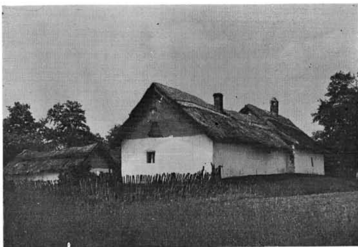
4. kép. Ásotthalom 1345. (Másik oldalról)

éltek. Öregátokházán a legidősebbektől sem hallottam, amit a Szegedhez közelebb tanyákon az öregek még emlegetnek: „hazamögyünk” — ha a városra mennek A város már nem jelentett számukra otthont, ám a tanya az otthon és a gazdaság teljes egysége volt minden átokházinak a születéstől a halálig. Ugyanakkor Szeged városának közigazgatási szervezetéhez tartoztak, de ez nem jelentett egyebet, mint azt, hogy Szegedre mentek adót fizetni és évente ellátogattak az alsóvárosi havibúcsúba (aug. 5.).