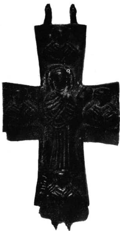
3. Mellkereszt bronz XI. század Szentés, Koszta József Múzeum