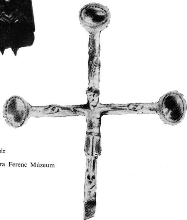
4. Kereszt aranyozott réz XI. század Szeged, Móra Ferenc Múzeum