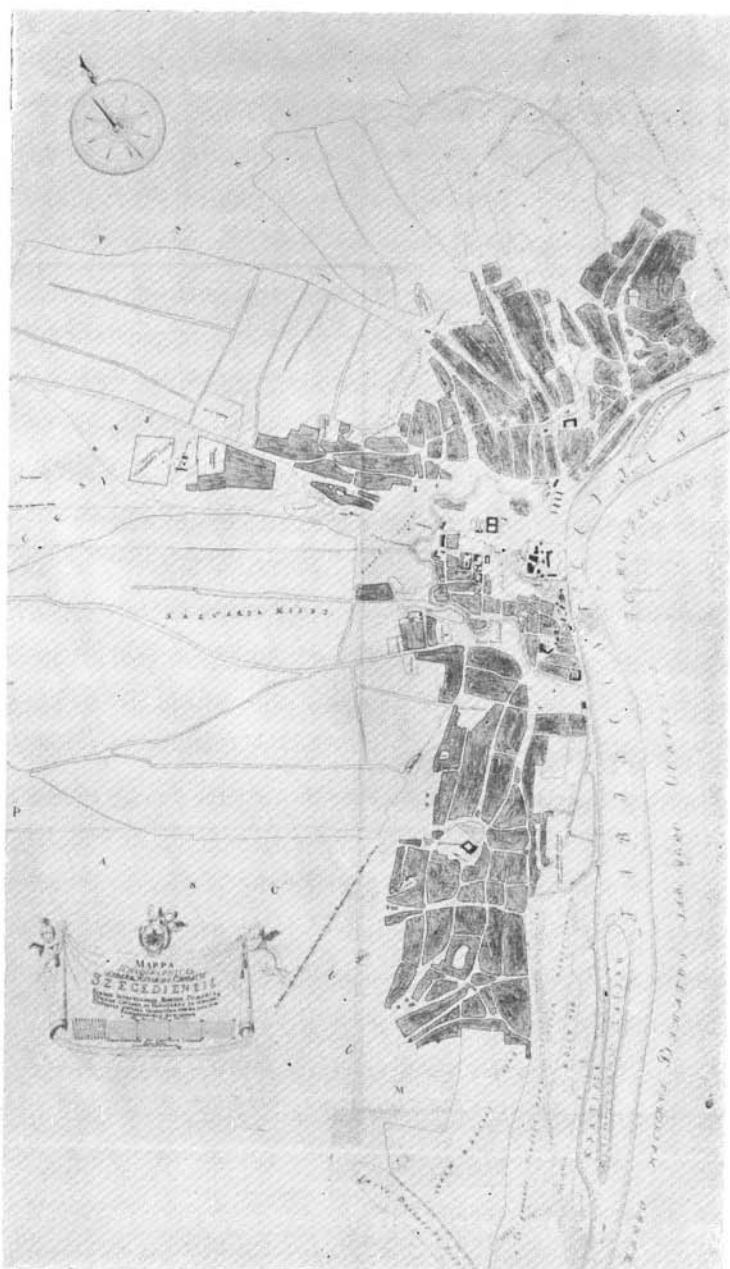
Balla Antal kéziratós térképéről készült vázlat. (A sötét részek a lakótelepüléseket jelzik.)