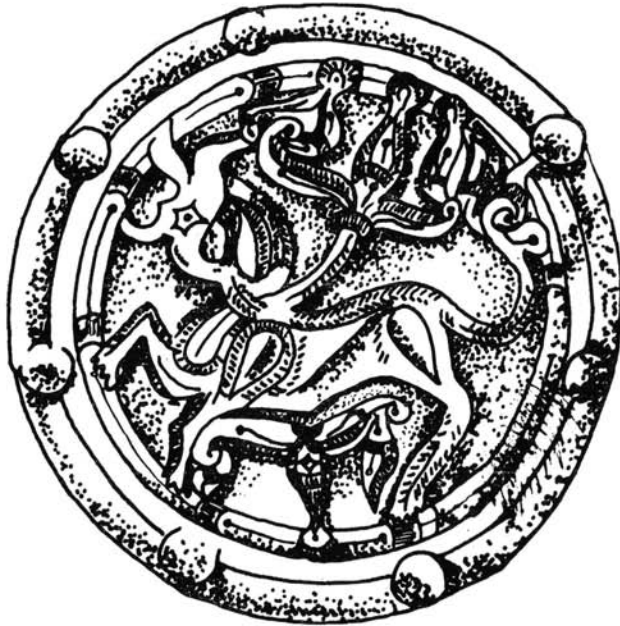
2. kép Az egyik zempléni poncolt korong Fettich N. rajza nyomán

A honfoglalás kori korongok esetében nem ezzel az esettel állunk szemben. A palmetta a nyak és a hát találkozásánál, tehát pontosan azon a helyen kapcsolódik a ló testéhez, ahol a lovagló ember ülni szokott. Lényeges felidézni, hogy a szaltovói kultúra — melynek korongjai rokonságban állnak a mi példányainkkal 37 — díszeinél más állatok mellett gyakori a ló ábrázolása is, 38 de ez a képi megfogalmazás ismeretlen. Korábban feltettem, hogy hazánk területén e hajfonatdíszek a szaltovói kultúra révén a magyarokhoz a honfoglalás előtt csapódott alánok jelenlétére mutatnak. 39 Így a jelek szerint az idegen ötvösmesterek a hagyományos ábrázolásukat a megrendelők igényének megfelelően kibővítették, az azok számára egyéb tartalmat is jelképező növényi elemek bevonásával.