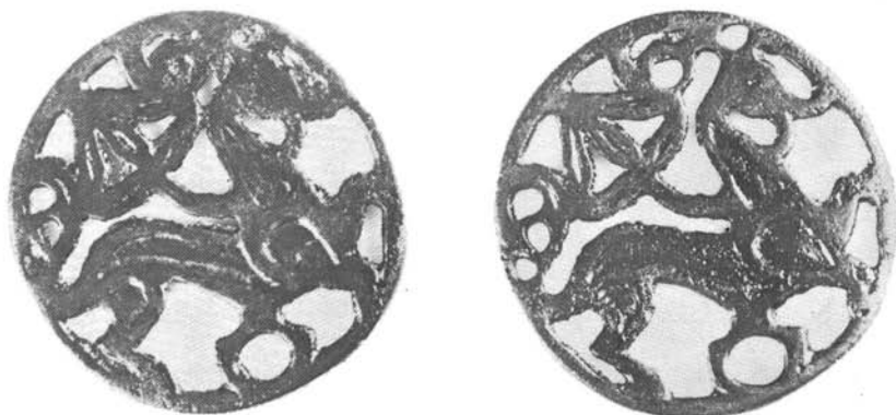
1. kép. Áttört bronz korongpár Mocsról (Moča, Csehszlovákia)

A legrégebbi időkre visszanyúló szarvas-kultusz mellett a pogány magyarok hiedelmeiben a ló megjelenése egy fiatalabb korszakba sorolható. Ez Diószegi V. szerint a táltos-hit megszilárdulásával egyidőben, a lovas életmódra való áttéréskor került előtérbe. 34 Évszázadok múlva, a honfoglalás korában már különböző korszakok, a hitvilág többféle elemeinek ötvöződését fejezték ki a díszítőmintákkal. Jól szemléltetik ezt a közismert bronz hajfonatdíszek (1. kép) és az egyik zempléni poncolt korong (2. kép). 35 Rajtuk még az állatábrázoláskor is a növényi minta túlsúlya figyelhető meg, sőt, magából a ló testéből nő ki a háromszirmú palmetta. 36 Az iráni művészetben — s mindenütt, ahol ennek hatása kimutatható — nem ritka az olyan ábrázolás, ahol az állat testrészei (lába, farka) növényi elemekben végződnek.