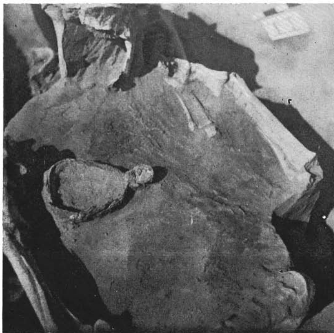
5. kép Honfoglalás kori lovassír képe a lóbőr okozta elszíneződésekkel

jelezték a lócsontok közötti területen a lóbőr egykori jelenlétét. (5. kép) Az elszíneződések a csontok közelében 2—3 cm vastagságban mindig jelen voltak. A vegyszeti elemzés oly nagy mértékű foszfor-feldúsulást mutatott ki e területekről, 55 mely csakis jelentős mennyiségű szervesanyag jelenlétével magyarázható. A keleti példák 56 után így vált bizonyossá, hogy a honfoglaló magyarok lovastemetkezéseinél is a koponyával és a lábcsontokkal együtt a sírba került a háts lenyúzott bőre is. László Gy. mutatott rá, hogy ennek a hiedelemvilág szempontjából van jelentősége. Példákat sorolt fel, hogy az állat bőrével való érintkezés miként jelenti az annak szellemével való kapcsolat-teremtést; s hogyan válhat a bőr a pogány hitben azonossá az élőlény testével, lelki tulajdonságaival, egész lényével. 57 Egybevág ezzel Alföldi A.-nak a medvekultusszal kapcsolatos megfigyelése. Ennek értelmében ténylegesen „... az állat lenyúzott bőre játszotta a legfőbb szerepet. A medve bundájáról az a hit, hogy csak „öltözéke” az istenségnek, illetőleg az emberiség állatruhájú őseinek. A fákra vagy karókra akasztott bőrök előtt folynak le az ünnepélyes ritusok és játékok; térdre rogyva imádkoznak a medvebőr színe előtt, és az egész erdős sztyeppe övezetben el volt terjedve a medvebőrre való esküvés. A kezdetleges ember nem tudja megérteni a halált, nem tudja elválasztani a testet azoktól az erőktől, melyek életet lehelnek belé, s azt hiszi, hogy az életerő a halál után is benne rejtőzik még a