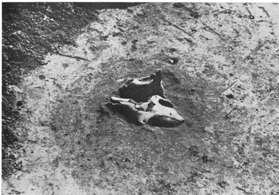
4. kép Ló- és szarvasmarha koponya egy XI. századi áldozati gödörben

5. A szabadkígyósi Tangazdaság homokbányájában feltárt X. századi temető egyik lovassírjánál a kedvező földösszetétel folytán szemmel is jól látható foltok