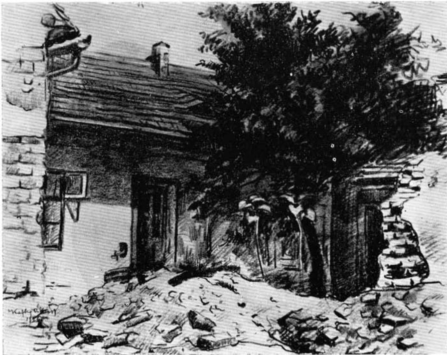
Abb. 5. ábra. Kafka Albert: Ipar utca 13 (Juhász Gyula udvara)

tás jövedelme, az 5 ezer koronás belépőjegyekből egymaga: 8 millió 900 ezer koronát tett ki. A jövedelem fokozásához lényegesen hozzájárult a telepzáró ünnepség: a Bohém-est. Egyedül tiszteletjegyek és felülfizetésekben: 2 225 000 korona gyűlt össze. A Bohém-est fényes anyagi sikerét bizonyítja, hogy az olcsó belépőjegyekből 10 140 000 korona folyt be. Lényegesen fokozta ezt a jövedelmet a képajándékjegyek árusítása, melyből összesen 231 darab kelt el, ami szintén 4 520 000 korona jövedelmet jelentett. Az újszegedi Vigadó bérlője az ott fogyasztott ételek és italok tíz százalékát, összesen 734 000 koronával szaporította a jövedelmet.”