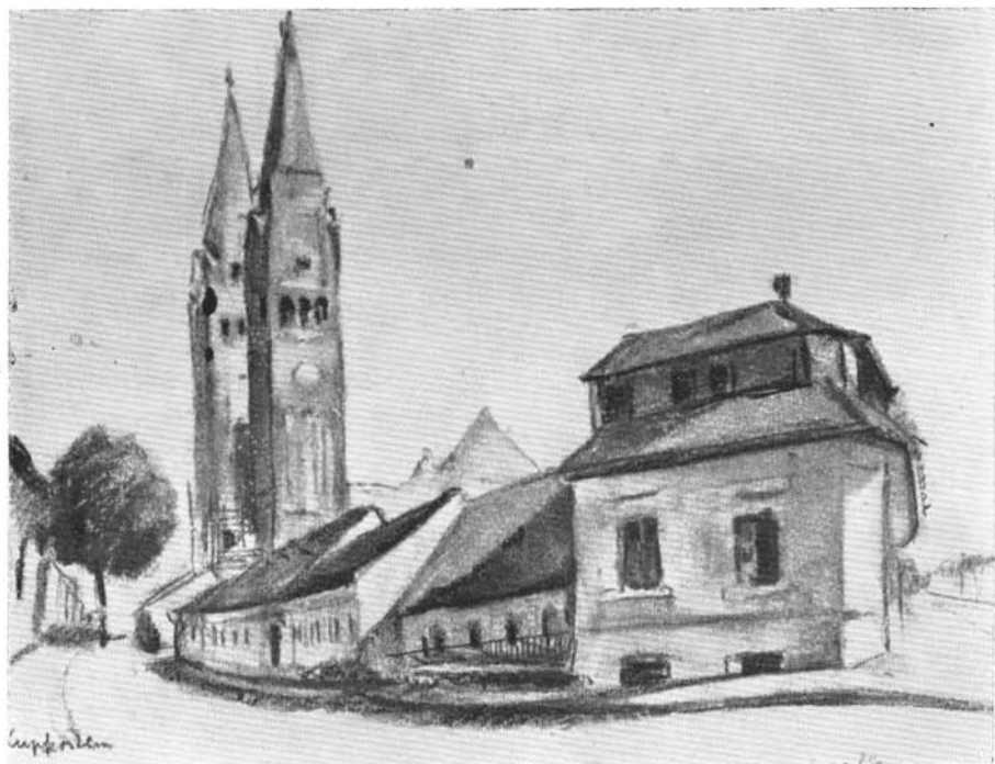
Abb. 4. ábra. Kufferstein Imre: Szegfű utca

A Dél-Magyarország már augusztus elsején jelzi, hogy a három alföldi város művésztelepeinek az a szándéka, hogy a hónap vége felé kiállítással és bállal összekötött műsoros esttel zárják be Rudnay növendékeinek nyári munkásságát. „A befolyó összes jövedelmeket – az újság szerint – a művésztelepek kivétel nélkül a szegény sorsú növendékek segélyezésére fordítják.” 24 Ez valóban úgy is történt. Rudnay szegedi művésztelepének kiállítása augusztus 29-én