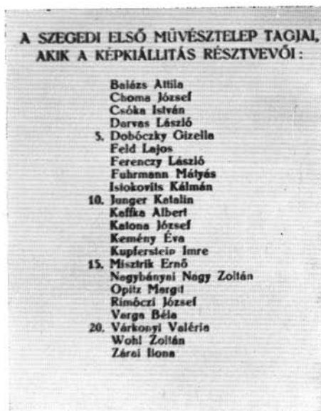
Abb. 1—2. ábrák. Kiállítási katalógus

művész birtokában van. 8 A következő évben, 1926-ban Rudnay szinte „köldök-zsinórja” volt Makó–Szeged–Vásárhely művészeti életének, mivel ezekben az alföldi városokban egyidőben levő művésztelepein gyakran megfordult. Hazai és külföldi sikerei által tekintélyessé vált neve, valamint az általa irányított festőnövendékek itteni kollektívái, szellemileg szorosabbá fűzték és frissebbé tették Csongrád megye akkori művészeti életét. Ezzel kapcsolatban kell említést tennünk arról az 1925 nyarán történt találkozásról, amely Diósszilágyi Sámuel makói orvos lakásán volt. Hajnalig tartó beszélgetésre Rudnay Gyula, Móra Ferenc, Juhász Gyula és Károlyi Lajos szegedi festő jöttek össze. A helyi kulturális szempontból jelentős festő, költő és író találkozót – Móra Ferenc születésnapjának tiszteletére –, Espersit János makói művészbarát ügyvéd szervezte meg. 9 Nyilván az ekkor kialakult baráti kapcsolatoknak sok közük van ahhoz, hogy a makói művésztelep növendékeinek 1927 szeptemberében rendezett tárlatát Juhász Gyula nyitotta meg, aki ebből az alkalomból „Rudnay és