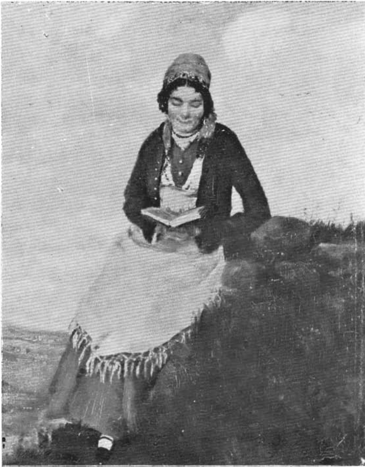
Abb. 6. ábra. Rudnay Gyula: Olvasó nő