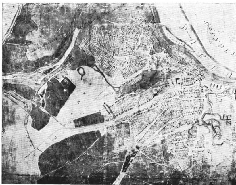
Abb. 2. ábra. A Buday-féle másolat a Balla-térképről (1814?)