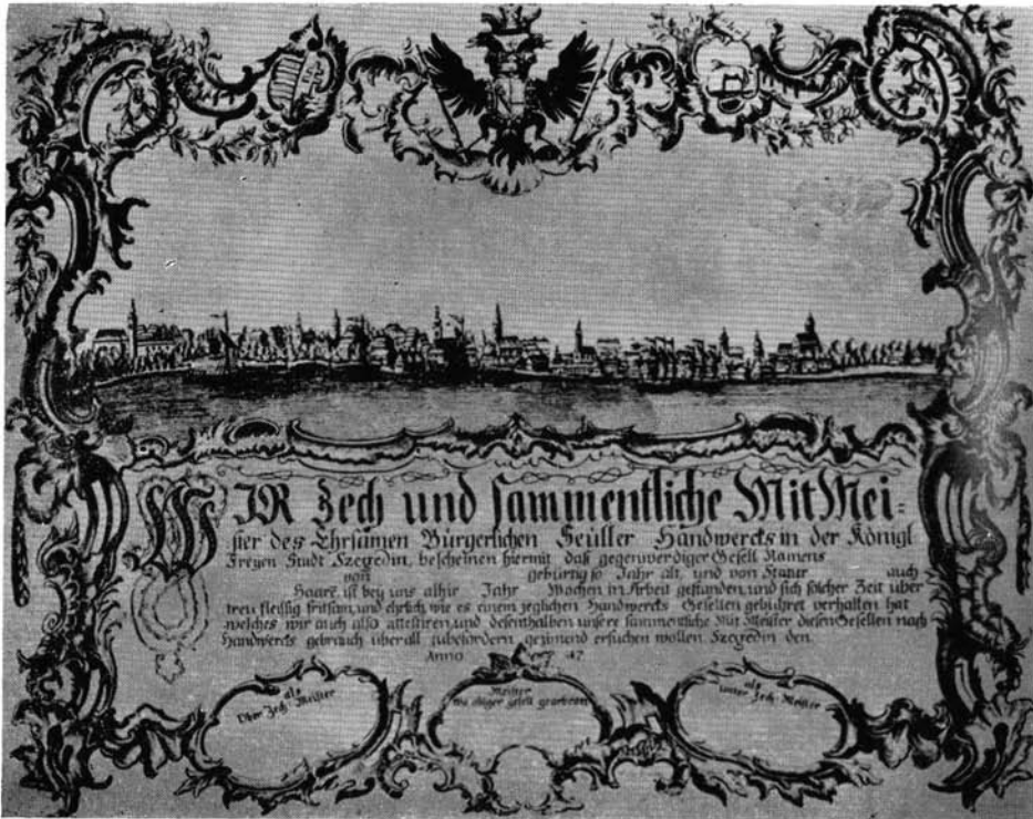
Abb. 3. ábra. Szegedi látkép egy XVIII. századi céhlevélen