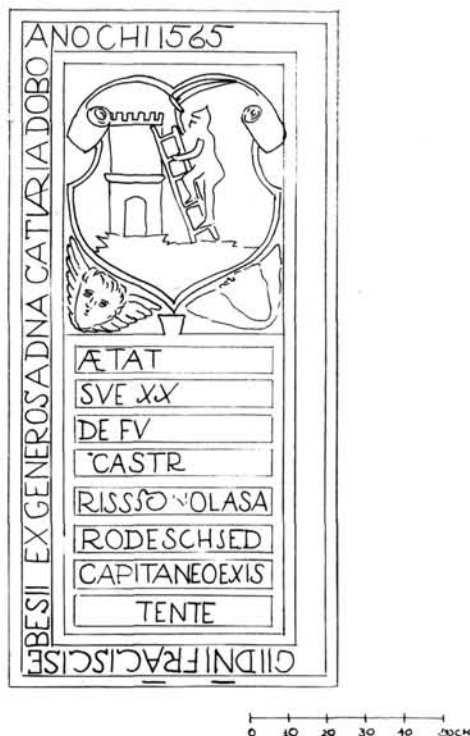
SÁROSPATAK Z. K. TEMPLOM SEBESI FERENC SÍREMLÉKE

3. Perényi Gábor sírládájának egy második töredéke 1567-ből.