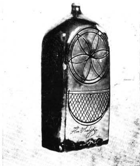
4. Az előbbi butella hátlapja.