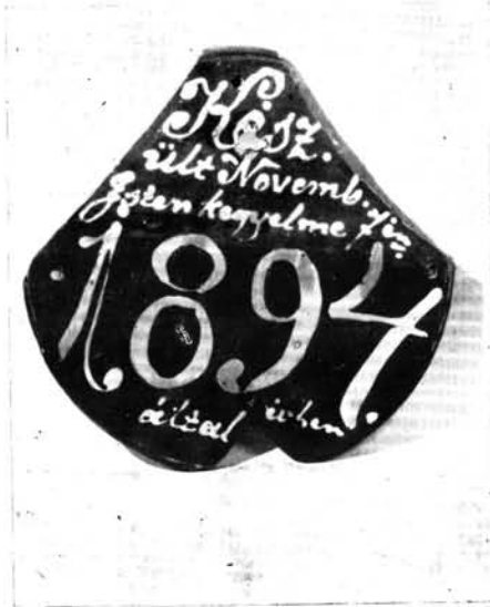
3. Tábla a padlás szarufájáról, 1894.