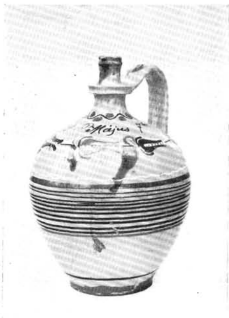
2. Butykoskorsó, „butykos”, Maksa Mihály munkája, saját használatra, 1889.