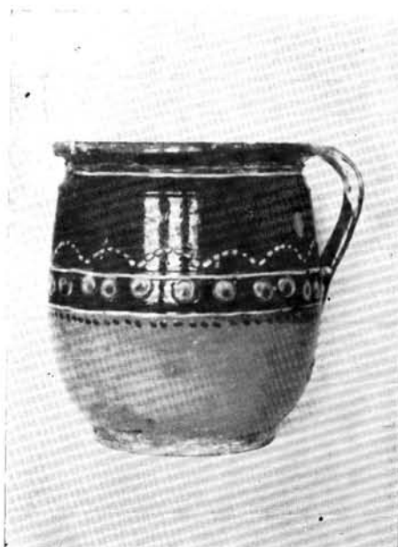
4. Szilke, Maksa Mihály munkája.