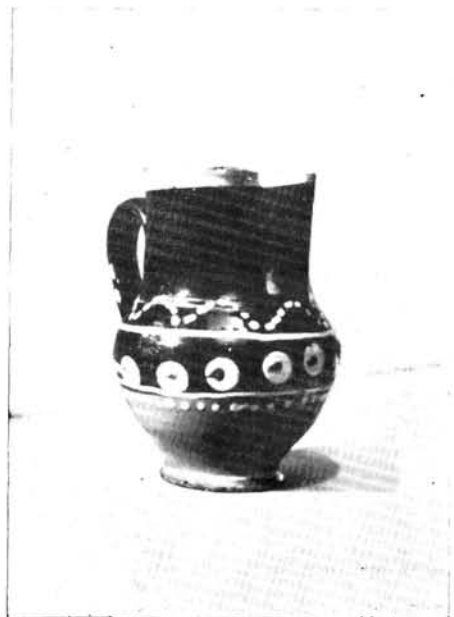
3. Kancsó, Maksa Mihály munkája.