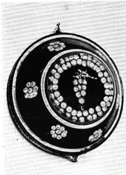
3. Varsányi Mihály „leveses tála” az 1850-es évekből, a fenti csalikancsó mintájának előzménye.