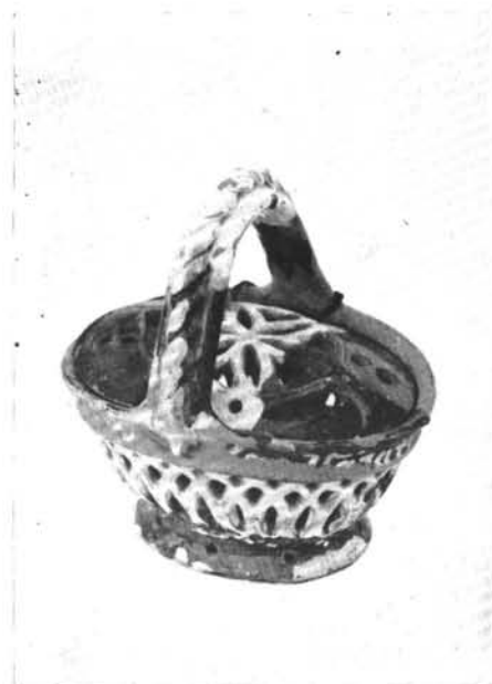
3. Cserépkosárka, „kis garaboj” Maksa Mihály aláírásával, 1898.