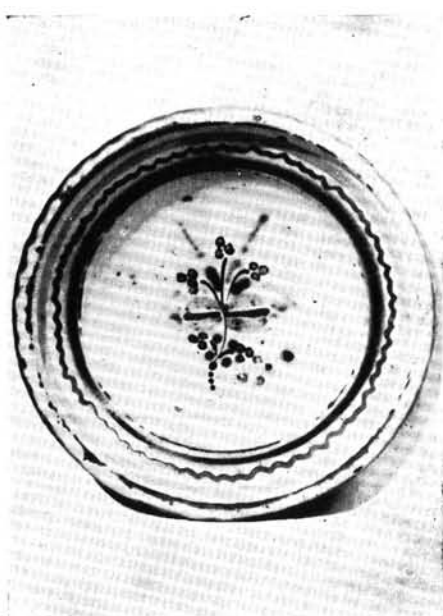
4. Tányér, ifj. Maksa István munkája.