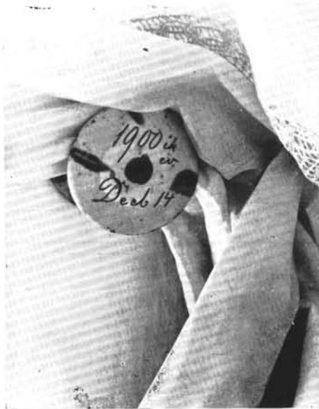
4. Fenti „firhanggomb”, 1900.