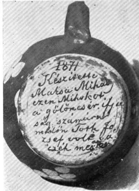
2. Az előbbi csalikancsó aljának felirata.