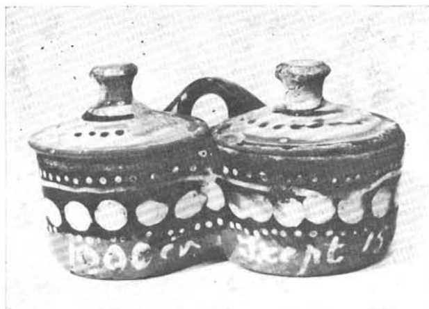
1. Párika-, sótartó Maksa Mihály aláírásával, 1900.