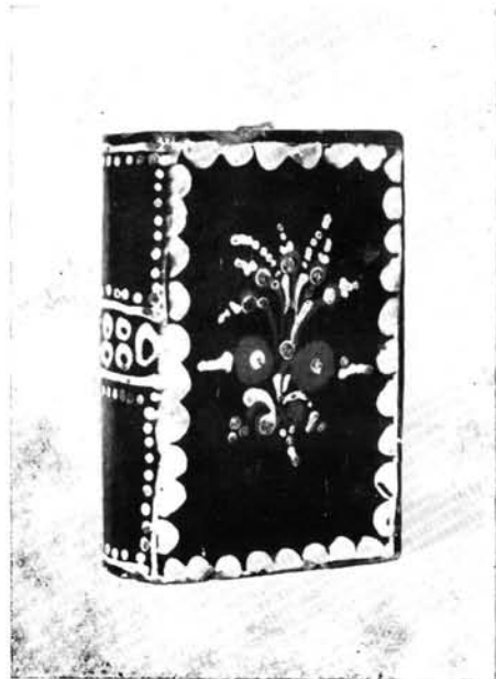
4. Könyvbutella, Maksa Mihály munkája Hernyár István számára, 1874.