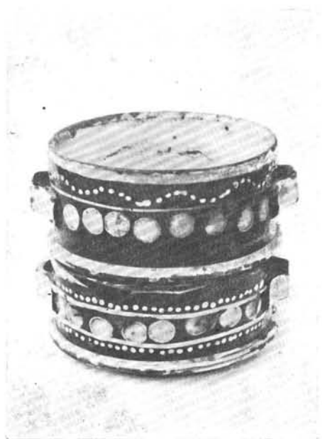
2. Komacsésze két részből, 1889 és 1900. Maksa Mihály munkája.