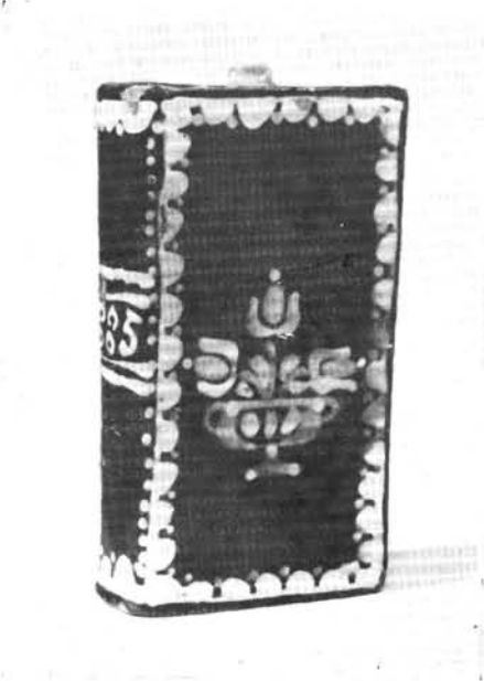
3. Könyvbutella, Maksa Mihály munkája, 1885.