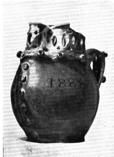
4. Csalikancsó, „rejtélyes kancsó”, 1888, id. Maksa István munkája.