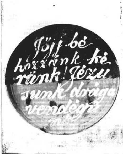
3. Ajtó fölötti feliratos falitábla Maksa Mihály házában.