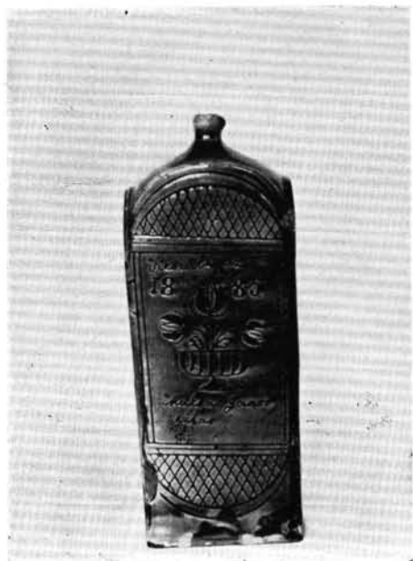
1. Butella, Maksa János tálas aláírásával, 1885.