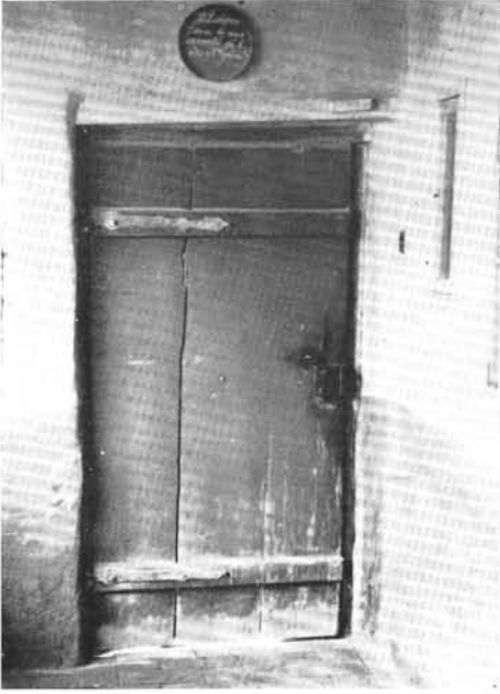
1. A bejáratú ajtó feletti tábla „Felséges Isten a mi szerető jó édes Atyánk” felirattal.