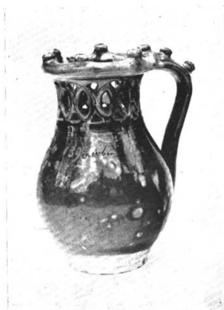
4. Csalikorsó, Maksa Mihály aláírásával, 1893.