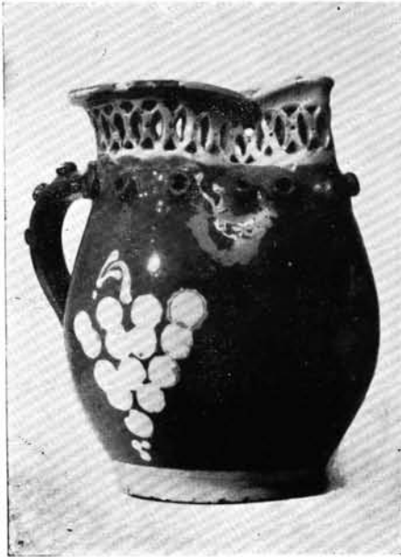
1. Csalikancsó, „mihók”, Maksa Mihály 20 éves korában, 1871-ben készítette.