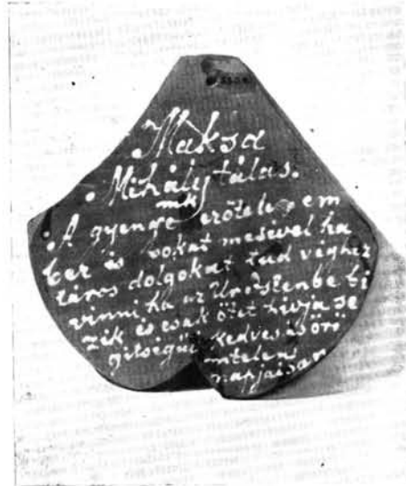
4. A fenti tábla hátlapja.