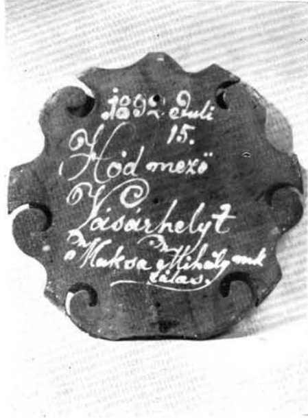
2. Az előbbi tábla hátlapja.