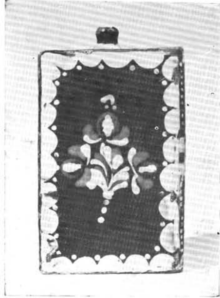
2. Könyvbutella, Maksa Mihály munkája, 1880.