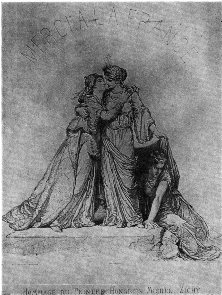
Zichy Mihály: A szegedi árvíz emlékérem terve