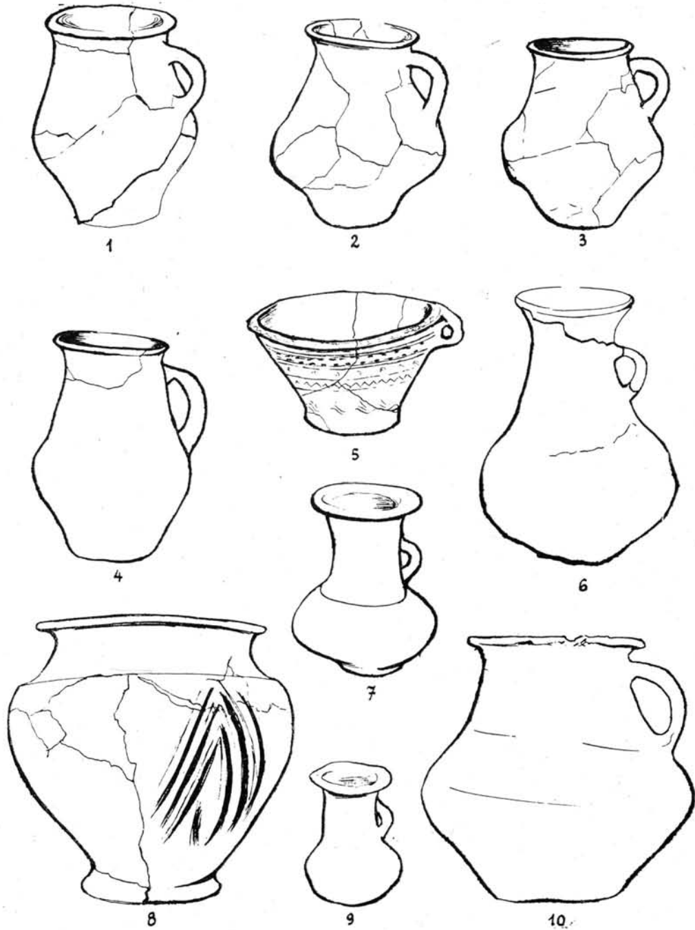
1—5. Hódmezővásárhely—Kökénydomb, 1. tűzhely; 6—7., 9. Hódmezővá- sárhely — ismeretlen lelőhely; 8. Hódmezővásárhely—Kökénydomb, 4. sír; 10. Hódmezővásárhely—Kotacpart, Vata-tanya (1:3).